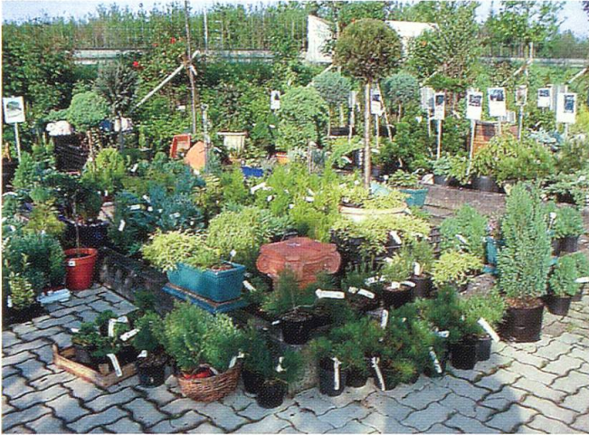
Interessante Kombinationen und Variationen können vom Kunden im Garten-Center bewundert und studiert werden.