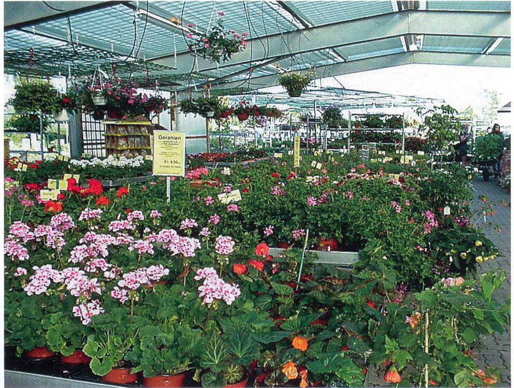
Sommerflor für Rabatten und Balkonkistli soweit das Auge reicht.