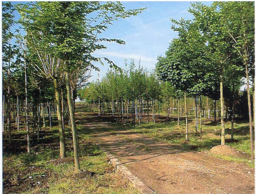
Alleebäume mit den unterschiedlichsten Formen und Lebensbedürfnissen stehen im Einschlag bereit.

Immer mehr Privatleute möchten direkt beim Produzenten einkaufen. Die Vermischung von Produktion und Verkauf führt aber immer wieder zu Problemen; 1978 wird deshalb das Garten-Center für die Bedienung der Privatkundschaft eröffnet. 1980, Umwandlung der Einzelfirma Konrad Roth in die Konrad Roth AG. Das Garten-Center wird laufend erweitert und 1981 das Bonsai-Center eröffnet. Es stehen japanische Bonsai sowie Bonsai aus europäischer Anzucht im Angebot. 1982 wird die Staudenkultur aufgebaut, um die immer grösser werdende Nachfrage nach Stauden aus eigenen Beständen abdecken zu können. Zu diesem Zeitpunkt gehörte zum Betrieb auch eine Höhenbaumschule in Schins/Trans im Domleschg auf 1650 m ü.M. Die Pflanzen aus dieser