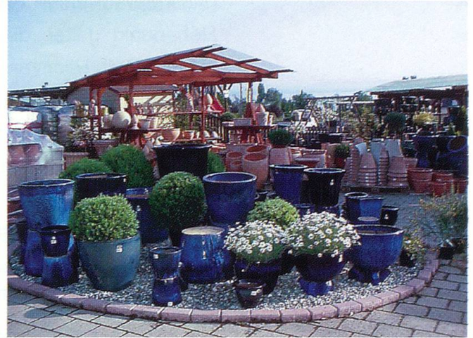
Töpfe, Töpfe – nichts als Töpfe. Für jeden Anspruch den richtigen Topf zu finden ist bei dieser Auswahl keine Kunst.

Höhe sind für Höhenlagen akklimatisiert und werden vor allem von Gartenbau-Kunden in Graubünden und für Spätpflanzungen in tieferen Lagen verwendet. Im Laufe der Zeit zeigte sich aber die Bewirtschaftung auf diese grosse Distanz durch ein ausgereiftes Angebot aus den Kulturen am Bodensee als nicht wirtschaftlich und nicht mehr zeitgemäss.