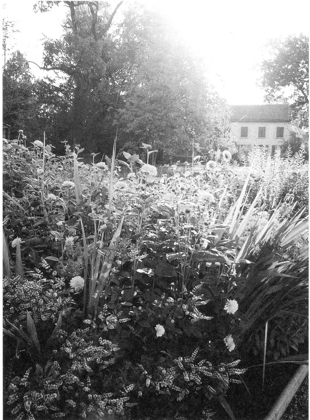
Blumenpracht in der warmen Jahreszeit

wie auch im Alltagsmenü. In den Dörfern sind immer noch vorwiegend Frauen stolz auf ihre gepflegten Hausgärten, es kann ein eigentlicher Wettbewerb ausbrechen, wer den üppigsten Geranienschmuck vor den Fenstern hat oder den schönsten Blumenflor im Garten. Aber es verschwinden auch Gärten. Sei es bei einem Hausbesitzerwechsel, wo man einen altmodischen, gepflegten Garten antritt und dann kein Interesse mehr daran hat, ihn vernachlässigt oder einen pflegeleichteren Rasen