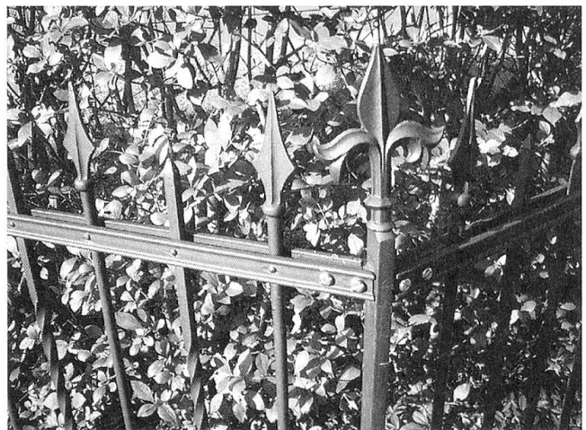
Der Zaun macht den Garten

Färberpflanzen wuchsen, ob er nahe beim Bauernhaus, auf einer Burg oder eben im Klostergelände lag. Zusätzlich gab es den Krautgarten, der schon als Teil des Ackerlandes angesehen werden kann, dort wuchsen Kraut (Mangold) und Rüben. Beide Nahrungsmittel wurden einge- macht, um sich über den Winter mit Gemüse zu versorgen. Nicht weit vom Haus entfernt konnte auch der Flachsacker stehen für die Textilfa- sergewinnung und ein Baumgarten, in dem die verschiedenen Obstsorten wuchsen. Eine klare Trennung zwischen dem Anbau von Nahrungs-, Gewürz- und Heilmitteln wurde nicht angestrebt, so wenig wie es damals in Dörfern reine Blumen- oder Lustgärten zur Erholung gab. Nur wenige Blumen fanden Platz in den Hausgärten, immer wurden sie auch gezo- gen wegen eines bestimmten Wirkstoffes. Jedes geeignete Stück Erde