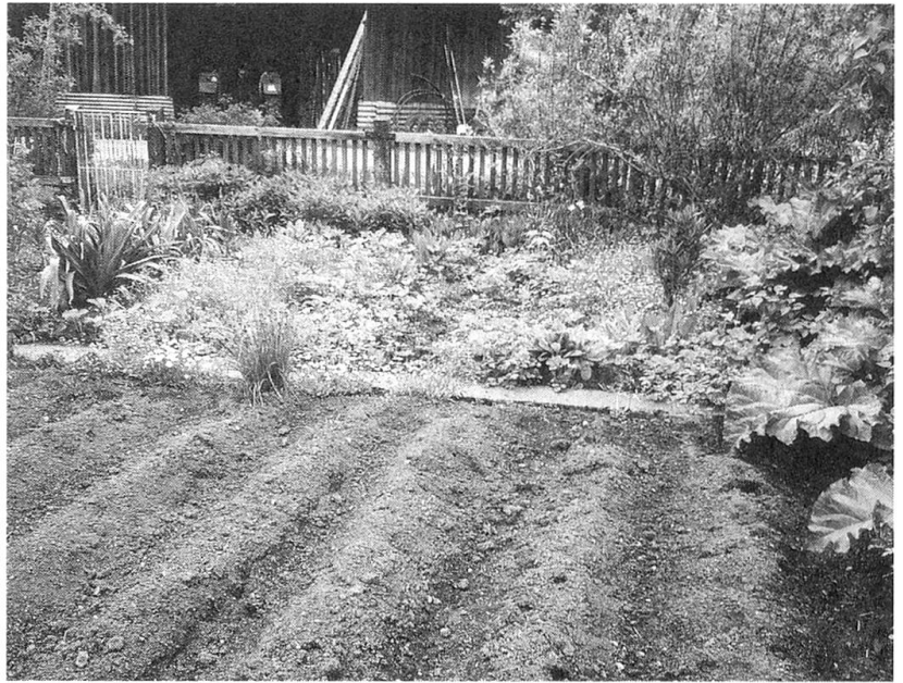
Bauerngarten im Frühling: vorne Kartoffeln gestupft

ansät. Oder die hübschen Vorgärten bei Bürgerhäusern, die einst deren Visitenkarten waren, mit zierlich geschmiedeten Zäunen, mit Rosenstöcken oder einem Fliederbaum, dieses Stückchen kultivierten Landes zwischen Strasse und Haus, das heute ohne Bedauern geopfert wird, um dafür einen asphaltierten Parkplatz gleich vor der Haustür zu haben. Es gibt oder gab zahlreiche historische Gärten im Thurgau, bei Fabrikvillen, Pfarrhäusern, manche von Gartenarchitekten entworfen,