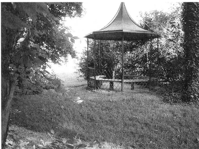
Das Gartenhaus gehört in jeden grösseren Garten oder Park