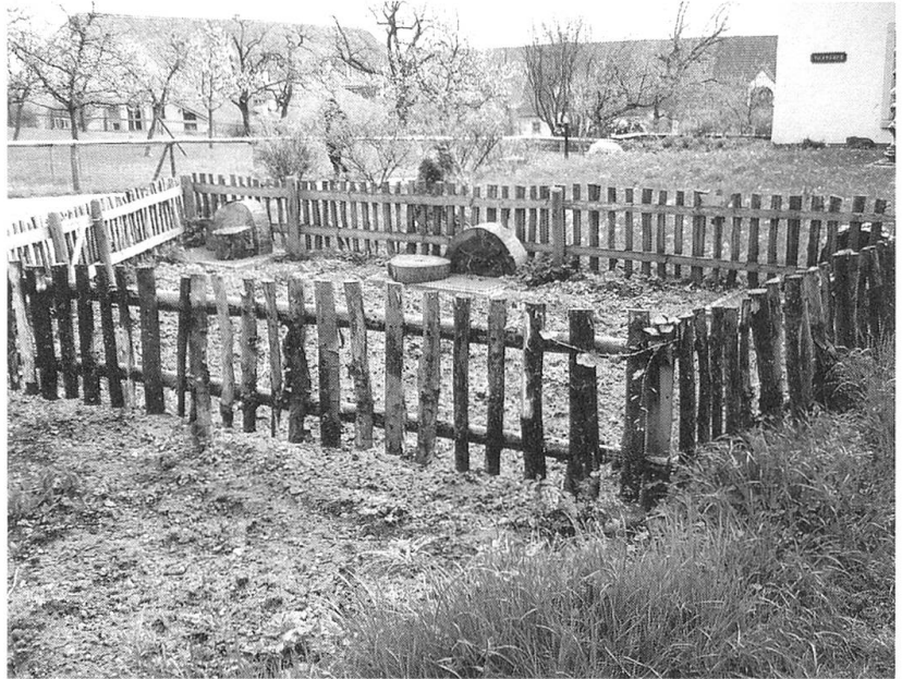
Der «Urgarten»: ein Stück gerodetes Land und ein Zaun aus Holzlatten darum herum.

tern als Vorlage für ihre verschiedenen Gärten benutzt wurden. Aber warum sollen die ersten Bewohner an den Seen und im Landesinnern nicht bereits umzäunte Pflanzplätze angelegt haben? Wenn sie verstanden, Tiere zu zähmen und durch Züchtung für ihre Bedürfnisse zu verändern, dann verstanden sie doch auch, Pflanzen in der Nähe ihrer Häuser zu domestizieren? Sie wussten, wie Flechtwerke für die Hauswände herzustellen waren, warum dann nicht auch dafür, den Hausgarten damit einzuzäunen?