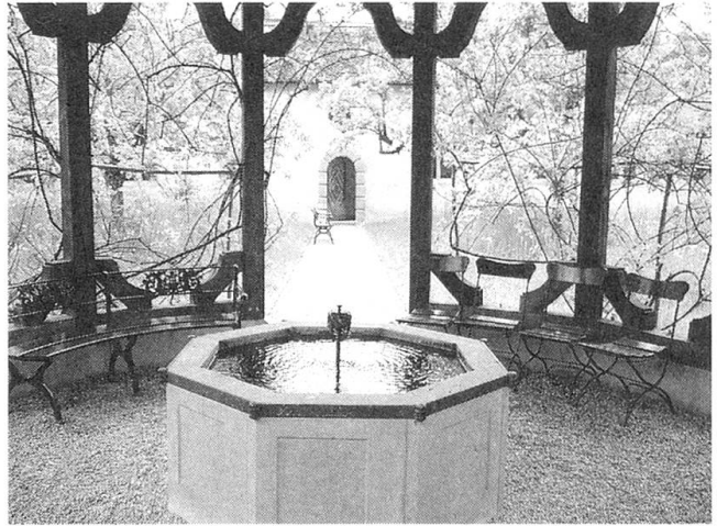
Wasser aus dem Brunnen, um die Pflanzen tränken zu können