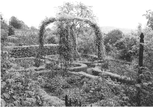
Mönchsgärtchen in der Kartause Ittingen