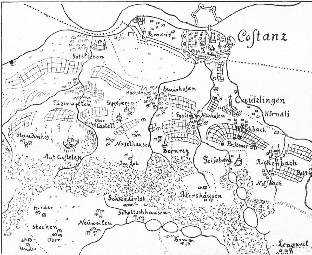
Fig. 25. Die Weinberge bei Konstanz im Jahre 1720. (Nach Dänickers Kopie der Nötzlikarte 1789.)

fehlen noch manche durch Gyger konstatierte Weinberge. Zwischen Basadingen und Schlattingen, nördlich vom Geißli- bach hat es jedenfalls nie Reben gehabt, dagegen am Roden- berg, der hier, wie auf allen Nötzlikarten, viel zu weit von Schlattingen entfernt ist. Weder aus der alten Karte von 1717 noch aus derjenigen von 1720 können größere Aende- rungen in der Verteilung des Reblandes herausgelesen werden.