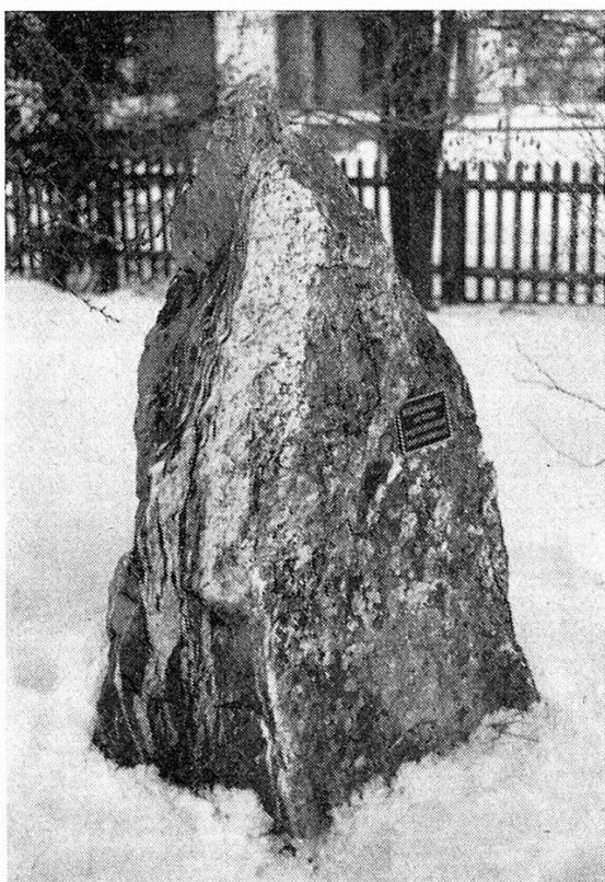
Bild 1. Findling aus Malmkalk im Garten des Lehrerhauses in Basadingen.

den, bis Sekundarlehrer Engeli dafür sorgte, daß der Überrest unter Naturschutz gestellt wurde. Aus dem Boden ragende meterhohe Zacken und Platten im Umkreis von mehr als 10 Quadratmetern deuten noch die einstige Größe des Findlings an. Was am Strande von Arbon durch Wellenschlag freigelegt wurde, ist heute in den Seeanlagen aufgestellt. Aus jener Pionierzeit ist auch der Gürtelstein, ein Taspinit , im Hafen von Romanshorn erhalten geblieben. Ein Fragebogen über erratische Blöcke wurde damals an alle thurgauischen Ortsbehörden verschickt, aber die wenigsten wurden beantwortet! Das ist zwar verständlich, denn die meisten Findlinge waren nicht mehr im freien Felde anzutreffen, sondern in den Bachtöblern, unter Moos und Stauden verborgen. Erst als einzelne Naturforscher sich intensiv dieser Naturdinge annahmen, kam es dazu, daß sie nicht mehr dem ungewissen Schicksal überlassen blieben. Vor allem hat sich Dr. h. c. H. Wegelin nicht bloß der großen Steine angenommen, sondern sich auch um die Sammlung der Gerölle verdient gemacht. Ihm standen drei Freunde, die Professoren A. Heim , J. Früh und U. Grubenmann von der Eidgenössischen Technischen Hochschule, gerne für die Bestimmungen der Gesteine und besonders auch für die Bezeichnung ihrer Herkunft zur Verfügung. Im Heft 30 der «Mitteilungen der Thurgauischen Naturforschenden Gesellschaft» hat Professor Wege-