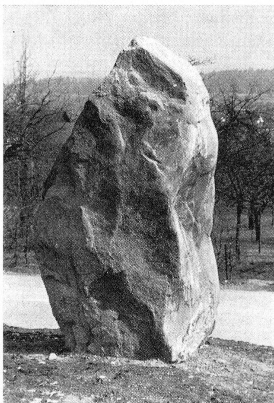
Bild 2. Kalksteinfindling aus der Bündner Schieferzone des Piz Beverin. Standort: Turnplatz von Mettschlatt.