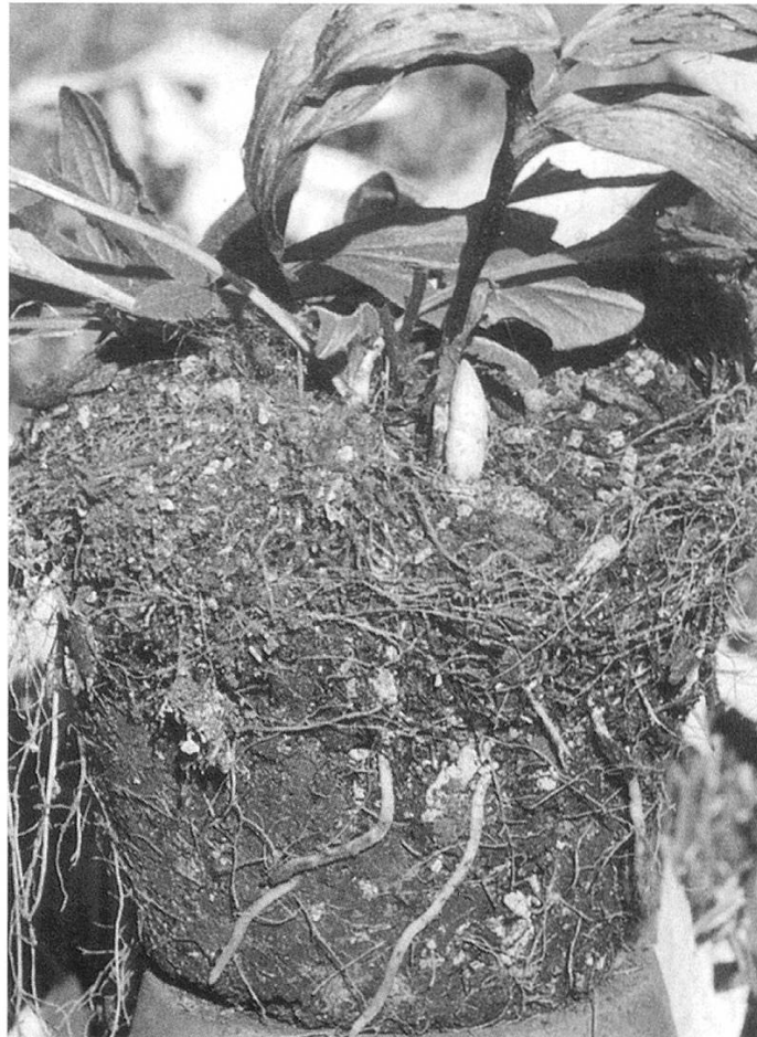
Abbildung 2: Nach einem Jahr Topfkultur hat die Pflanze eine neue, kräftige Knospe und ist zum Auspflanzen geeignet.