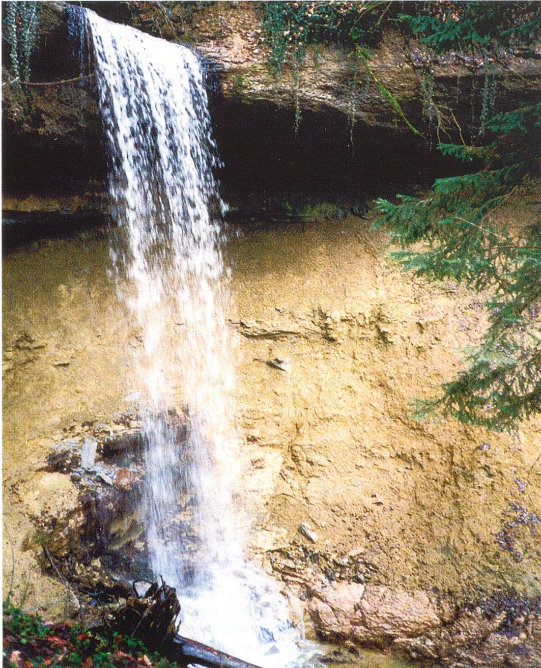
Abbildung 3: Wasserfall im obersten Lauftenbachtobel, Gottshaus (TG)

In Tabelle 1 sind die Bewertungskriterien gemäss Kapitel 2.1 eingetragen. Wie oben dargelegt, wird zwischen der Geowissenschaftlichen Bedeutung und der Bedeutung für die Gesellschaft unterschieden. Hinter dem jeweiligen Kriterium steht die Punktzahl, die das Objekt erhalten hat. In der untersten Zeile werden die Punkte addiert. Aus der Summe ergibt sich die Bedeutung. 3