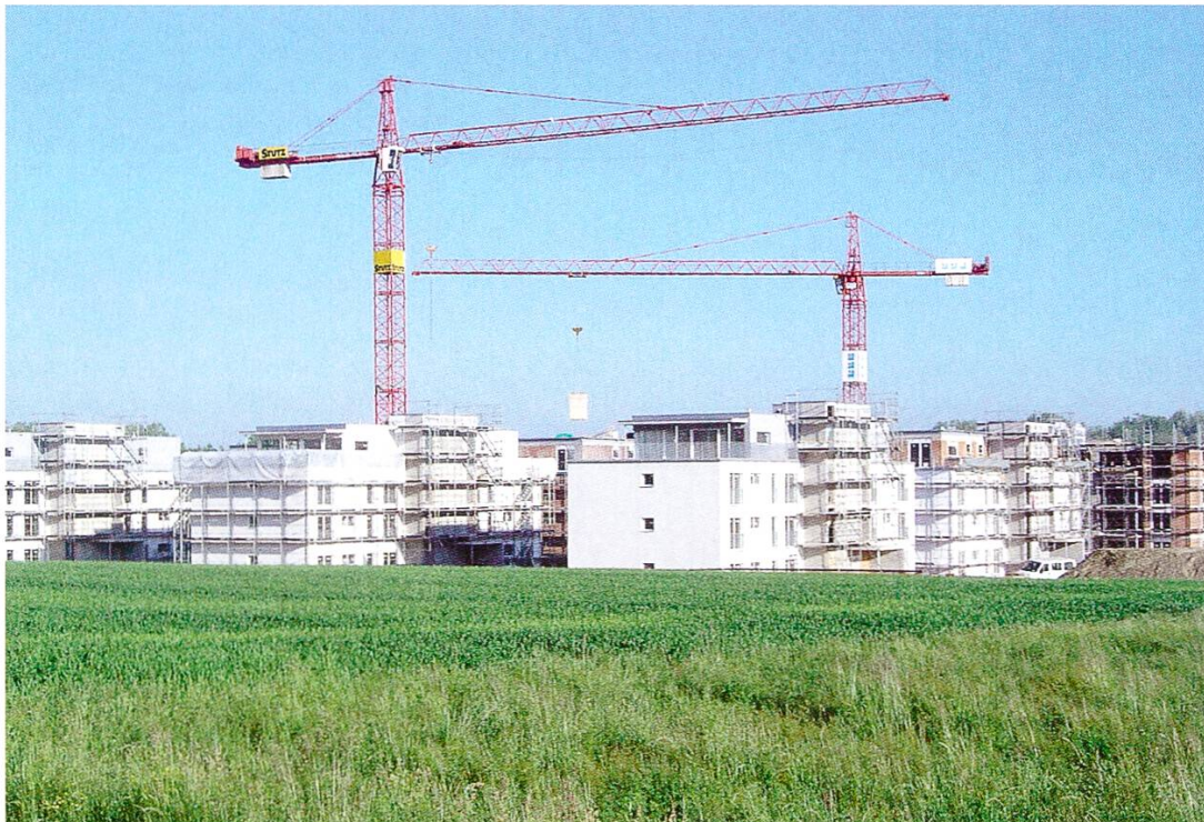
Abbildung 1: Überbauung Frauenfeld Ost (Aufnahme 7.6.2006/Ueli Hofer)

Die heutigen Ansprüche an unseren Raum – an den Boden – sind vielfältig. In den vergangenen Jahrzehnten hat sich der Wettstreit zwischen konkurrierenden Nutzungen stetig verschärft. Land wird für Boden erhaltende Nutzungen wie die Land- und Forstwirtschaft, den Naturschutz oder für Freiflächen und für Erholung benötigt oder beansprucht. Boden verändernde Nutzungen verwenden den Boden als Baugrund; auf dem Boden entstehen Bauten und Anlagen für Wohnen, Arbeiten, Verkehr, Ver- und Entsorgung, Freizeit usw. Allen Nutzungen gemeinsam ist, dass entsprechender Boden dafür nicht unbeschränkt verfügbar ist. Wie mit dem unvermehrten Gut Boden umgegangen werden soll, ist daher eine zentrale Frage in der Raumplanung.