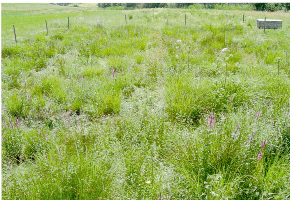
Abbildung 3: Die gesamte Versuchsanlage In Kurzen Teilen im Juli 2006.