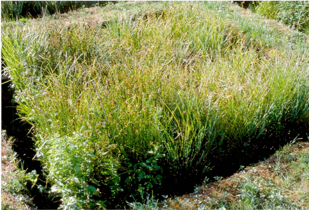
Abbildung 2: Versuchsfläche zur Untersuchung von artspezifischen Wachstumseigenschaften und Interaktionen zwischen den Arten auf die Vegetationsentwicklung. (Juli 2002)

Die Pflanzen wurden im Mai 2001 In Kurzen Teilen auf Flächen von 2,6 m x 2,6 m angesetzt (Abbildung 2 und 3), wobei zuvor 30 cm des Oberbodens abgeschürft wurden (Ramseier 2000). Die Biomasse der 12 Arten wurde zwischen 2001 und 2003 mit einer nichtdestruktiven Methode erfasst (Goodall 1952, Suter 2004); zwischen 2004 und 2008 wurden Deckschätzungen vorgenommen. Die Effekte der Artidentitäten und der Konkurrenz auf die Vegetationsentwicklung wurden mit Regressionsanalysen quantifiziert (Suter et al. 2007).