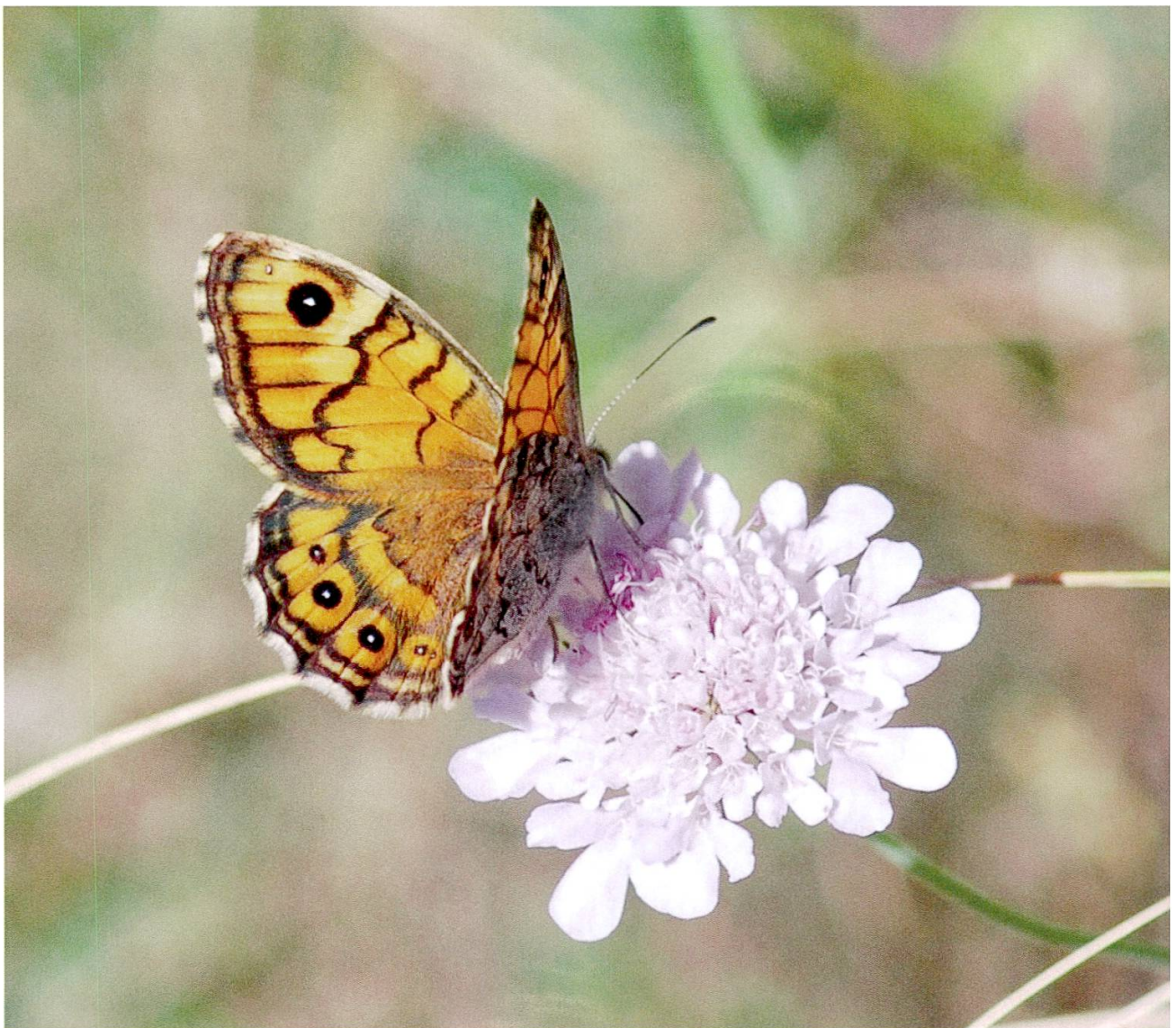
Abbildung 4: Mauerfuchs.

C-Falter ( Polygona c-album , Linnaeus 1758): Seine Raupen entwickeln sich an Brennnessel, Hopfen und verschiedenen Laubgehölzen. Der in der ganzen Schweiz vorkommende Falter ist nirgends selten und fliegt in Wald- oder Heckenähe, aber auch in Siedlungen.