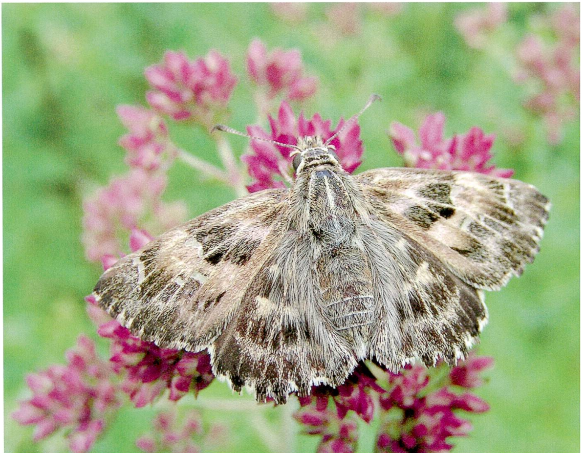
Abbildung 2: Malven-Dickkopffalter. (Foto: Jörg Möri)

Zitronenfalter ( Gonepteryx rhamni , Linnaeus 1758): Sein Lebensraum sind Wald-ränder, Waldwiesen, Parkanlagen und Gärten, wo seine Raupen-Futterpflanzen Faulbaum oder Kreuzdorn wachsen. Der Zitronenfalter schaltet sowohl nach dem Schlüpfen im Sommer als auch über den Winter je eine lange Ruhepause ein und überwintert als Falter. Mit über elf Monaten Lebensdauer wird er von keiner anderen einheimischen Art übertroffen. Auch diese Art war gegen Ende des letzten Jahrhunderts während Jahren bei uns fast verschwunden, ist jedoch wieder merklich häufiger geworden.