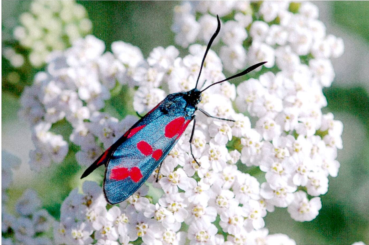
Abbildung 1: Gewöhnliches Widderchen.

Dunkler Dickkopffalter ( Erynnis tages , Linnaeus 1758): Der bereits früher seltene Falter galt nach 1985 im Thurgau als verschwunden. 2004 wurde er in der Ochsenfurt wiederentdeckt. Dort hat sich inzwischen eine grössere Population entwickelt, und die Art breitet sich von dort immer weiter aus. 2008 wurde der Falter auch im Untersuchungsgebiet in der Trockenwiese 8 und deren westlicher Verlängerung ( Fläche 7 ) festgestellt.