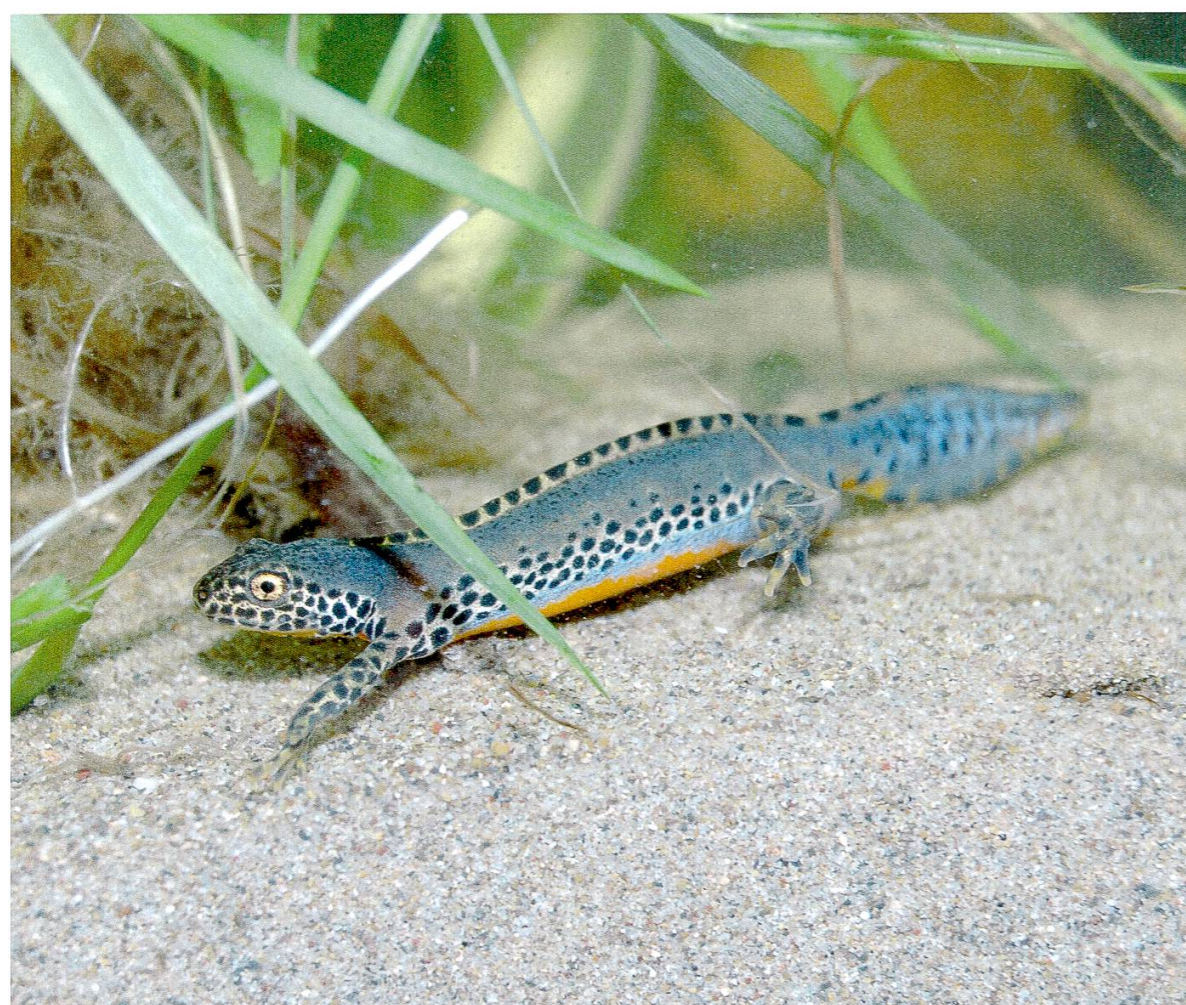
Abbildung 2: Bergmolch.

Vom Teichmolch konnten im Seebachtal bisher nur Einzeltiere beobachtet werden, dafür in vier verschiedenen Gebieten. Für diese unauffällige Art sind aber geringe Beobachtungszahlen nicht ungewöhnlich. Umfangreiche Abfischungen von Gewässern haben immer wieder gezeigt, dass die Populationen viel grösser sind als vermutet ( Laufer et al. 2007 ). Während der landlebenden Phase ab Mitte Juni werden die Verstecke über längere Zeiträume genutzt und meist nur kleinräumige Wanderungen unternommen. Die Ausbreitungswanderungen erfolgen vor allem durch die Jungtiere. Diese Tatsache legt auch beim Teichmolch die Annahme nahe, dass die Art zuvor noch vereinzelt im Gebiet vorhanden war. Wie im Gebiet In Langen Teilen kommt der Teichmolch häufig in Gesellschaft mit dem Kammmolch vor.