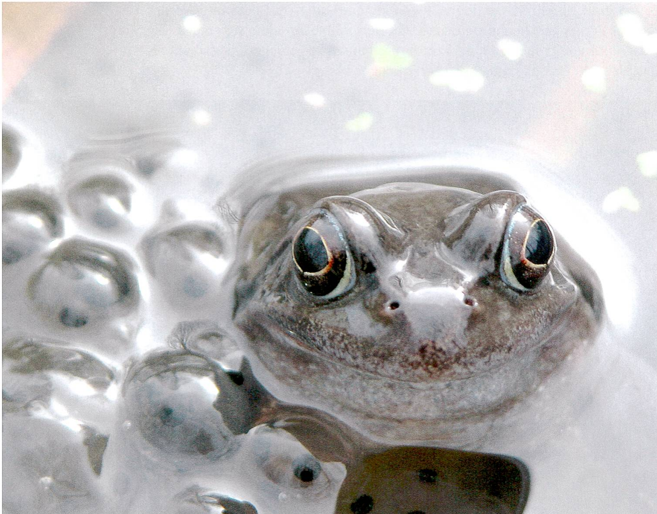
Abbildung 3: Grasfrosch inmitten seines Laichs.