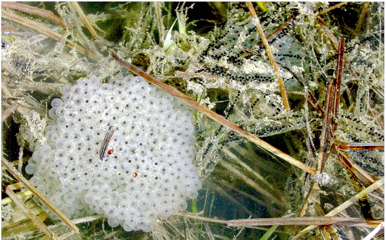
Abbildung 4: Laich von Grasfrosch und Erdkröte.

Ausserhalb der Fortpflanzungszeit halten sich die meisten Kreuzkröten in der näheren Umgebung der Gewässer auf. Über diese Landphase der Kreuzkröten ist wenig bekannt. Wo die Sommerlebensräume im Seebachtal liegen könnten, ist schwer zu sagen. Tagsüber verstecken sich die Tiere unter Steinen und Brettern oder graben sich in lockere Erde oder Kies ein. Während ihrer aktiven nächtlichen Nahrungssuche nehmen die Kreuzkröten jede Beute an, die sie auf Grund ihrer Körpergrösse überwältigen können. Kleinere Beutetiere werden mit der Zunge geschnappt, grössere mit den zahnlosen Kiefern gepackt. Zur Überwinterung graben sich die Kreuzkröten meist im Sommerlebensraum ein und wandern erst im Frühjahr zu den Laichgewässern zurück.