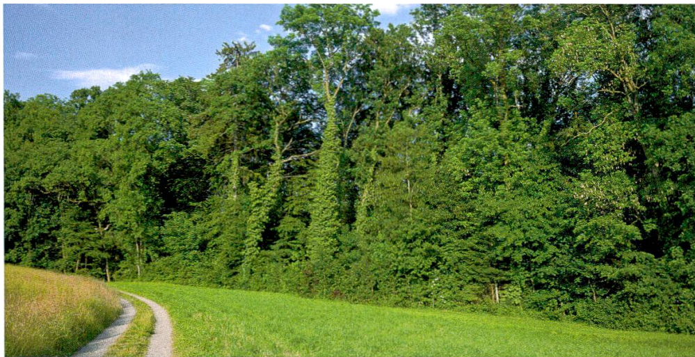
Abbildung 4: Jagdgebiet an einem Waldrand mit markanten, hochgewachsenen Eschen. Waldstandort: Typischer Ahorn-Eschenwald (Foto: René Güttinger).