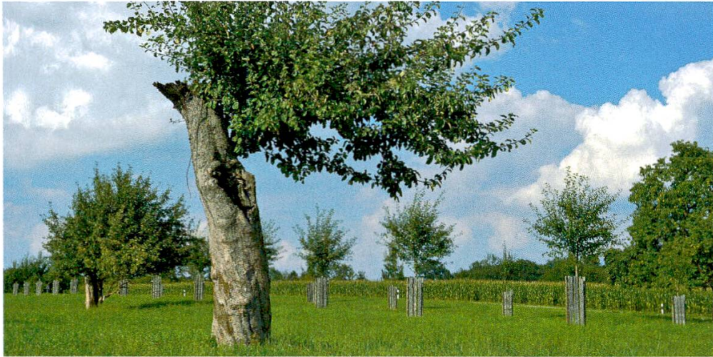
Abbildung 12: Die nachhaltige Förderung von Hochstammbäumen ist eine langfristige Aufgabe (Foto: René Güttinger).

Beispielhaft und eine im Thurgau bereits mit Erfolg praktizierte Massnahme ist das Obstbaumförderprojekt von Pro Natura Thurgau. Dabei werden im Rahmen der «Hochstamm-Aktion» ausgewählte Hochstamm-Obstsorten zu günstigen Konditionen an Landwirte und Private mit eigenem Obstgarten abgegeben (Pro Natura Thurgau 2014).