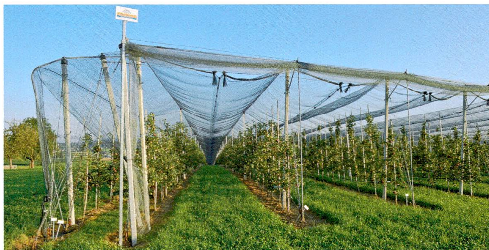
Abbildung 7: Jagdgebiet in einer Niederstammanlage mit Hagelnetz.