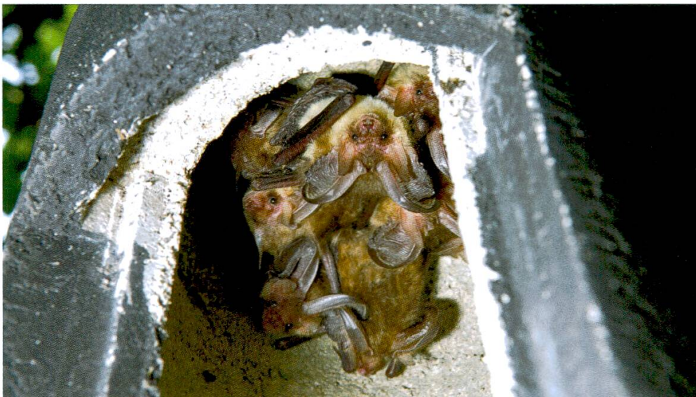
Abbildung 14: Auch in Obersommeri bald anzutreffen? Wochenstubenkolonie des Braunen Langohrs in einem Fledermauskasten, aufgenommen in einer Hochstammanlage in Waldkirch SG.

Im Zuge der noch immer laufenden Hochstamm-Aktion von Pro Natura Thurgau konnte in Obersommeri ein Landwirt für die Mitarbeit gewonnen werden. In seiner grossen Hochstammanlage, in welcher mehrere jagende Braune Langohren nachgewiesen werden konnten, sollen zusätzlich acht Bohnapfelbäume gesetzt werden. Zudem konnten in derselben Anlage als Baumhöhlenerersatz 24 Fledermauskästen platziert werden, welche künftig regelmässig durch Mitarbeiter der Thurgauischen Koordinationsstelle für Fledermausschutz auf einen Besatz hin kontrolliert werden ( Abbildung 14 ).