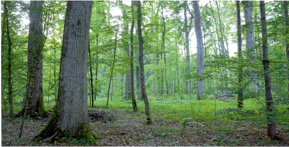
Abbildung 3: Jagdgebiet in einem ehemaligen Mittelwald. Mehrheitlich unterholzfreier Hallenwald mit mächtigen Eichen und Eschen und nur stellenweise vorhandener Krautschicht. Waldstandort: Aronstab-Buchenwald.