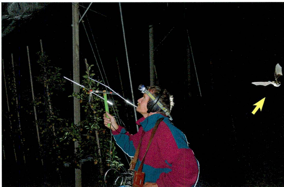
Abbildung 9: Besonders in Niederstammanlagen mit Hagelnetz konnten mehrmals jagende Braune Langohren beobachtet werden. Ein neugierig gewordenes Langohr umkreist den mit Peilen des Sendertiers beschäftigten Mitarbeiter.

Peilsignale und wenige Direktbeobachtungen ergaben Aufschluss über das Jagdverhalten der Sendertiere ( Abbildung 9 ). Im Wald jagten die Langohren unterhalb des Kronendachs im Stammbereich sowie über dem Boden. In einem Jagdgebiet wurden zwei Langohren beobachtet, welche im langsamen Suchflug in rund 50 cm Flughöhe über dem mehrheitlich vegetationsfreien Waldboden patrouillierten.