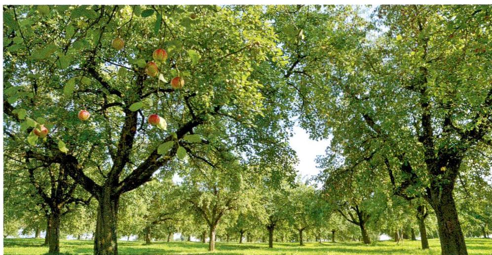
Abbildung 6: Jagdgebiet in einer grossflächigen Hochstammanlage.

Jagdgebiete wurden ausserdem in fünf Niederstammanlagen nachgewiesen. Diese waren gegen oben und an den Seiten parallel zu den Baumzeilen bis auf den Boden herab mit Hagelnetzen abgedeckt. Einzig auf beiden Stirnseiten waren die Netze aufgerollt und die Anlagen offen ( Abbildung 7 ). Die Obstkulturen bestanden ausschliesslich aus Apfelbäumen oder wiesen zumindest einen dominanten Apfelbaumanteil auf.