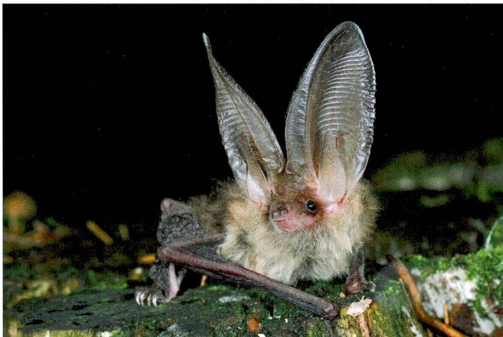
Abbildung 1: Das Braune Langohr gehört zu den mittelgrossen Fledermausarten. Auffällig sind die fast körperlangen Ohrmuscheln.

Das Braune Langohr Plecotus auritus ist eine von zwanzig für den Kanton Thurgau nachgewiesenen Fledermausarten ( Abbildung 1 ). Die Art gilt in der Schweiz als weit verbreitet ( Rutishauser et al. 2012 ) und kommt im gesamten Kantonsgebiet vor, allerdings in regional unterschiedlicher Bestandesdichte. Die bis jetzt im Sommerhalbjahr nachgewiesenen Tagesquartiere werden typischerweise von kleinen Gruppen von zehn bis zwanzig Individuen bewohnt. Die meisten Quartiere befinden sich im Dachgeschoss von Kirchen und Wohnhäusern mit traditioneller Bauweise. Es sind auch einige wenige Vorkommen von Braunen Langohren in Fledermauskästen belegt. Baumhöhlenquartiere, welche die Art ebenfalls regelmässig nutzt ( Beck et al. 1995, Dietz & Kiefer 2014 ), sind aus methodischen Gründen bislang keine bekannt. Insgesamt besteht der Eindruck, dass die ohnehin kleinen Bestände des Braunen Langohrs im Thurgau stark am Schwinden sind. Mehrere Beobachtungen aus den letzten zehn Jahren deuten darauf hin. So sind heute etliche vor dem Jahr 2000 besetzte Quartiere mittlerweile verwaist, und die Populationszahlen nehmen in den meisten Quartieren ab. Zudem werden nur wenige besetzte Quartiere neu bekannt – dies im Gegensatz zu den Vorkommen anderer im Thurgau verbreiteter Arten, von denen in gewisser Regelmässigkeit immer wieder neue Verstecke erfasst werden können.