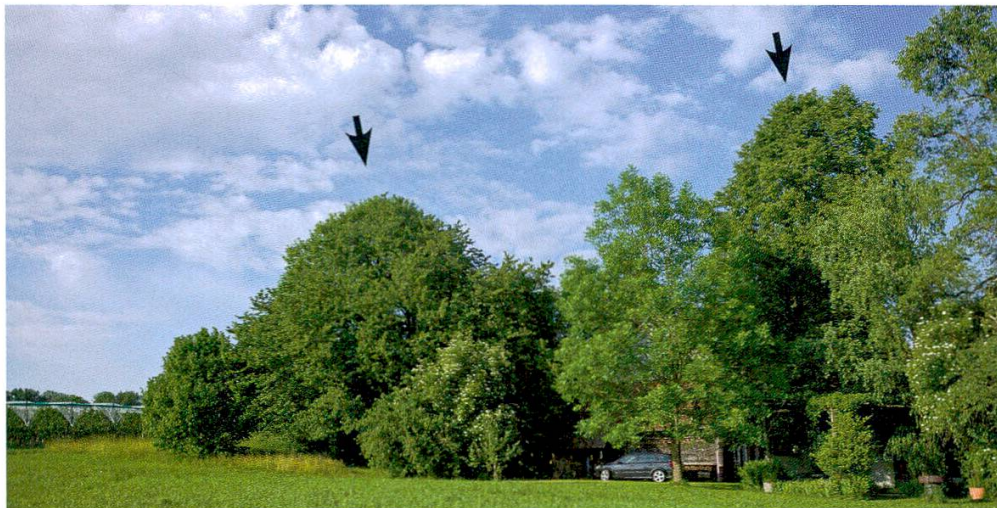
Abbildung 5: Jagdgebiet in einer freistehenden Baumgruppe. Gejagt haben die Sendertiere im Kirschbaum (links im Bild) und in der Linde (rechts).