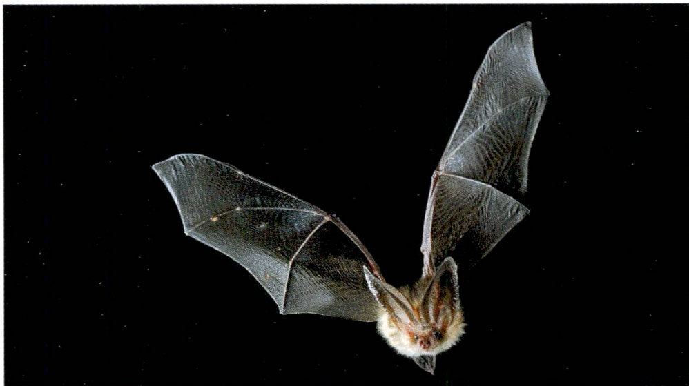
Abbildung 11: Dank seiner breiten Flügel kann das Braune Langohr sehr langsam fliegen. Mit dieser Anpassung im Flügelbau kann die Art mit der Schnauze die auf Blättern, Ästen und anderen Strukturen sitzenden Beutetiere ablesen.

Auf dem thurgauischen Seerücken nutzten jagende Braune Langohren verschiedene Lebensräume. Diese umfassen die Lebensraumtypen Wald, Waldrand, Feldbaum sowie Hochstammanlage sowie Niederstammanlage mit Hagelnetz. Gemeinsames Merkmal aller Jagdgebiete war das Vorhandensein von Bäumen. Dementsprechend jagten die Fledermäuse zur Hauptsache in den Baumkronen. Einzig im Wald suchten die Tiere im Stammraum und bodennahen Bereich nach Beute. Braune Langohren sind äusserst geschickte und wendige Flieger, die ihre Beute von Substraten aufnehmen oder im freien Luftraum erbeuten können (Anderson & Racey 1991, Beck 1995, Swift 1998, Andreas et al. 2012). Die Beobachtungen aus den Niederstammanlagen, wo Braune Langohren die Falter von der Unterseite des Hagelnetzdachs sowie von den Blättern der Apfelbäume wegfangen, bestätigen das Ablesen von Beutetieren als typisches Beutefangverhalten (Abbildung 11). Inwiefern die Fledermäuse in den Baumkronen ihre Beute ebenfalls vom Substrat ablesen oder aus dem Flug erbeuten, konnte in der vorliegenden Studie nicht geklärt werden. Zumindest weisen Beobachtungen aus dem Kanton St. Gallen darauf hin, dass Braune Langohren auch in Baumkronen ihre Beute, wenigstens teilweise, von Blättern oder Ästen ablesen (Güttinger & Hoch, in Vorbereitung).