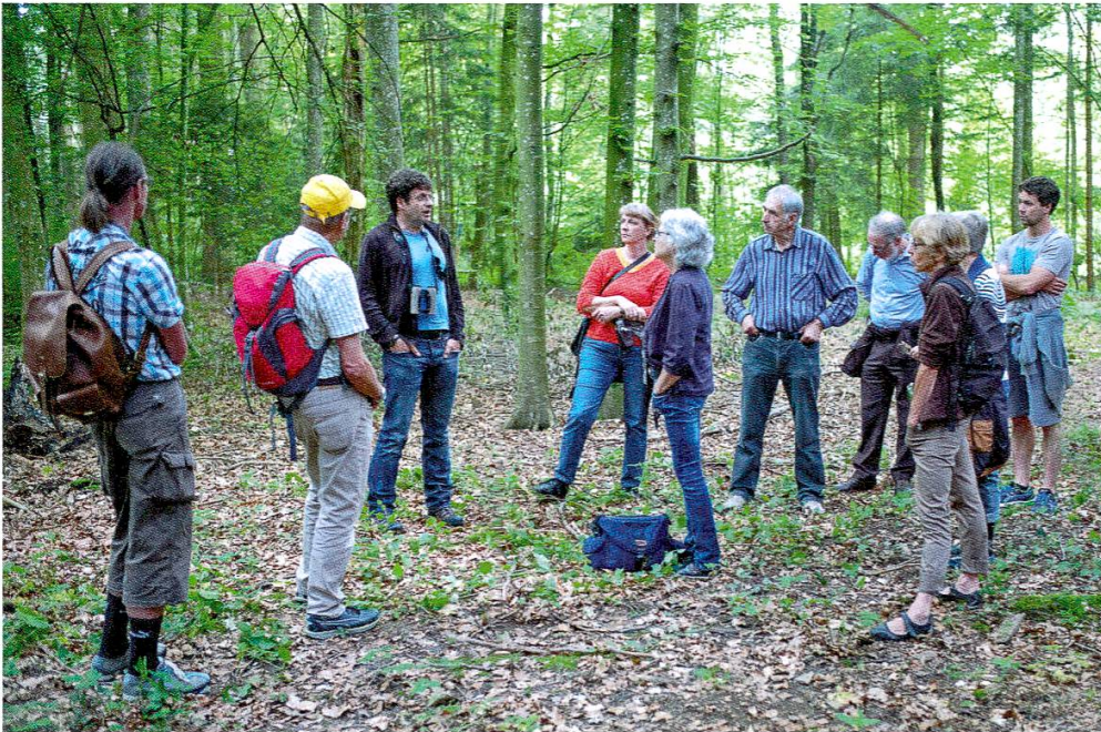
Abbildung 15: Dem Braunen Langohr auf der Spur. Öffentliche Führung durch verschiedene Jagdgebiete dieser Fledermausart.