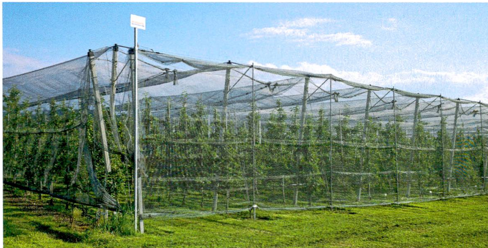
Abbildung 13: Das vollständige Abriegeln von Niederstammanlagen mit Hagelnetzen verwehrt dem Braunen Langohr den Zugang zu einem wichtigen Jagdlebensraum.

Auf dem Seerücken zählen die mit Hagelnetzen ausgestatteten Niederstammanlagen zu den am häufigsten genutzten Jagdlebensräumen des Braunen Langohrs. Dabei werden die Anlagen von oben und der Seite mit Hagelnetzen abgedeckt, die Stirnseiten hingegen die meiste Zeit offen gelassen. Neuerdings werden einzelne Anlagen zur Obstblüte (Schutz vor Feuerbrand-Ansteckung) und vor der Ernte (Schutz vor Vögeln und anderen Fressfeinden) mit Netzen komplett abriegelt, sodass sie für die Fledermäuse nicht mehr nutzbar sind. Damit entsteht ein bisher nicht bekannter Konflikt zwischen Artenschutz und Obstbau, bei dem das Braune Langohr in der Zeit der Jungenaufzucht aus einem der wichtigsten Jagdlebensräume ausgesperrt wird (Abbildung 13).