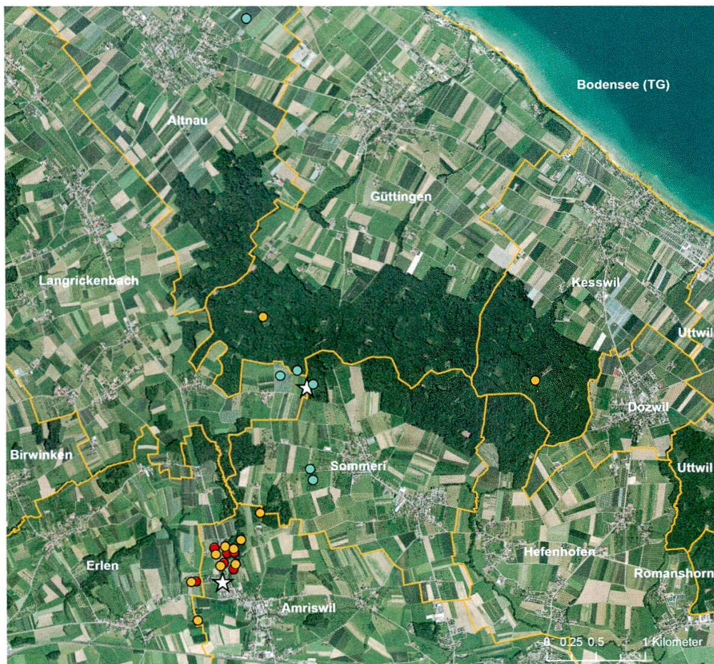
Abbildung 2: Tagesquartiere (Sternsymbole) und Verteilung der nachgewiesenen Jagdgebiete des Braunen Langohrs aus Oberaach in der Gemeinde Amriswil (rot - 2012; orange - 2013) und aus Sommeri (blau - 2012).

Der Aktionsraum umfasste Teile der Gemeinden Amriswil (Oberaach), Erlen, Sommeri, Langrickenbach, Altnau, Güttingen und Kesswil. Von den zehn telemetrierten Braunen Langohren wurden insgesamt 34 Jagdgebiete erfasst. Davon wurden acht von mehr als einem Sendertier genutzt, sodass sich in der Bilanz eine effektive Zahl von 17 erfassten Jagdgebietsflächen ergab. Diese lagen 0,2 bis 4 km vom Tagesquartier entfernt ( Abbildung 2 ). Die Sendertiere jagten meistens bis zu 1 km vom Tagesquartier entfernt (14 Jagdgebiete). Lediglich drei Jagdgebiete waren 2,8 bis 4 km vom Tagesquartier entfernt.