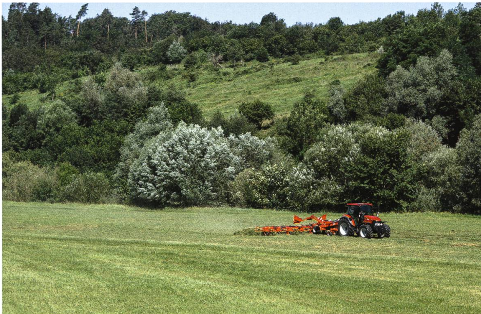
Abbildung 2: Ausbildungswiesen auf der Grossen Allmend müssen zu bestimmten Zeitpunkten der Truppe zur Verfügung stehen. Hierbei kommen entsprechende Maschinen zum Einsatz.