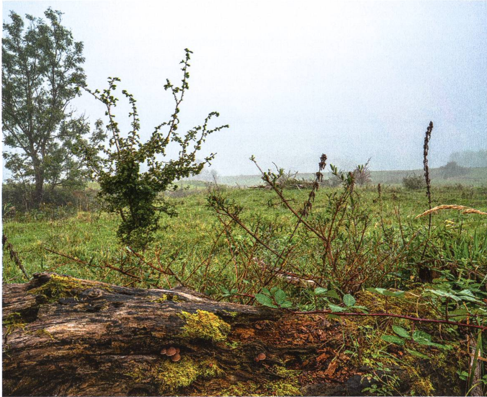
Abbildung 3: Kleinstrukturen sind unverzichtbare Trittsteinbiotope für die Vernetzung von Tierpopulationen und deren weitere Ausbreitung.

Faktoren die Dynamik im Naturschutzgebiet Allmend: