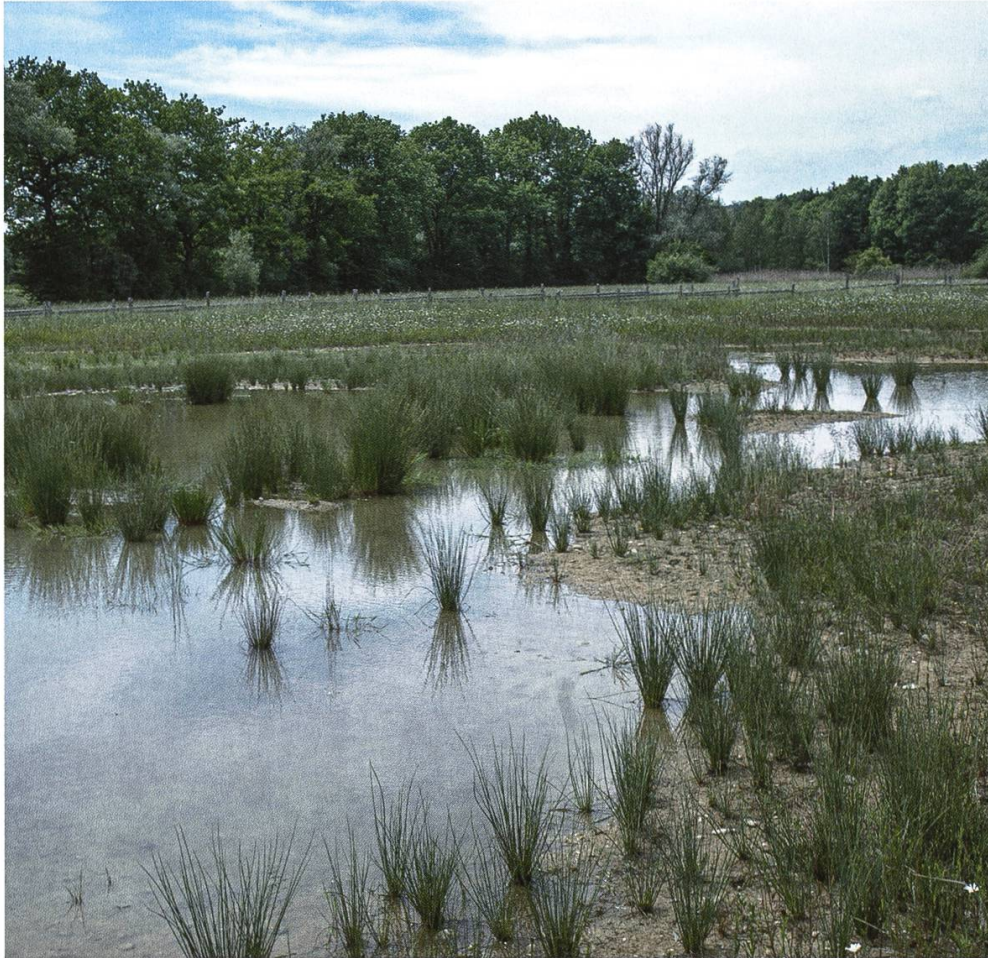
Abbildung 1: Im Naturschutzgebiet Allmend Frauenfeld finden sich vielfältige Nassstandorte und Feuchtbiotope.

LEK sind Erhalt und Schaffung gesamtkantonaler Verbindungsstrukturen ( Abbildung 3 ), die einen Genaustausch zwischen Tier- und Pflanzenpopulationen in wichtigen natürlichen Kerngebieten erlauben und so helfen sollen, die Artenvielfalt im Kanton zu erhalten bzw. zu fördern ( Geisser & Hipp 2018 ). Hier wird vonseiten der Landwirtschaft ein wichtiger Beitrag geleistet, indem die Biodiversitätsförderflächen (BFF) nach Ökoqualitätsverordnung (ÖQV) sinnvoll in den Vernetzungskorridoren platziert und konzentriert werden. Die Wiesen, Weiden und Streueflächen innerhalb des Naturschutzgebietes Allmend werden als BFF bewirtschaftet (s. Felix 2021 in diesem Band ). Mit über 60 ha ist es die grösste zusammenhängende BFF des Kantons. Fast sämtliche BFF im Gebiet erreichen die höchste Qualitätsstufe der ÖQV. Die Wiesen der Allmend tragen damit nicht nur einen wichtigen Teil zum Erfolg des kantonalen Vernetzungsprojekts bei, sondern dürften aus Sicht der Biodiversität zu den wertvollsten, landwirtschaftlich genutzten Gebieten in der Ostschweiz gehören (vgl. Gisel & Götsch 2021 in diesem Band ). Das in den letzten Jahren vom Amt für Raumentwicklung initiierte Projekt zur Steigerung der Qualität von extensiven Wiesen und das gesteigerte Interesse an lokalem Saatgut führt zur einer hohen Nachfrage nach Saatgut. Die Allmendwiesen wurden dank der hohen Qualität und der im