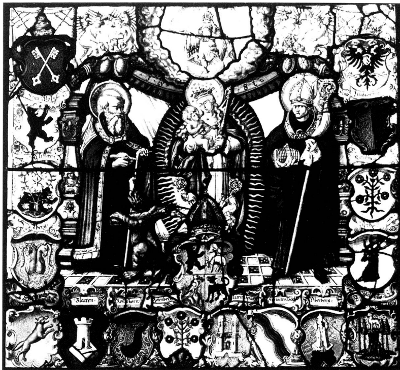
Die Ämter und Vogteien des Stiftes St. Gallen unter Abt Joachim Opser (1577–94). Figurenscheibe von Niklaus Wirt, 1581. Historisches Museum St. Gallen.