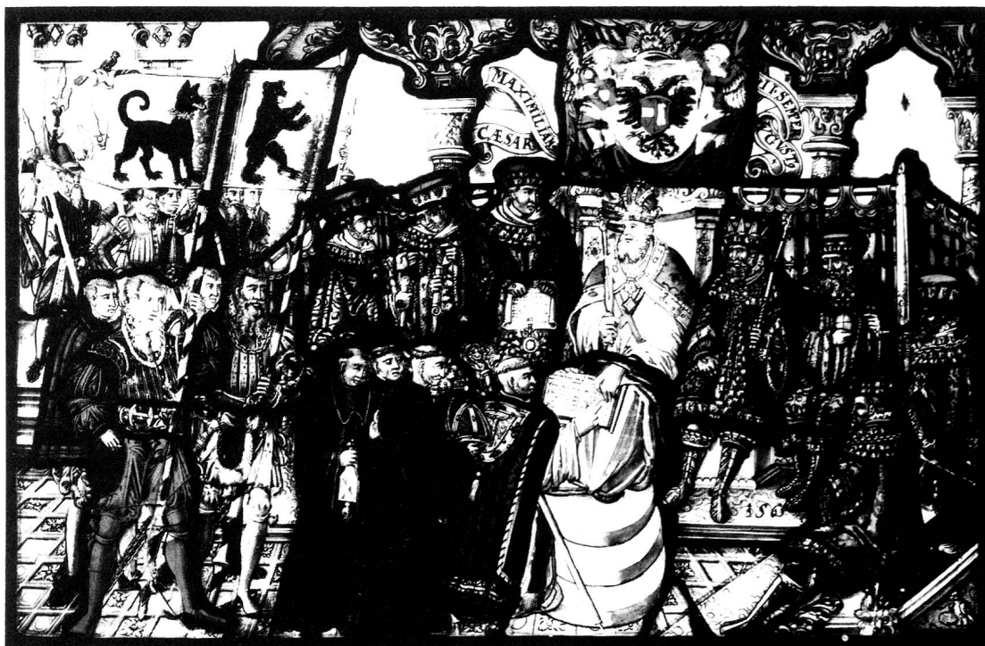
Abt Otmar Kunz empfängt von Kaiser Maximilian II. die Regalien. Hinter ihm Mönche des Klosters St. Gallen und weltliche Vertreter der Abtei und der Grafschaft Toggenburg mit ihren Bannern. Eine der sogenannten Belehnungsscheiben im Historischen Museum St. Gallen, 1565, von Niklaus Wirt aus Wil. Die Darstellung zeigt den starken Bezug der Fürstabtei zum Reich.

aber vor allem bei den Priestern und Predikanten zum Tragen, was im Zusammenhang mit der Predigt noch aufgezeigt werden soll.