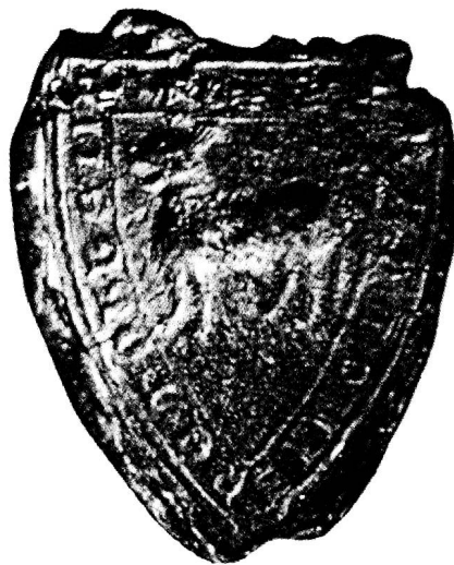
Dreiecksiegel des Grafen Kraft von Toggenburg an einer Urkunde vom 19. Januar 1249 (leicht vergrössert). Stiftsarchiv St.Gallen. Frühes Beispiel der Dogge als Wappenbild.

1249 erscheint dann in Ablösung des alten Wappens ein schwarzer Rüde mit rotem Halsband in Gelb als neues Schildbild. Gleichzeitig wird aber noch von den geistlichen Mitgliedern des Hauses Toggenburg das alte Wappen bis gegen 1300 weitergeführt: In Gelb ein roter aufrechter Löwe in der rechten Hälfte, und links ein blauer halber Adler, beide Tiere monogrammartig zusammengeschoben. Das neue Wappen mit dem Rüden wurde dann dahingehend interpretiert, es handle sich um eine Dogge, die aus dem Burgnamen abgeleitet wurde. Das entsprach natürlich einer (nachträglich) willkommenen Umdeutung des Namens, die eine standesgemässe Ableitung als Jagdhund darstellte. Dem steht nun aber