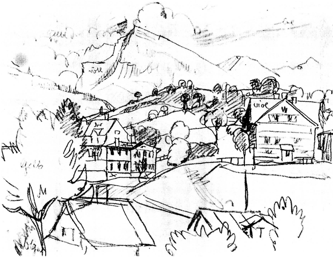
Toggenburger Landschaft mit Stockberg, 1908/09. Bleistift, 21x27 cm. Schweizer Privatbesitz.

Die Lyrik stellt Landschaft mit Andeutungen oder Appellen her. Für Beschreibungen, für Einweihungen hat Lyrik nicht genug Sprachraum oder nicht genug Atem. Länger schon koloriert sie auch nicht mehr.