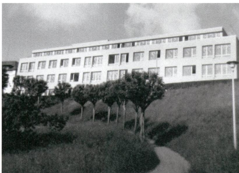
Neubau des Spitals Wattwil, 1972.