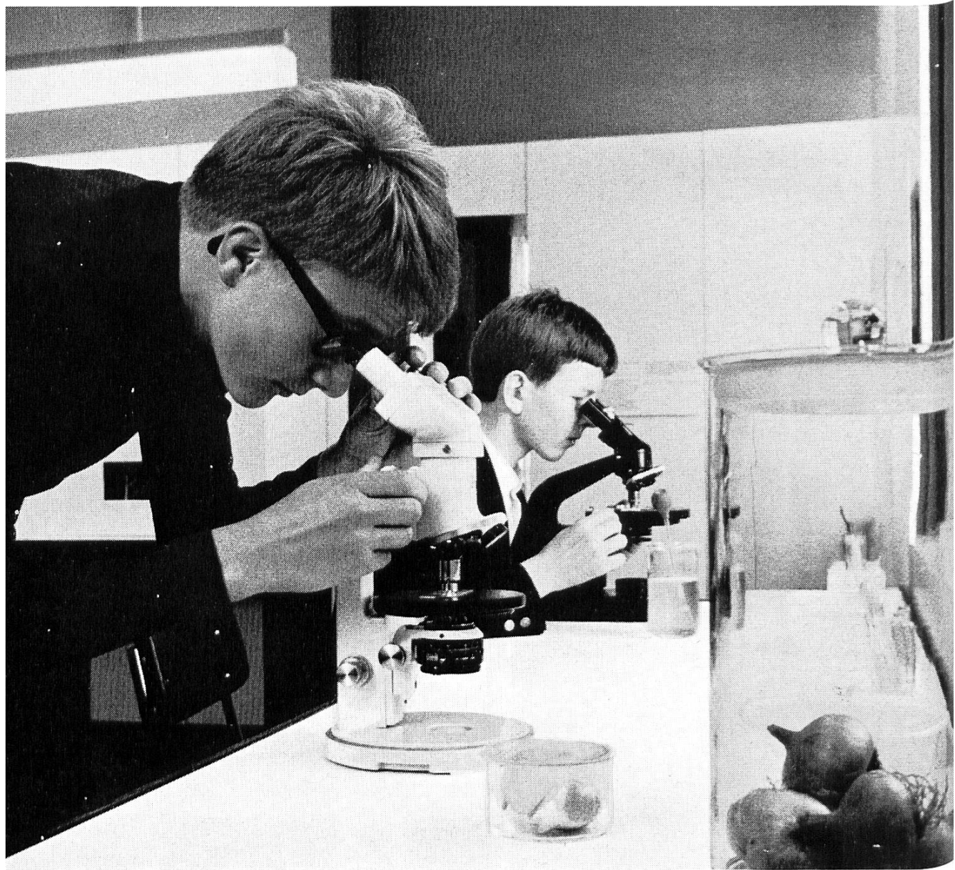
Jugendlabor Zwiebelblätter werden unter dem Mikroskop untersucht