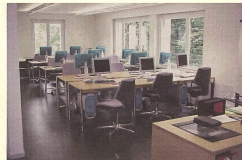
■ Eine Kursgruppe der Intensivweiterbildung an ihrem Planungstag ■