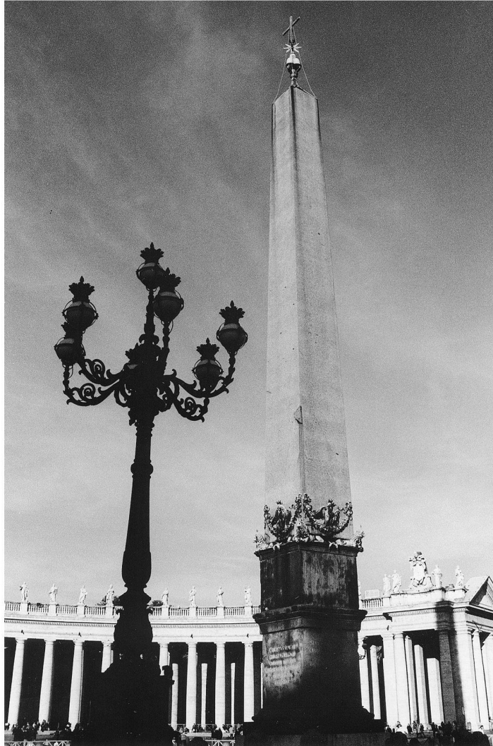
Abb. 2: Vatikanischer Obelisk. Der unbeschriftete vatikanische Obelisk überstand als einziger das Mittelalter in aufrechter Stellung. 1586 liess ihn Sixtus V. beziehungsweise dessen Architekt Domenico Fontana in einer spektakulären Aktion in die Mitte des Petersplatz versetzen. Es handelt sich um den ersten «päpstlichen» Obelisken. Der Erfolg der Verschiebungsaktion veranlasste Sixtus V. zur Wiedererrichtung drei weiterer Obelisken: einen bei der Basilika Santa Maria Maggiore (1587), einen bei der Basilika San Giovanni in Laterano (1588) und einen bei der Kirche Santa Maria del Popolo (1589).