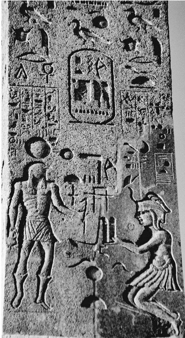
Abb. 4 und 5: Sallustiano-Obelisk. Benannt nach seinem Fundort, den Gärten des Sallust, wurde dieser Obelisk von Papst Pius VI. 1789 bei der Kirche Trinità dei Monti, oberhalb der Spanischen Treppe errichtet. Die Hieroglyphen sind eine römische Imitation des Flaminio-Obeliskens (Piazza del Popolo). Auch die Figuren wirken wenig ägyptisch.