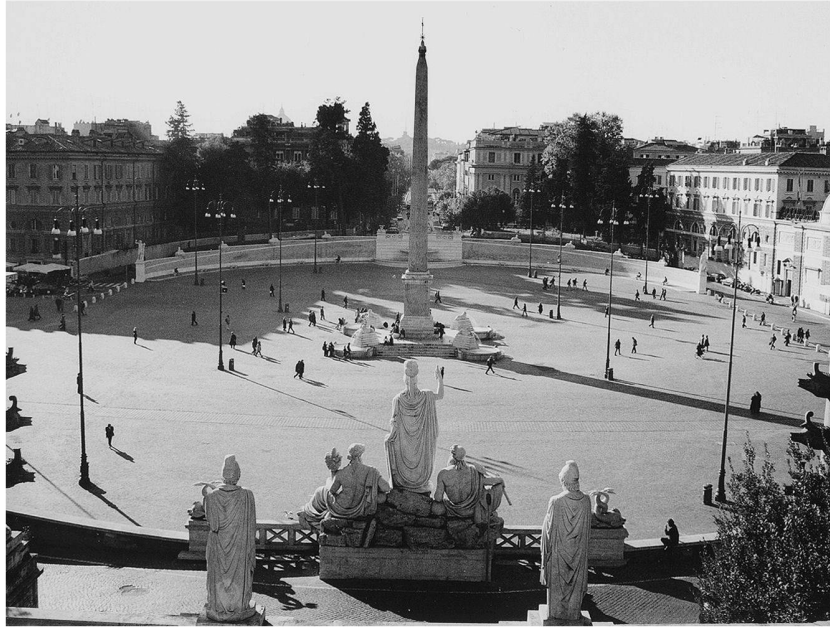
Abb 3: Flaminio-Obelisk. In der Mitte der Piazza del Popolo steht einer der beiden von Augustus im Jahre 10 n. Chr. überbrachten Obelisken. Dieser aus Heliopolis stammende und von Sethos I. und Ramses II. beschriftete Obelisk stand zuerst am östlichen Ende der Spina des Circus Maximus. Im Jahre 1589 liess ihn Papst Sixtus V. an seinen heutigen Standort versetzen. Nach dem vatikanischen und dem Lateran-Obelisken ist er der dritthöchste Obelisk Roms.