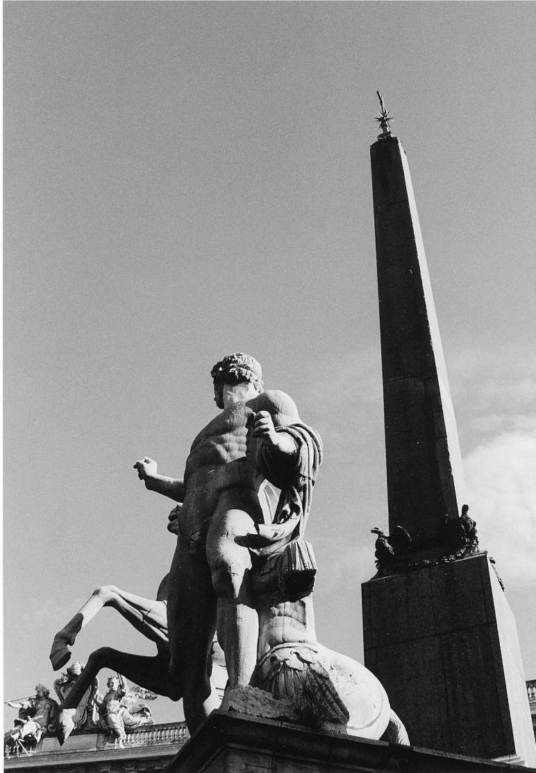
Abb. 6: Der Quirinal-Obelisk stammt vom Augustus-Mausoleum. Die Statuen der Dioskuren (Castor und Pollux) sind römische Kopien griechischer Originale, die Papst Sixtus V. 1589 restaurieren liess. 1786 verschob der Architekt Giovanni Antinori die Statuen im Auftrag von Pius VI. leicht, so dass ein Obelisk zwischen sie plaziert werden konnte. Die 1818 um den Monte-Cavallo-Brunnen ergänzte Gruppe befindet sich auf der Piazza del Quirinale, unmittelbar neben dem Palast gleichen Namens, der bis 1870 Sitz der Päpste war.