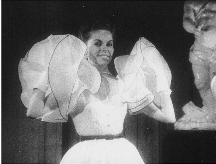
Abb. 5: Duftiges für alle: das «Traumwölkchen» wird zum erschwinglichen Brautjungfernkleid dank Kupfertüll.

bezahlen» (NDW 142), so waren Frauen bei der Kunstfaserwerbung als modische und sparsame Konsumentinnen angesprochen. In dieser Verbindung mit der traditionellen nationalen Frauentugend der Sparsamkeit war Mode jetzt offenbar auch aus männlicher Sicht akzeptabel, und so lud der Kommentator des Kunstfasermode-Berichts von 1953 das weibliche Publikum zum heiteren Modespiel ein: «Das ewige Spiel – und wir können nur sagen: Auf ein Neues.» Und schliesslich markierte die neue Akzeptanz der Männer für die Mode eine endgültige Ablösung von einem nationalen Trauma der Besatzungszeit: Damals waren unter dem Stichwort «Liebe gegen Nylons» Beziehungen deutscher Frauen zu westlichen Besatzungssoldaten als unpatriotischer weiblicher Konsumegoismus gedeutet worden. Jetzt aber inszenierte die Wochenschau ein imaginäres Geschlechteruniversum, in dem der Genius deutscher Erfinder und Ingenieure zusammen mit dem Fleiss der Industriearbeiter die Idee westdeutscher Autarkie zur Realisierung brachten, nicht nur in der Konsumversorgung, sondern auch in den Beziehungen der Geschlechter. Deutsches 140 ■ Perlon, so die Botschaft, ermöglichte die Verbindung von französischem Chic