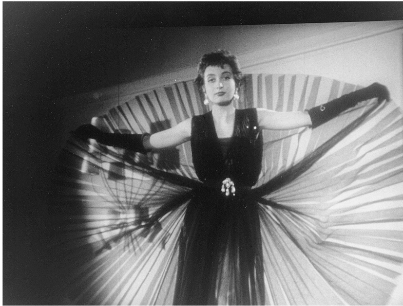
Abb. 1: Melodramatisches für die Dame mit gehobenem Anspruch und finanzkräftiger männlicher Begleitung: Das Modell «Nachtfalter» des deutschen Couturiers Heinz Schulze-Varell oder ...

Tagesmode an den Look der 20er Jahre an, etwa mit dem strengen Garbo-Look des wadenlangen Tageskostüms aus Tweed mit Männerhut (NDW 113, 1952). Die Abendkleider beziehen ihren Reiz aus dem Widerstreit zwischen der Fülle des Stoffs und seiner fast geometrischen Bändigung. Sie wirken kostbar und teuer, vor allem auch durch die im Kommentar hervorgehobenen edlen Naturstoffe wie Baumwollspitze, Organdi, Crêpe de Chine. Hier wird in einem dem Melodrama angelehnten filmischen Gestus die soziale Aufgabe der Dame, Geschmack und Kultiviertheit ihres Milieus zur Schau zu tragen, als eine ernste, ja tragische, bedrohte Weiblichkeit inszeniert (Abb. 1 und 2). Dieser Eindruck entsteht durch das sparsame Dekor antikisierender Spiegel, Säulen, Vorhänge und exzentrischer Lampen, in dem sich die Mannequins in einer kunstvoll choreographierten, fast traumwandlerischen Körpersprache graziöser Anpassung des Körpers an diese Beengtheit der Innenräume bewegen. Das Strenge und Bedrückt-Melancholische entsteht auch durch den durchweg ernsten Gesichtsausdruck der «Starmannequins Jerry, Linda und Ill». Ihr Blick kontrolliert 136 ■ den Blick der Kamera, er konkurriert gewissermassen mit dem Kleid um die