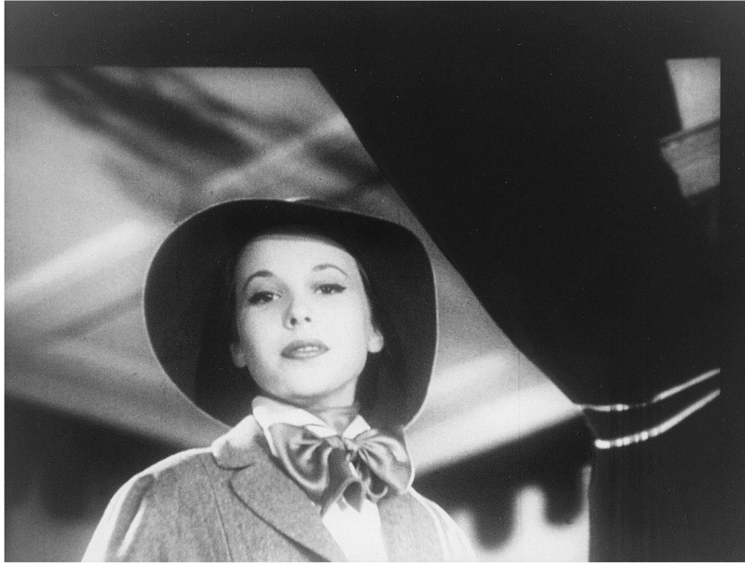
Abb. 2: ... strenger Garbo-Look mit Tweedkostüm im Stil der 20er Jahre, ebenfalls von Schulze-Varell.

Aufmerksamkeit des Betrachters. Dieses Arrangement der Blicke und Bewegungen ist kombiniert mit einer deutlichen Markierung finanzieller Exklusivität und einer festen Rollenverteilung zwischen der hedonistischen Demonstrationspflicht der Dame und dem zahlenden Herrn. So heisst es einmal abschliessend: «Nun meine Dame, haben Sie gewählt? Dann vergessen sie nicht, den Herrn zu Ihrer Linken von Ihrer Wahl zu verständigen.»