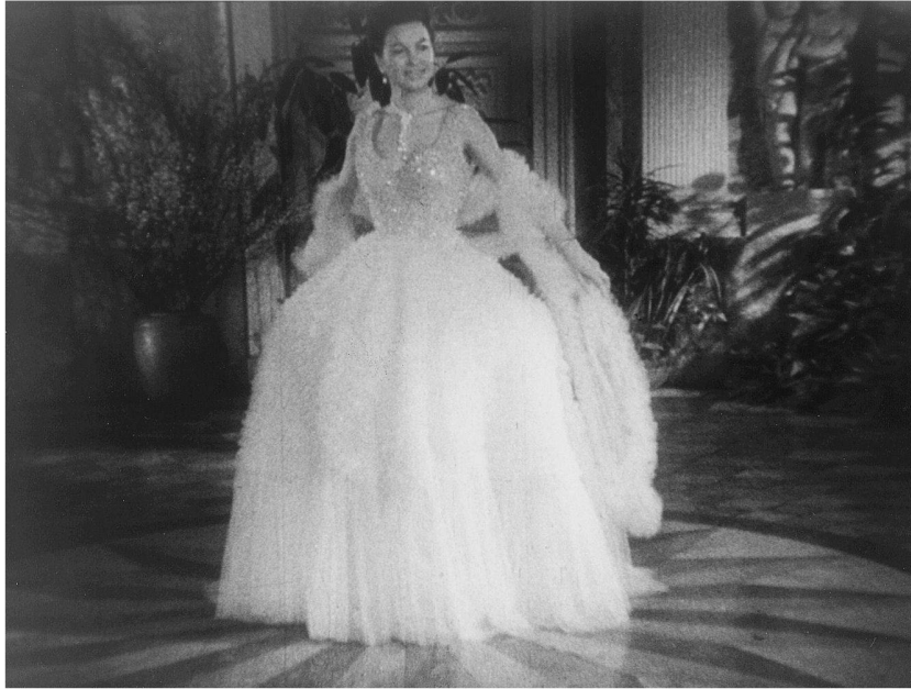
Abb. 4: ... gefällig und luxuriös im Brautkleid nach Machart von Dior, ebenfalls von Oestergaard.

Stoffe auszuhebeln. Also hiess es jetzt im Kommentar: «Diese zauberhaften Stoffe sind keine Wunschträume mehr. Jede Frau kann sie erschwingen.» (NDW 155). Die Kunstfasern der IG-Farben-Nachfolger ermöglichten es, so die Botschaft an das Kinopublikum, dass Mode vom hedonistischen Vorrecht der bürgerlichen Dame zu einer für alle Frauen zugänglichen Praxis werden könne. Um die national konnotierten Kunstfasern inszenierten die Bundeswochen-schauen eine umfassende Versöhnung sozialer Gegensätze. Dabei entwarfen sie verschiedene symbolische Visualisierungen für die harmonistische Sozial-ideologie der «nivellierten Mittelstandsgesellschaft». Mode aus teuren Natur-faserstoffen, die soziale Distinktion versprach, wurde nun kritisch-ironisch kommentiert, während Mode aus Kunstfasern zur diskursiven Trägerin sozialer Harmonie avancierte. Gleichzeitig wurde diese neue Mode jetzt als Schau-platz einer Versöhnung der Geschlechter inszeniert. Spielte die Darstellung der Schulze-Varellschen Luxusmode im Kommentar auf den zahlenden Herrn an, etwa mit der Bemerkung, das Abendkleid «Raspa» möge wohl «sehr angenehm in der Bar zu tragen» sein, es sei aber «sehr unangenehm in Bar zu ■ 139