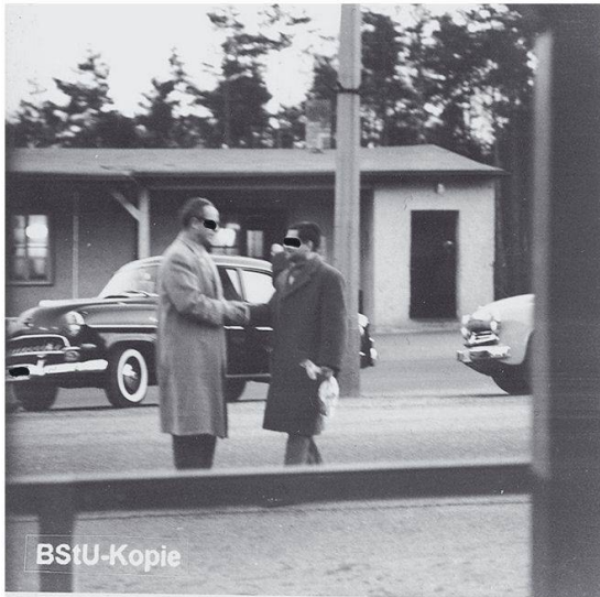
MfS-HA XX/Fo/497-Bild 3