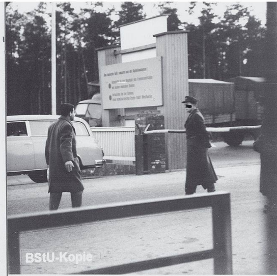
MfS-HA XX/Fo/497-Bild 4