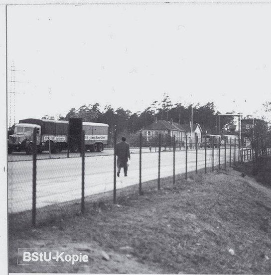
MfS-HA XX/Fo/497-Bild 8