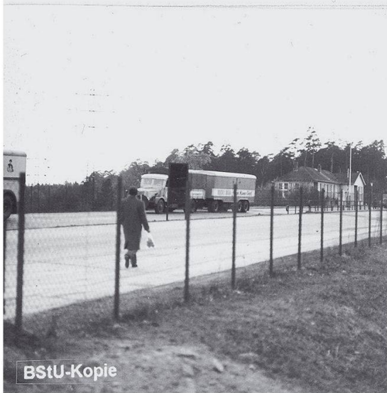
MfS-HA XX/Fo/497-Bild 7