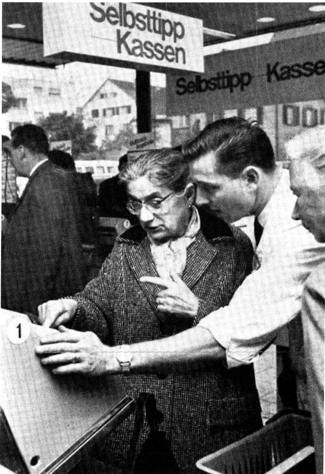
«Alles ganz einfach», sagt der junge Verkäufer zu der Kundin und zeigt ihr, wie man seine gekauften Waren selbst eintippt.» («Neues Kassier-System im Migros-Markt Wollishofen», Selbstbedienung und Supermarkt 12 [1965], 5)