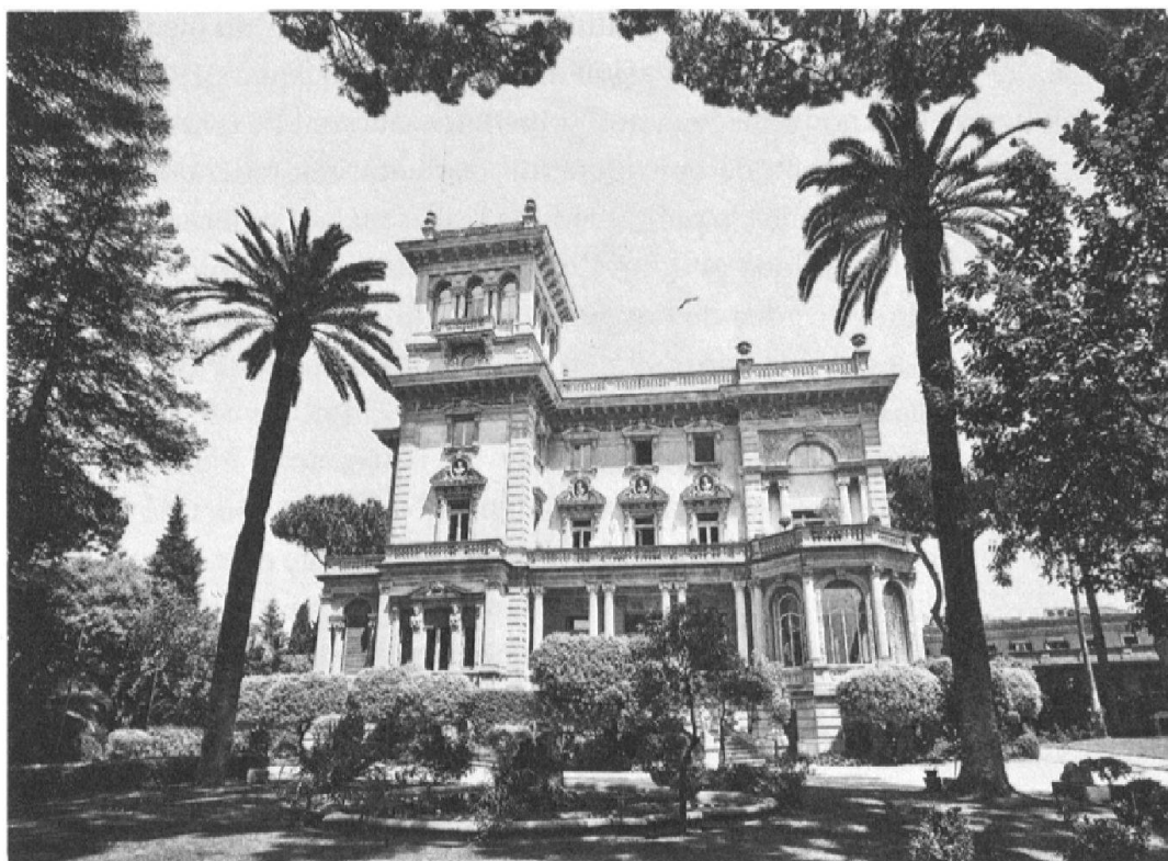
Fig. 1: La Villa Maraini, siège de l'Institut suisse de Rome.

jouera plus tard un rôle fondamental dans le paysage scientifique et culturel suisse. 2 Cet engagement au service des puissances étrangères contribue à consolider, dans l'esprit de beaucoup, la conscience de l'indépendance culturelle de la Suisse et de la nécessité de voir celle-ci représentée par une institution qui lui soit propre.