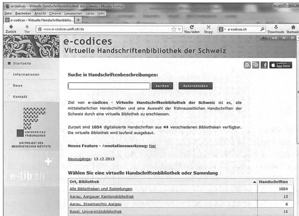
Abb. 1: Startseite von «e-codices». (Screenshot, 2. Januar 2014)

Entwicklungsschritten bei, kann jedoch zwangsläufig nicht immer im Modus des allseitigen Wohlfühlens ablaufen.