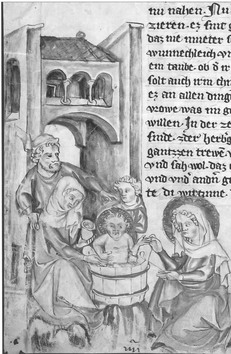
Abb. 2: Detail von Schaffhausen, Stadtbibliothek, Cod. Gen. 8, Evangelienwerk des Österreichischen Bibeliübersetzers, fol. 21 v, linke untere Ecke mit Randillustration, Kustode IIII, Beschädigungen des Pergaments im Eckbereich, Nimbus des Christuskindes mit Goldgrund und Punktpunzen; dargestellt ist eine Badeszene auf der Flucht der Heiligen Familie nach Ägypten; Österreich (vielleicht Oberösterreich), um 1330/40. ( http://www.e-codices.unifr.ch/de/sbs/0008/21v/x-large )