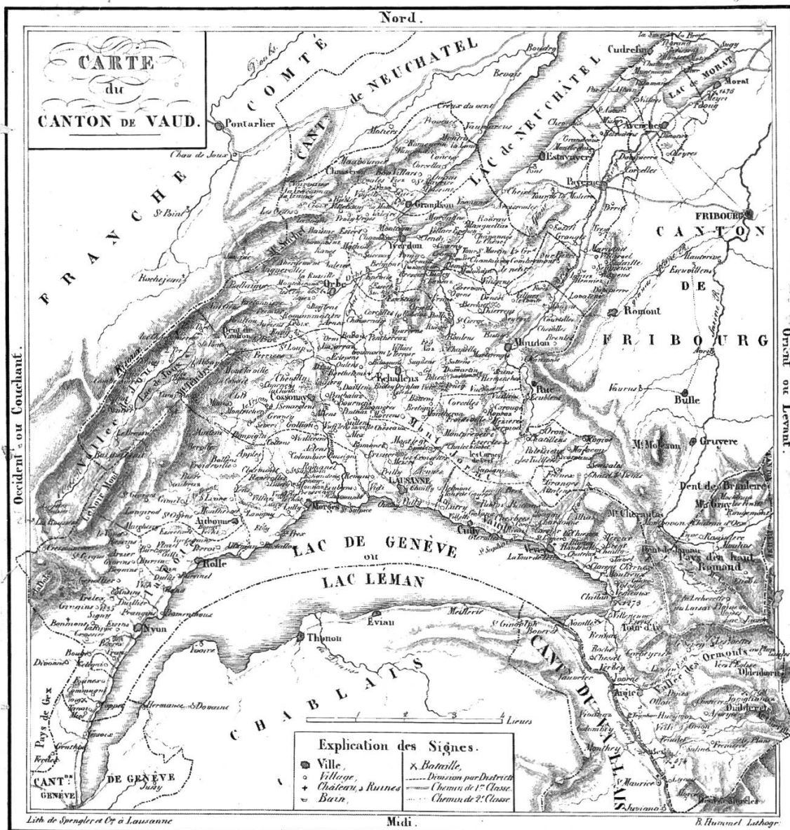
Fig. 2: Carte du Canton de Vaud par B. Hummel, Bon Messager , Lausanne 1831. (Bibliothèque cantonale et universitaire, Lausanne)

leur permettre de les visualiser. Les cartes s’attachent à présenter des images reconnaissables des cantons. Dès 1831, le Grand Conseil commande ainsi pour les écoles 140 exemplaires de la carte précise du canton que le cartographe Walker est en train de réaliser. 30 L’année suivante, les cartes sont distribuées aux écoles où, semble-t-il, elles ne sont pas bien reçues et tomberont bientôt dans l’oubli. 31 Un destin similaire attend le manuel de Walker de 1833 qui contient une carte dépliant du canton de Soleure (cf. fig. 3, p. 27). Ces échecs peuvent s’expliquer par le caractère très peu pédagogique des cartes de Walker: au milieu de la masse d’informations et de détails qui frappe l’œil, l’image de la patrie – et