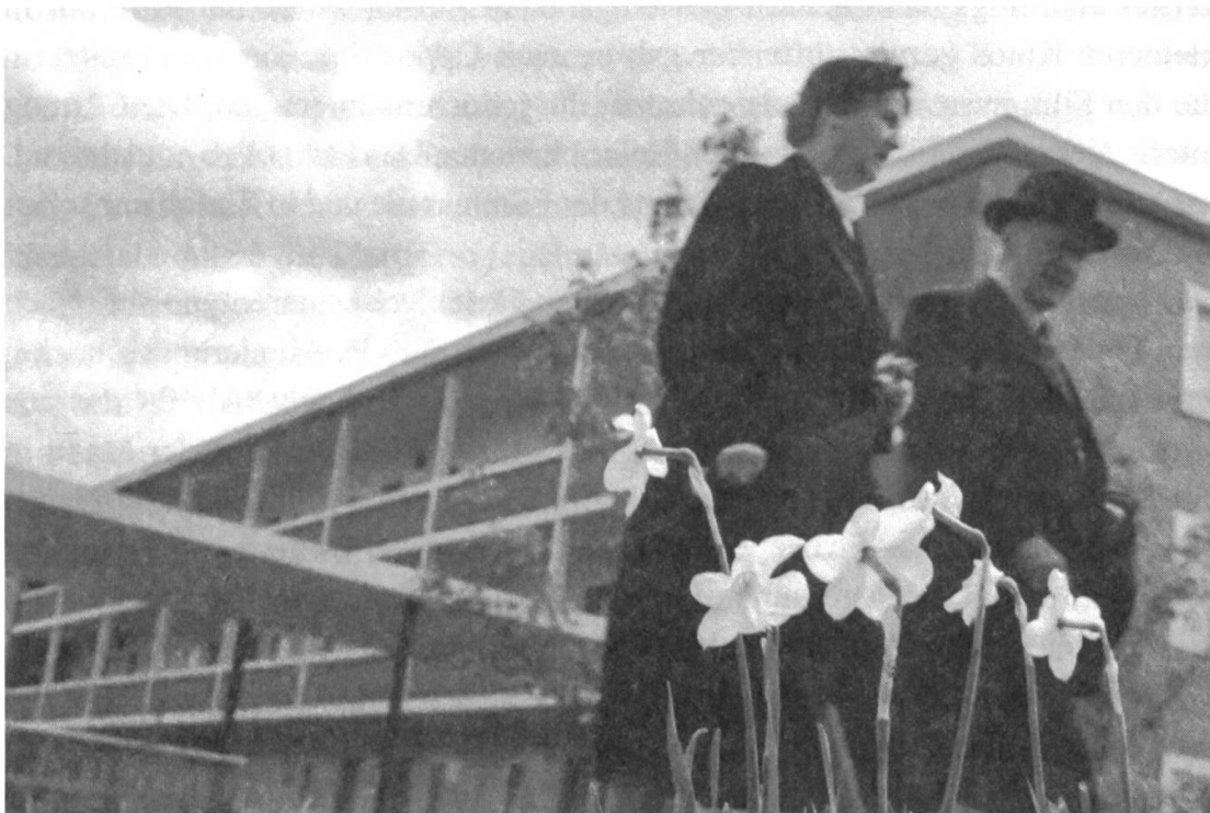
Abb. 14 und 15: Filmstills aus «Eines Tages». Dank dieser Unterstützung gelingt es dem Paar, wieder auf die Beine zu kommen. Sie bewerben sich um eine Wohnung in einer neu gebauten Alterssiedlung und gewinnen die Freude am Leben zurück. Der Film endet mit dem programmatischen Leitsatz: «Eines Tages sind auch wir alt. Aber das Leben geht weiter. In der Gemeinschaft, durch die Gemeinschaft müssen die Probleme des Alters gelöst werden.»