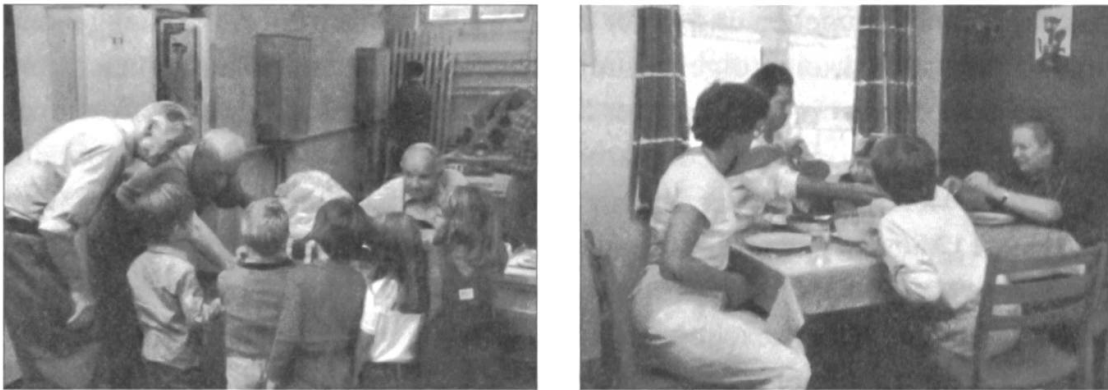
Abb. 16: «... ausser man tut es», 1983 – Seniorenwerkstätte und Kindergarten unter einem Dach. Die Förderung der intergenerationellen Beziehungen über die innerfamiliären Bande hinaus geraten ab den späten 1970er-Jahren in den Fokus der Pro Senectute. Der Austausch von Geschenken zwischen einer Werkgruppe für Senioren und dem benachbarten Kindergarten wirkte 1983 noch etwas unbeholfen.