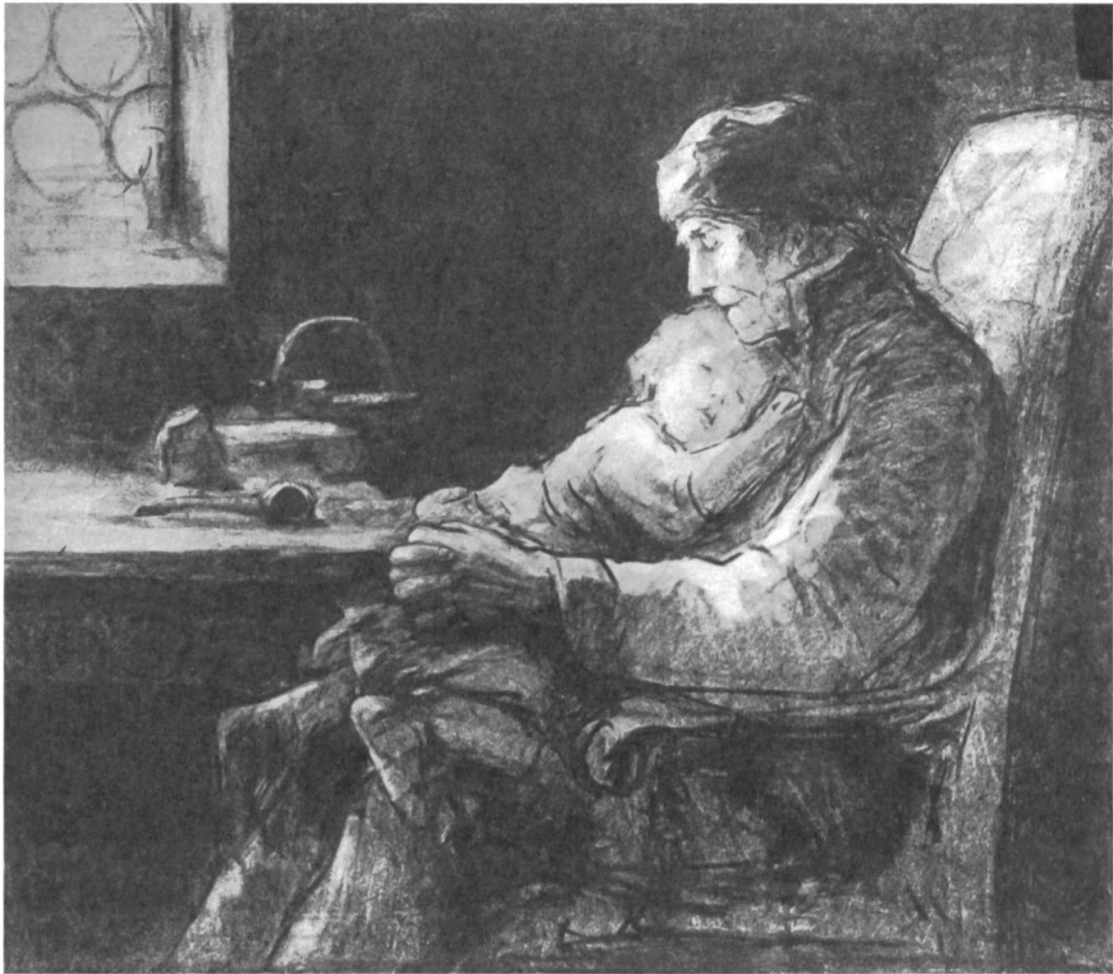
Abb. 5: Die Rolle von alten Menschen liegt in der Betreuung der jüngsten Generation, mit bemerkenswerten Geschlechter unterschieden. Während die Grossmütter ihren Enkeln in vielfältiger Weise bei den Hausaufgaben oder bei Näharbeiten helfen, dienen Grossväter als Schlafaufsicht oder -unterlage. (Schweizerisches Sozialarchiv, F 5112-Gb-071)