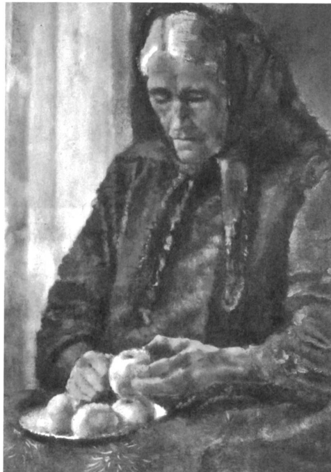
Abb. 7: Eine alte Frau schält Äpfel. (Schweizerisches Sozial- archiv, F 5112-Gb-078)