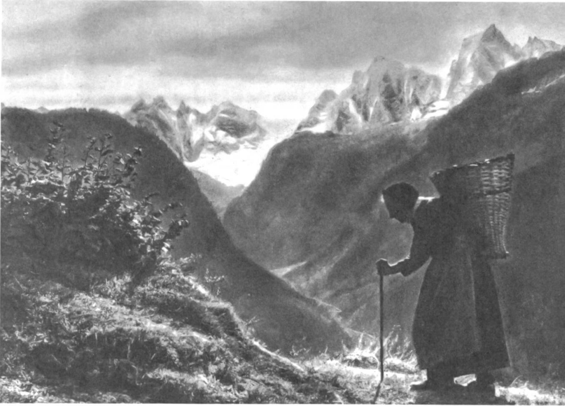
Abb. 6: Eine alte Frau mit Tragkorb und Gehstock.