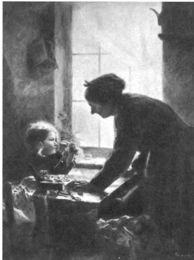
Abb. 4: Eine alte Frau hilft einem kleinen Mädchen bei NÄharbeiten.

Notwendigkeit der Einrichtungen unbestritten war. Wer einen Platz im Alterssylv beanspruchte, musste sich damit abfinden, keine (oder keine aufnahmewillige) Familie zu haben und nicht über die finanziellen und/oder physischen Voraussetzungen zu verfügen, um allein zu leben. Die Aufnahmen zeigen die Alten überwiegend in der schon bei den Plakaten konstatierten defizitorientierten Ausrichtung. Äussere Anzeichen von Armut wie eine gewisse Nachlässigkeit in der Kleidung oder im Haarschnitt werden offensiv gezeigt. Ammann wollte mit den ungeschönten Bildern auf die oft missliche Lage von alten Menschen in der Schweiz aufmerksam machen und aufrütteln (Abb. 1–3).