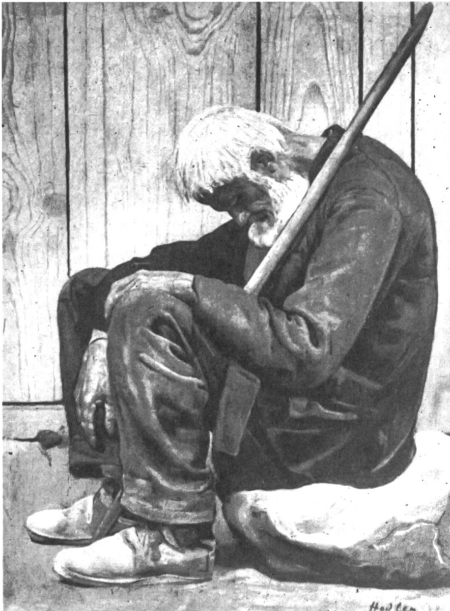
Abb. 8: «Der Lebensmüde» (Ferdinand Hodler).