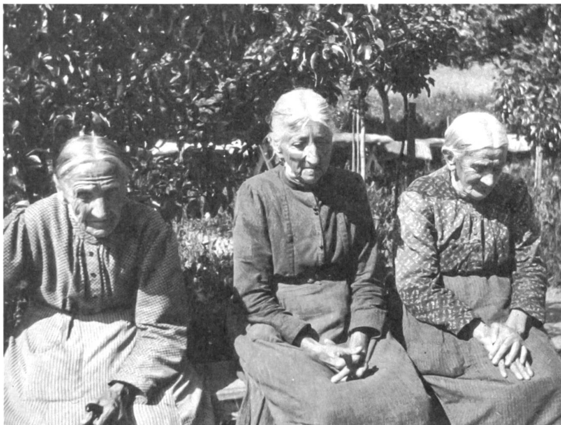
Abb. 2: «Greisinnen Armenhaus» (Beschriftung der Originalverpackung). Auffallend oft wurden alte Menschen in gebeugter Körperhaltung und mit leerem Blick fotografiert. Die Aufnahme wurde mit der Bildlegende «Drei Lebensmüde» auch in der Zeitschrift «Pro Senectute» (Heft 2, Juni 1924) veröffentlicht. (Schweizerisches Sozialarchiv, F 5112-Gb-026)

gebückter Körperhaltung, der auf einen Stock gestützt an die restliche Bevölkerung appelliert: «Helfet dem Alter!» 4 Erstaunlich lange, nämlich bis in die 1960er-Jahre, veränderten sich die Motive und die Bildsprache dieser Plakate kaum. Das Reisigbündel unter dem Arm der alten Frau, die knochige Hand am Gehstock und der müde Blick reichten aus, um die Botschaft von materieller Notlage und Deprivation zu vermitteln.