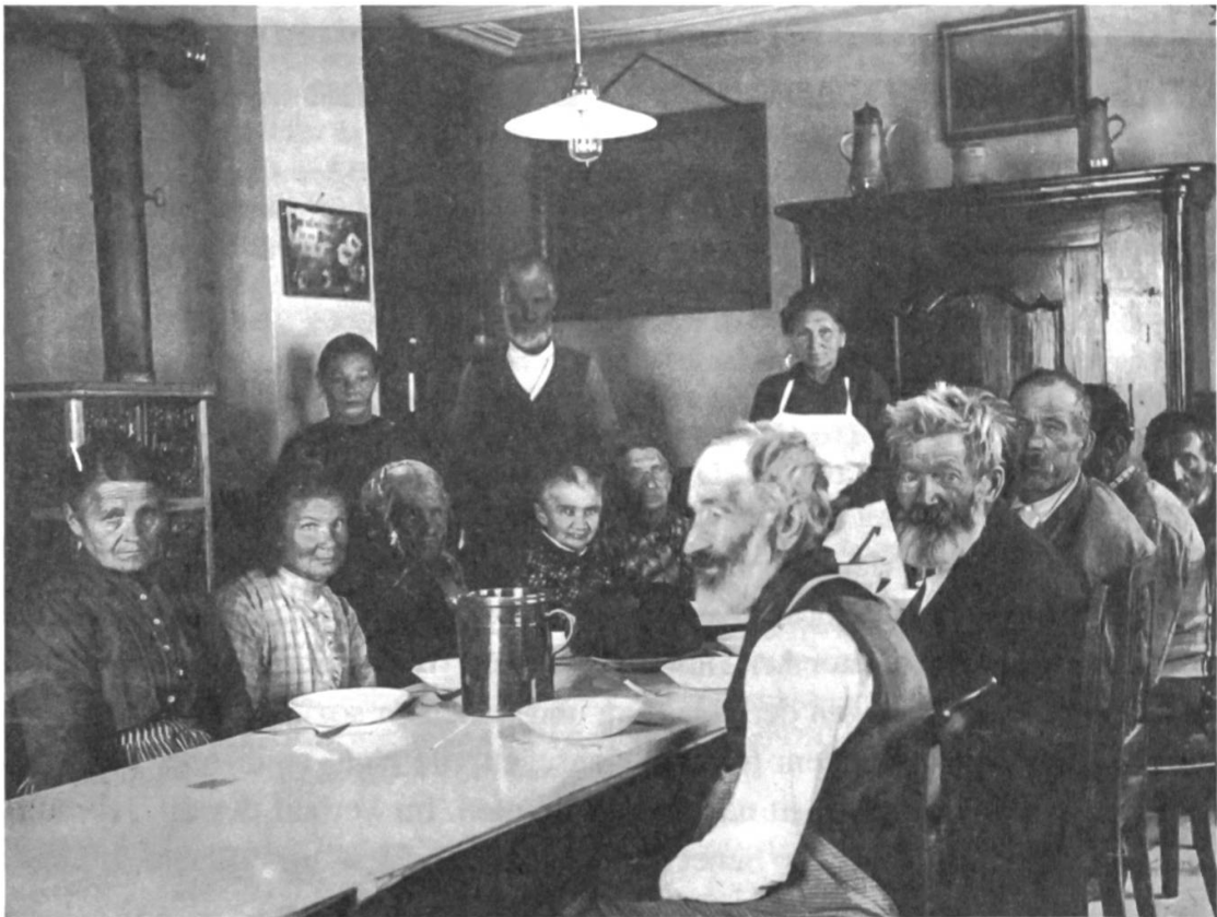
Abb. 1: «Insassen des Altersheims Zweisimmen» (Beschriftung der Originalverpackung). Rund 20 Aufnahmen in Ammanns Sammlung zeigen einerseits Aussenansichten von Altersheimen und Armenhäusern. Erstaunlich oft sind andererseits BewohnerInnen zu sehen, die in Alltagssituationen im Esssaal – wie hier in Zweisimmen – oder vor dem Haus posierend fotografiert wurden. (Schweizerisches Sozialarchiv, F 5112-Gb-0469)

sukzessive digitalisiert worden und steht auf der Datenbank Bild + Ton des Sozialarchivs online zur Verfügung. 3 Diese Fotos, Filme und Videos bilden die Ausgangsbasis des folgenden Streifzugs, welcher der Reichhaltigkeit des audiovisuellen Materials selbstverständlich nur ansatzweise gerecht werden kann.