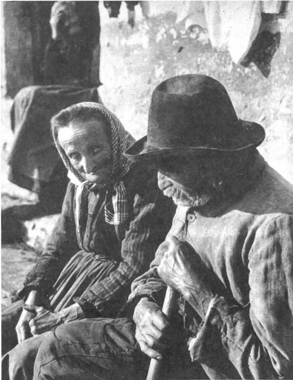
Abb. 9: «Tessiner Ehepaar».