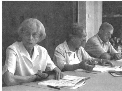
Abb. 18: «Mitenand», 2003 – Klassenhilfe. SeniorInnen unterstützen Lehrpersonen in der Volksschule.