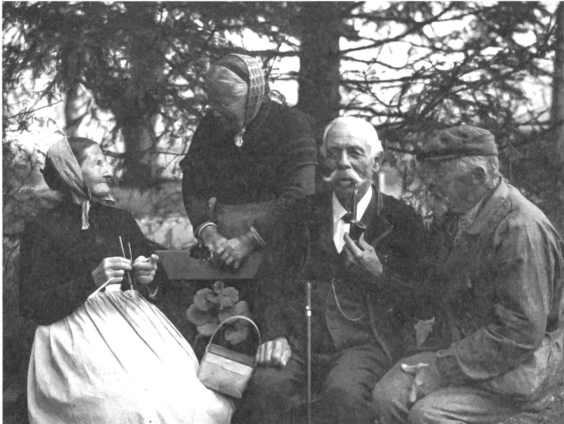
Abb. 3: «Greisenasyl Bern» (Beschriftung der Originalverpackung). Nur zwei Bilder dieser Motivgruppe zeigen gut gelaunte alte Menschen beim gemütlichen Beisammensein. (Schweizerisches Sozialarchiv, F 5112-Gb-035)

auch Reproduktionen von Gemälden und Skizzen bekannter (vorab Schweizer) KünstlerInnen.