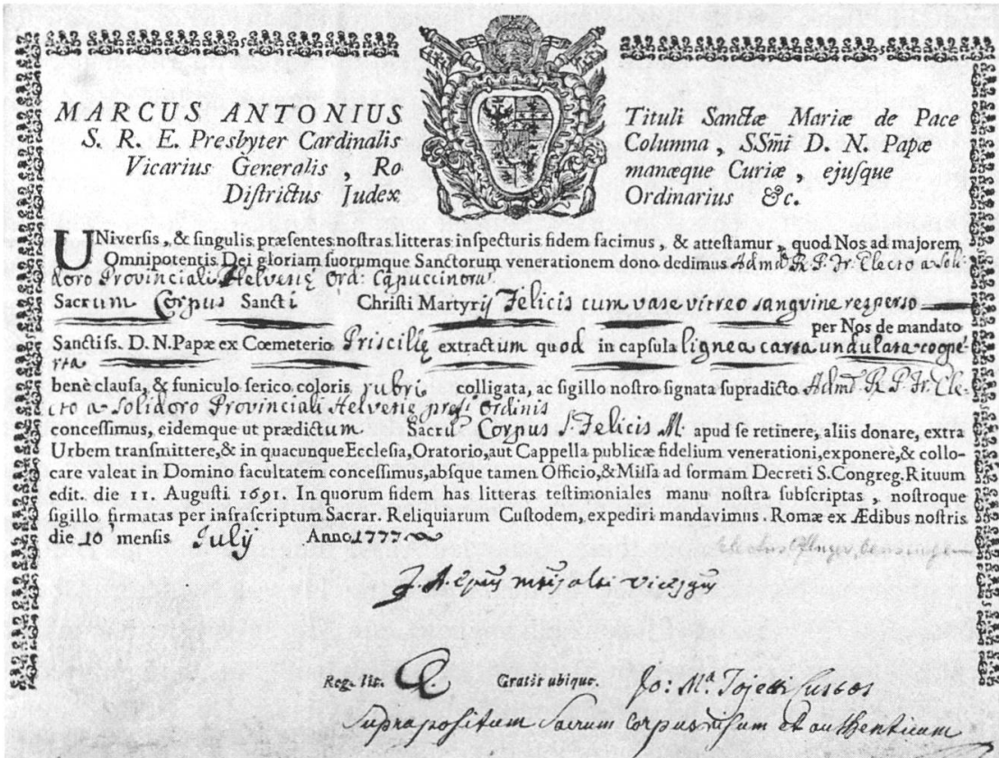
Abb. 3: Authentik für den Katakombenheiligen Felix, ausgestellt 1777 durch den römischen Kardinalvikar Marcantonio Colonna. (Pfarrarchiv Erlinsbach, Nr. 36)

römische Kardinalvikariat oder in die päpstliche Sakristei. Dort wurde es durch den Kardinalvikar beziehungsweise den Präfekten der Apostolischen Sakristei in einer besonderen Zeremonie verifiziert und authentisiert. Gleichzeitig mit dieser offiziellen Feststellung seiner Echtheit gab man dem heiligen Leib einen Namen. Daraufhin wurden die Knochen verpackt, verschnürt und versiegelt. Der Akt des Authentisierens wurde zusammen mit dem Namen der oder des Heiligen und des Empfängers mit der Authentik bestätigt. 10 Diese Urkunde begleitete die kostbare Fracht von Rom in die katholische Eidgenossenschaft. Am Bestimmungsort prüfte der örtliche Bischof oder ein apostolischer Notar die Unversehrtheit der Verpackung und brach anschliessend die Siegel unter Aufsicht von Zeugen. 11 Auch dieser offizielle Akt wurde auf der Authentik vermerkt.