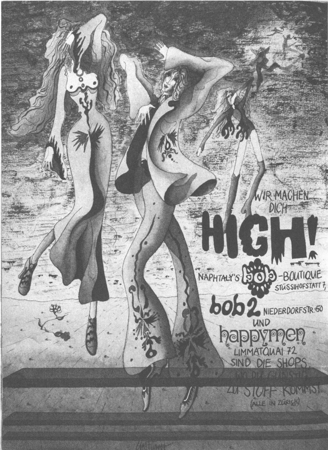
Abb. 1: Wir machen dich high – psychedelische Werbung für Naphtaly's Bob Boutique, POP, Mai 1970, Jg. 5, Heft 5, 1970, S. 14, Schweizerische Nationalbibliothek.