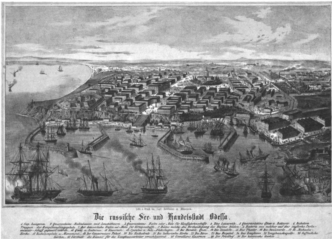
Abb. 2: Die russische See- und Handelsstadt Odessa, der Quarantänebereich im linken Bereich des Bildes 1855.

des Reichs zum «empire of germs» wurde. 21 Das Osmanische Reich stand den russischen Quarantänebehörden stets als mögliche Quelle von Infektionen vor Augen, ebenso wie dies auf der südlichen Seite des Schwarzen Meeres für das Russländische Imperium galt.