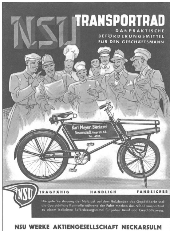
Abb. 5: Werbung für Lastenräder adressierte stets gewerbliche Nutzer. Broschüre der Neckarsulmer Motorenwerke, vermutlich 1950er-Jahre. (Privatbesitz)