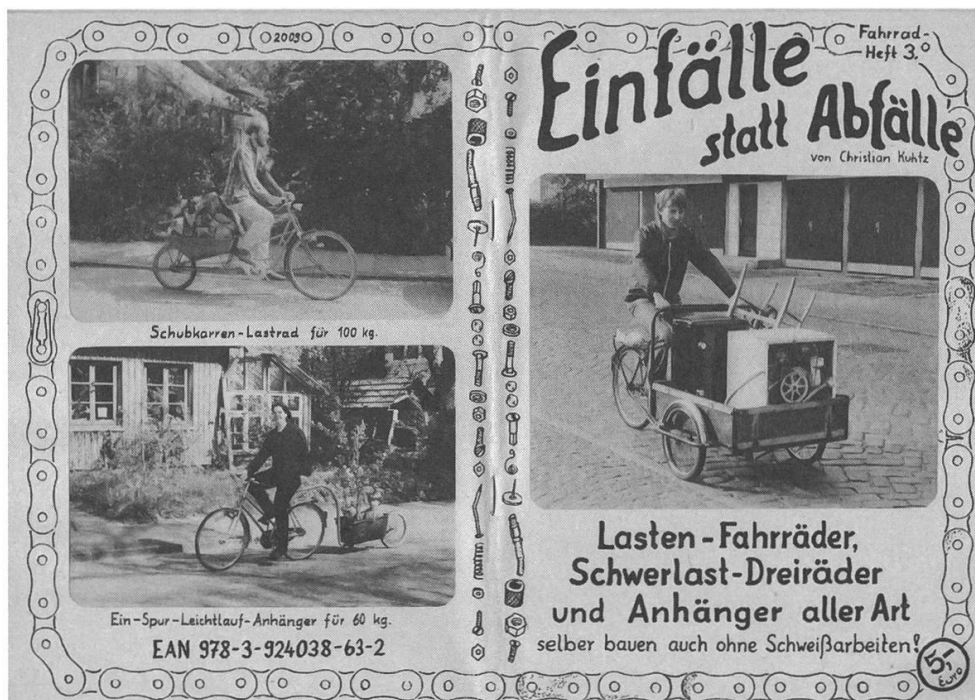
Abb. 12: Broschüre zum Selbstbau diverser Formen von Lastenrädern. (Christian Kührtz, 1982 Neuauflage 2009)