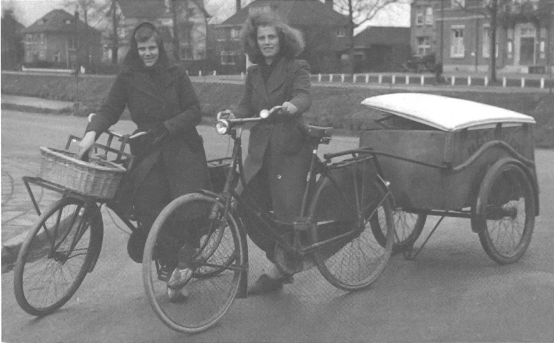
Abb. 4: Historisches Bildmaterial zeigt Fahrerinnen von Lastenrädern oder Fahrradanhängern zuweilen bei der Kundenbelieferung in Familienbetrieben, hier die Töchter eines Bäckers in Haarlemmermeer, Niederlande, um 1950.

Cox und Rzewnicki postulieren mit Blick auf die gewerbliche Nutzung von Lastenrädern zurecht: «An extremely broad range of factors has shaped the changing fortunes of the working bicycle, most of which are extrinsic to the machine.» 15 Eine Analyse aus der Perspektive der Nutzerinnen und Nutzer, also eine Geschichte des Lastentransportes per Fahrrad, wird daher weit umfassendere Erkenntnisse erbringen als eine Geschichte konstruktiver Varianten von Lastenrädern. Eine solche Geschichte des Lastentransportes per Fahrrad wäre auch gewinnbringend in die «langen Linien» der von Hans-Ulrich Schiedt konzipierten Geschichte des Langsamverkehrs einzubetten. Alltägliche Praktiken der kleinteiligen Beförderung von Lasten, deren Analyse Schiedt im Vergleich zum Transport von Massengütern per Schiff, Eisenbahn oder LKW einfordert, haben bislang eher in der Ethnologie und Volkskunde als in der Mobilitätsgeschichte Aufmerksamkeit erhalten. 16 Für die Analyse der Geschichte von Lastenrädern entspricht ein solcher nutzungs- und akteursbezogener Ansatz methodischen Entwicklungen, wie sie sich in der kulturhistorischen Erweiterung der Technikgeschichte durchgesetzt haben und auch die neuere Fahrradgeschichte prägen. Über technische Innovationsprozesse hinaus wird in diesem Rahmen der gesamte Zyklus von der Entwicklung bis zur Entsorgung technischer Objekte und