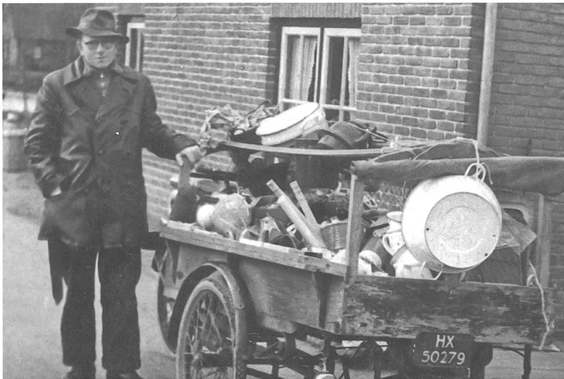
Abb. 8: Lastendreirad für den Direktverkauf: Verkauf gebrauchter Haushaltswaren, Ameide, Niederlande, vermutlich um 1950. (Nieuwsblad van de Historische Vereniging Ameide en Tienhoven, 2015-3, 34)