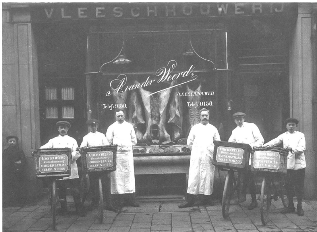
Abb. 6: In zeittypischer Form inszenierte Selbstdarstellung einer Amsterdamer Fleischei, 1917. Drei der vier Fahrer für die Kundenbelieferung sind Jugendliche. Die Warenkörbe dienen als Werbefläche. ( www.transportfiets.net/2007/06/25/vleeschhouwerij-a-van-der-weerd-1917 )