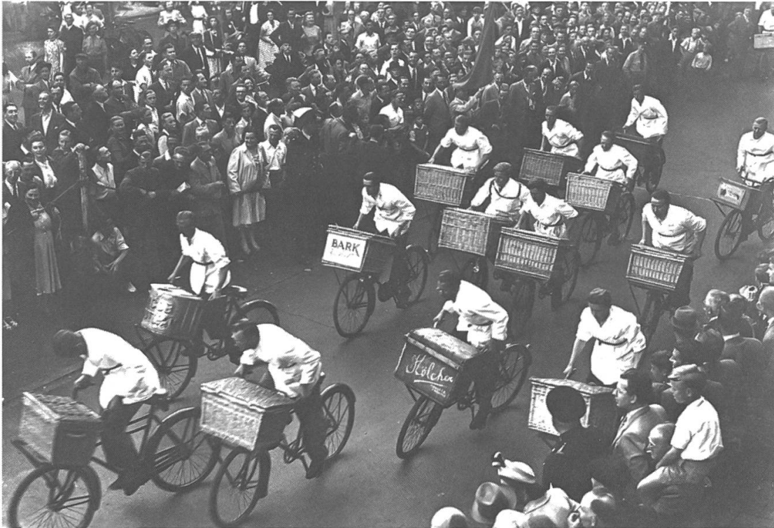
Abb. 10: Lastenradrennen in Amsterdam, 4. Juli 1949.

mehr wogen. Im täglichen Gebrauch wurden sie, dies legen zumindest Postkartenmotive nahe, häufig an Bürgersteigen oder am Strassenrand abgestellt. Seit den 1960er-Jahren erschwerte die schrittweise Umnutzung von Hinterhoflandschaften ebenso wie die zunehmende Suburbanisierung die Nutzung von Lastenfahrrädern. Zugleich ist davon auszugehen, dass sich nun die Fahrgeschwindigkeit auf den Strassen durch die stadtplanerische Optimierung für den Autoverkehr erhöhte. Der zeitweise Verzicht auf innerörtliche Geschwindigkeitsbegrenzungen für Automobile beschleunigte die Wahrnehmung des muskelkraftbasierten Langsamverkehrs als Verkehrshindernis. Die generell hohen Unfallzahlen von Fahrradfahrern/-innen in der Zwischenkriegs- und Nachkriegszeit lassen darauf schliessen, dass es gerade auch für Lastenradfahrer/-innen häufig zu gefährlichen Situationen kam. Der ländliche Raum war von diesen infrastrukturellen Entwicklungen natürlich weit weniger betroffen. Eine abnehmende Nutzung von Lastenfahrrädern war hier in stärkerem Masse durch den allmählichen Übergang zum motorisierten Transport bedingt.