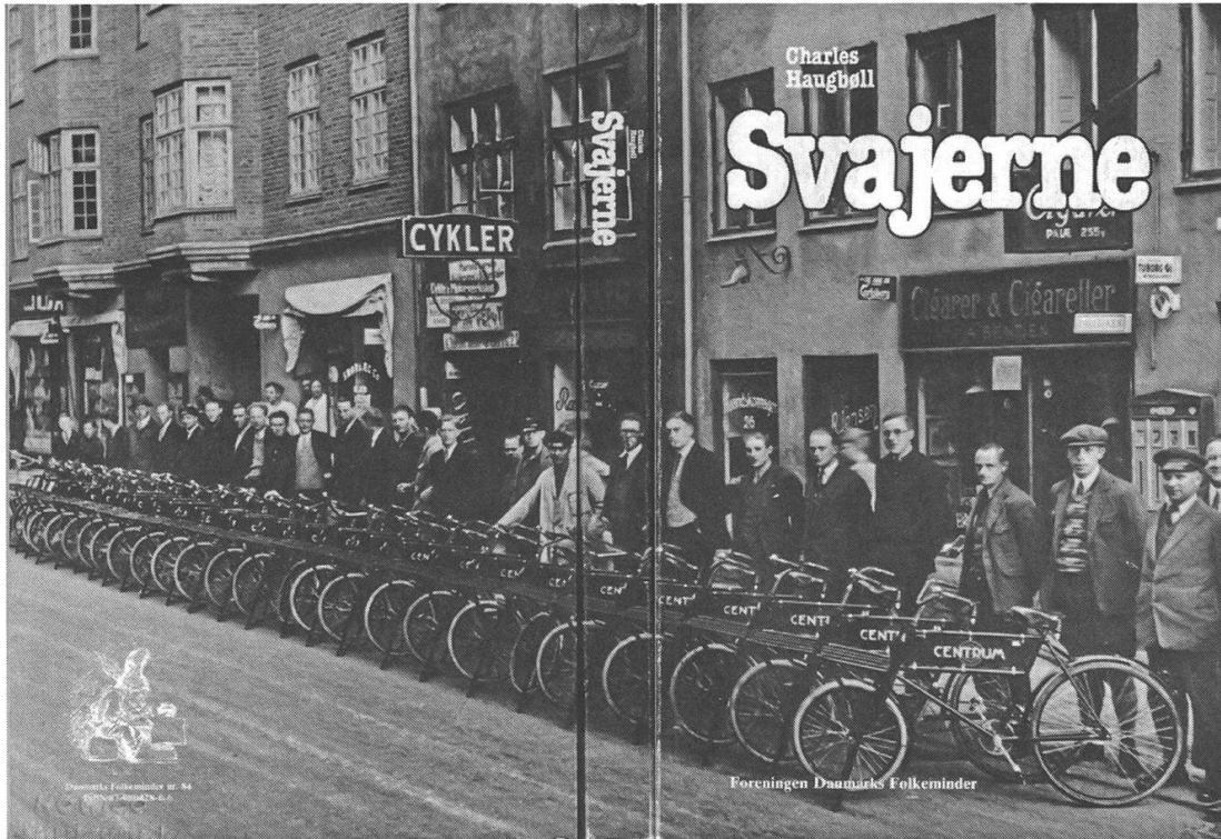
Abb. 13: Svajerne (Fahrradboten) – die 1979 publizierte Sammlung von Interviews mit Kopenhagener Lastenradfahrern im Kleingewerbe und im Post- und Telegrafendienst gibt einen detaillierten Einblick in den Alltag der Fahrer von den 1910er- bis in die 1960er-Jahre.

Neben Haugbølls mehrfach zitierte Interviewsammlung mit Kopenhagener Lastenradfahrern erinnert auch das eine oder andere Denkmal im öffentlichen Raum an die Hochkonjunktur des Lastentransports per Fahrrad: In der Hamburger Hohe-Luftchaussee steht vor dem dortigen Postamt seit den 1980er-Jahren eine «Post-liesl» neben ihrem mit Gepäcktaschen beladenen Standardrad, im niederländischen Megen befindet sich seit 2003 eine kleine, nach einem Diebstahl zwischenzeitlich erneuerte Skulptur eines Fahrradboten auf einem Lastenrad mit Korb. 46