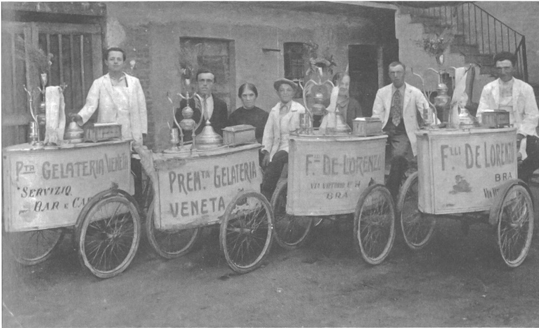
Abb. 7: Lastendreiräder für den Direktverkauf: Eismobile in Norditalien, frühes 20. Jahrhundert. (Dietmar Osses: Eismacher – Harte Arbeit für süsse Momente, in: LWL-Industriemuseum [Hg.], Wanderarbeit. Mensch – Mobilität – Migration. Historische und moderne Arbeitswelten, Essen 2013, 70–82, hier 75, mit freundlicher Genehmigung von Fabrizio de Lorenzo, Bielefeld)