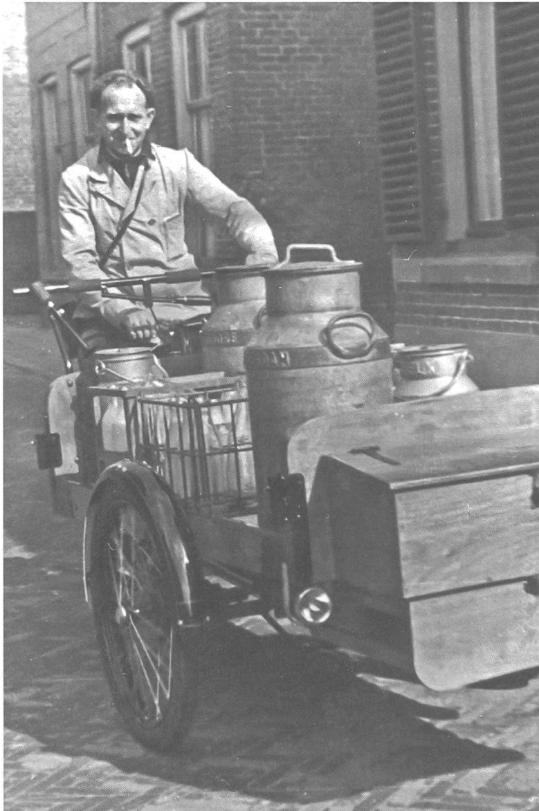
Abb. 9: Zustellung von Molkereiprodukten per Lastenrad, Ameide, Niederlande, 1950er-Jahre. (Nieuwsblad van de Historische Vereniging Ameide en Tienhoven, 2015-3, 34)

sind bislang nur schwer einzuschätzen. Dies gilt auch für die täglich im gewerblichen Gebrauch zurückgelegten Distanzen. Werbeanzeigen begründen erhöhte Zuladungsmöglichkeiten damit, dass auf diese Weise auf einer Tour zusätzliche Kunden bedient werden könnten. Ihre Gesamtlänge dürfte je nach Bedarf erheblich variiert haben. 34 Bei dem flottenmässigen Einsatz von Lastenrädern, insbesondere für die Post- und Milchbelieferung, ist von festen Tagestouren auszugehen. Für sehr schwere Lasten, beispielsweise den Transport von Bauteilen für Kachelöfen, gab es zuweilen Zuschläge. 35 In den Städten boten für das Kleingewerbe ebenso wie für eine pferdebasierte Infrastruktur genutzte Hinterhoflandschaften mit Schuppen und Remisen ausreichend Möglichkeiten des ebenerdigen Abstellens der Lastenräder, die unbeladen oft 20 bis 30 Kilogramm oder