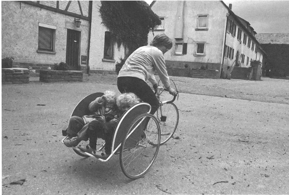
Abb. 11: Innovation «von unten» . Durch einen Karlsruher Ingenieur 1980 für den Transport seiner beiden Kinder modifiziertes Rennrad seiner Frau als Alternative zur riskanten Ausstattung eines Rades mit zwei üblichen Kindersitzen. Der Sitzkorb zwischen den Rädern auf Basis eines englischen Bausatzes konnte mit einigen Handgriffen gegen das Hinterrad ausgetauscht werden.