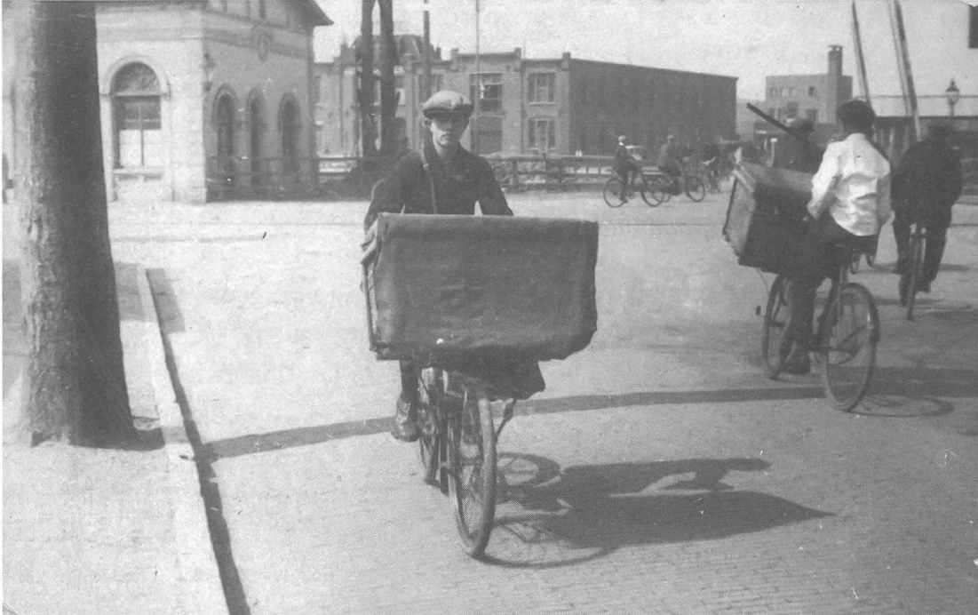
Abb. 1: Lastenradfahrer der Bäckerei Floor am Bahnhof von Amersfoort, Niederlande, 1930er-Jahre.