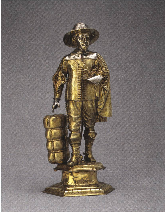
Abb. 4: Tobias Zeilner, Figur eines Berner Grosskaufmanns , 1643, Bernisches Historisches Museum .

17. Jahrhundert in der Schweiz schlicht nicht in die städtisch-bürgerlichen Wohnstuben oder die Esszimmer patrizischer Landgüter. Der «Geschmackstransfer» aus den Niederlanden war in dieser Hinsicht nicht allumfassend. 30