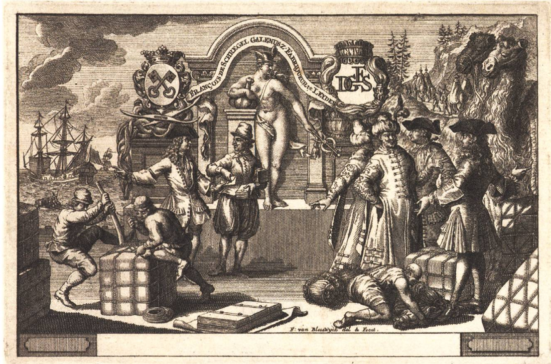
Abb. 3: Frans van Bleyswyck, Allegorie des Handels mit Merkur und Händlern, um 1700. (Rijksmuseum, Amsterdam)

aufzurufen. Werners Zugriff auf die Welt des Handels ist ungleich sinnlicher als derjenige Ammans. 16