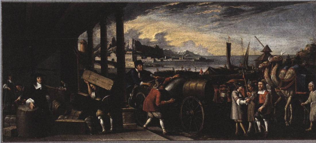
Abb. 5: Albrecht Kauw, Handelszyklus für das Kaufhaus Bern, Berner Standesläufer bestellt Waren in einem Überseekontor, 1671, Bernisches Historisches Museum.