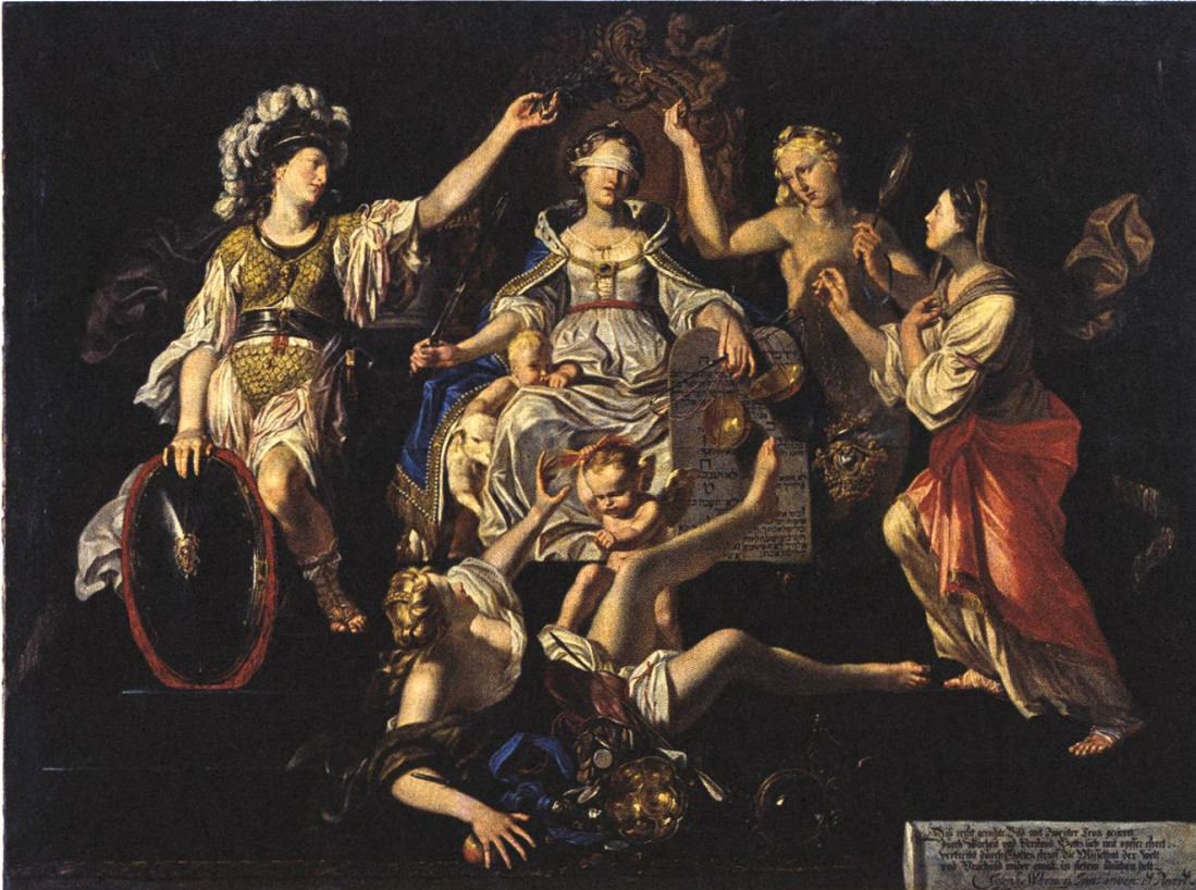
Abb. 7: Joseph Werner der Jüngere, Allegorie der Gerechtigkeit , 1662, Allegorie auf die Gerechtigkeit , 1662, Öl auf Leinwand, 166 × 225 cm, Kunstmuseum Bern, G 0539.

In Werners im Auftrag des Rates der Stadt Bern 1662 gemalter Allegorie der Gerechtigkeit (Abb. 7) liegt die Personifikation der «Missethat der Welt» besiegt und zu Boden gefallen zu Füßen der Justitia: Durch ein Eselsfell als dumm gekennzeichnet, entrollen ihr hier unter anderem Geldstücke, ein kostbarer Silberbecher und ein edelmetallener Spiegel mit Pfauenfederrahmung. Kostbarkeiten, wie sie zu Boden geworfen werden und fast über den Bildrand in den Betrachter/-innenraum rollen, stehen in der nur wenig späteren Mercatura -Allegorie desselben Malers stolz aufgereiht im Regal des Augsburger Kontors. 34