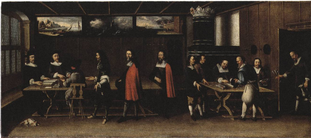
Abb. 6: Albrecht Kauw, Handelszyklus für das Kaufhaus Bern, Geschäftsabschluss in der Direktionsstube, 1671, Bernisches Historisches Museum.

Gemälde zeigt, die ständige Gefahr von Überfällen birgt. Im letzten Gemälde kommt der gelungene Abschluss des Geschäfts in der Direktionsstube des Berner Kaufhauses zur Darstellung, zur Feier werden Wein und Gläser hereingetragen (Abb. 6). Als Bilder im Bild sehen wir hier drei Leinwände über dem Täfer in der Amtsstube hängen, in zweien erkennen wir das Seestück und das Hafengebilde des Handelszyklus. Die übrigen Bilder hängen vermutlich gegenüber, auf der Seite der Betrachter/-innen. 32