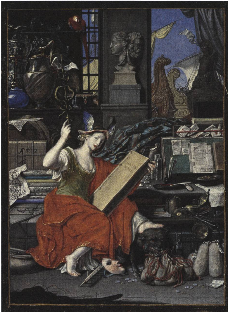
Abb. 1: Joseph Werner der Jüngere, Allegorie auf den Handel, 1668, Kunstmuseum Bern. (Kunstmuseum Bern, Inv.-Nr. A 1983.214)

Deckelkonstruktionen findet man in ganz ähnlicher Ausführung auch im Augsburg des 17. Jahrhunderts. Davor reihen sich ein kleineres, blaues Gefäß mit Deckel, das vermutlich aus China stammt, 5 eine Amphore aus einem Material, das wie Achat anmutet, ein Silberteller sowie ein schwarzhölzernes Schmuckkästchen, dessen halb geöffneter Deckel eine Perlenkette und einen Rubinanhänger sichtbar lässt. Den Bereich darunter füllen verschnürte Packen, in denen sich wohl Tuche befinden; ein Messstock und die acht Stoffballen, die sich dazwischen stapeln, legen dies nahe. Vor allem ein weisser Baumwollstoff (oder handelt es sich um einen papiernen Bildträger?) mit schwarzem Druck fällt ins Auge; er ist mehrfach vorhanden und wurde demonstrativ für die Betrachter/-innen der Miniatur ausgebreitet. 6 Links hinter Mercatura fällt der Blick auf eine Woldecke, die zusammen mit einer papiernen Landkarte auf einem Transportfass abgelegt wurde. Rechts hinter der Protagonistin liegt ein kostbarer türkisgold-rot gestreifter Seidenstoff, der wohl aus einem der europäischen Zentren der Tuchherstellung stammt, vielleicht aus Frankreich.