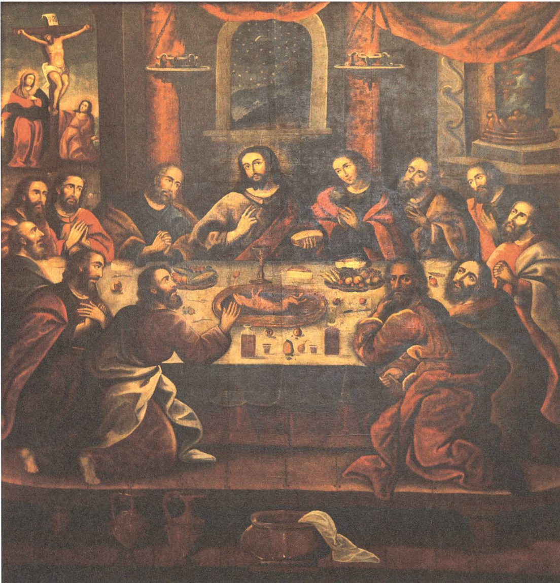
Abb. 1: Marcos Zapata, Das letzte Abendmahl, um 1553.

und christliche Aspekte verbindet und andererseits das religiöse Spannungsfeld des kolonialen Peru widerspiegelt.