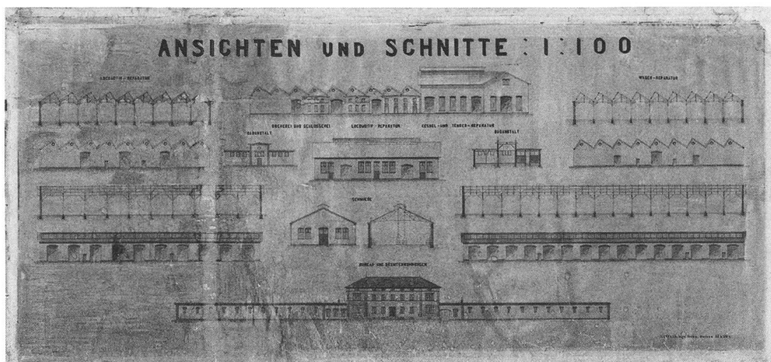
Abb. 2: Ansichten und Schnitte der Hauptwerkstätte Bellinzona, 1890.

Erhaltung dieser Dokumente besonderes Fachwissen und spezielle Ressourcen. Wichtige Dokumente und von Zerfall oder Obsoleszenz bedrohte Formate werden laufend digitalisiert.