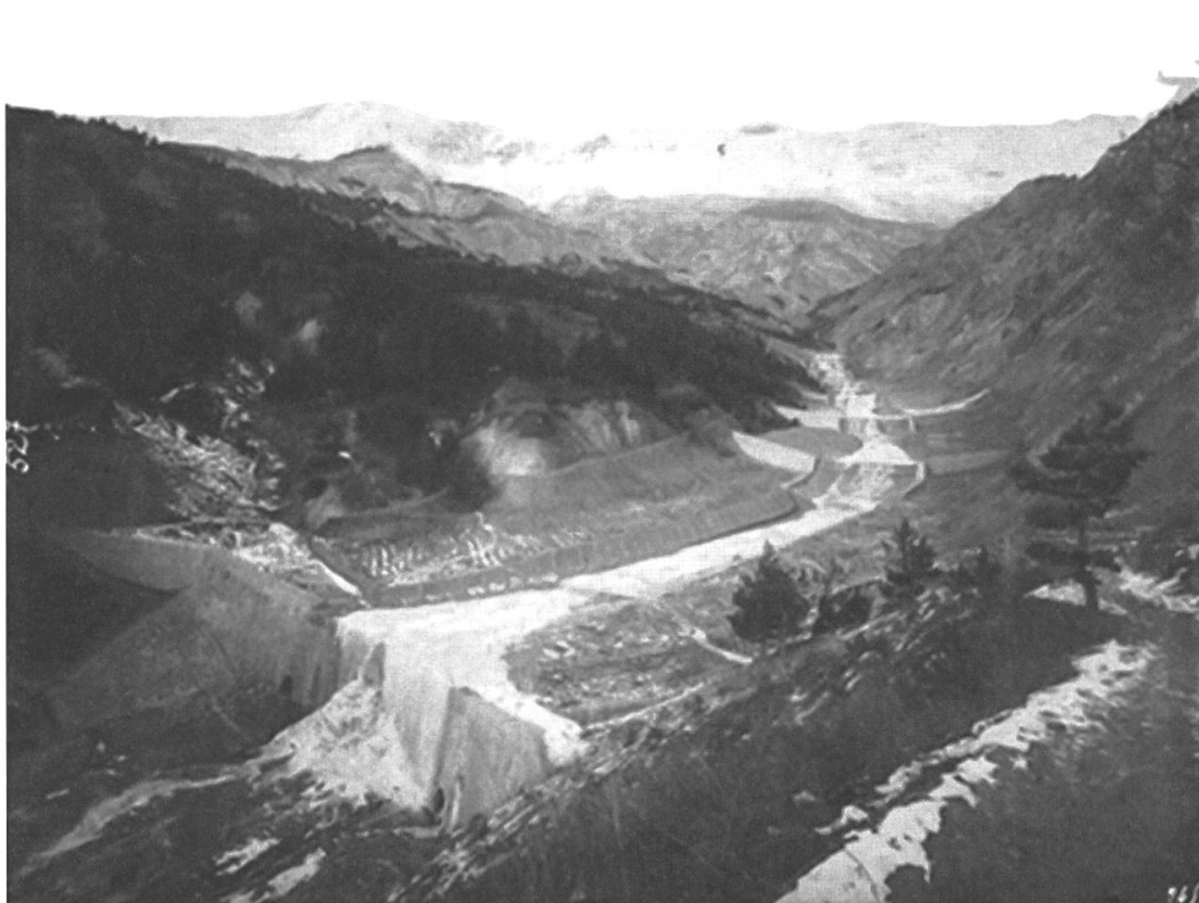
Fig. 1: Cliché des RTM, attestant des travaux réalisés pour canaliser les torrents. Source: Jean Paul Métaillé, Isabelle Richefort, L'Avalanche et le torrent. Les forestiers photographes de la montagne (1885–1940), Catalogue d'exposition, Toulouse 1990 .

construites en jouant sur la déclinaison de la pente sans pour autant donner lieu à des terrasses empierrées de type méditerranéen. Pour autant, en l'absence de réelles techniques de protection telles qu'elles se mettront en place en Suisse à la fin du XIX e siècle et majoritairement au XX e siècle en France, c'est le choix des emplacements pour installer les bâtis qui préside, à l'écart des couloirs récurrents de coulée, utilisant les replis de la pente comme protection naturelle (Fig. 2).