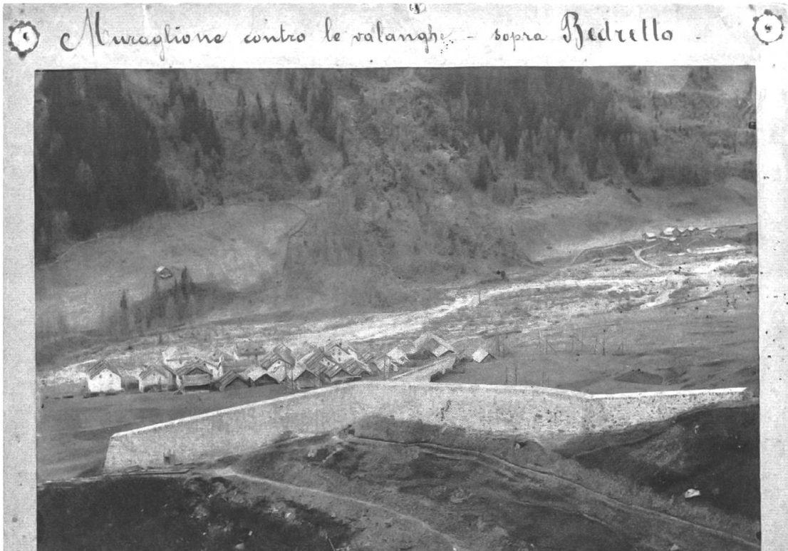
Fig. 3: Mur de protection au-dessus du village de Bedretto (Tessin).

d'Urseren à partir du milieu des années 1870. Il s'appuie sur la construction de murs de protection et de terrasses, renforcées par des poteaux enfoncés dans le terrain. 30 Un autre projet de mise en sécurité qui combine les mesures de reforestation avec la construction de murs de protection et de déviation (qui atteignent un volume de 9746 mètres cubes) et l'installation de pieux est réalisé dans le Val Bedretto (Tessin) entre 1889 et 1912 (Fig. 3). 31