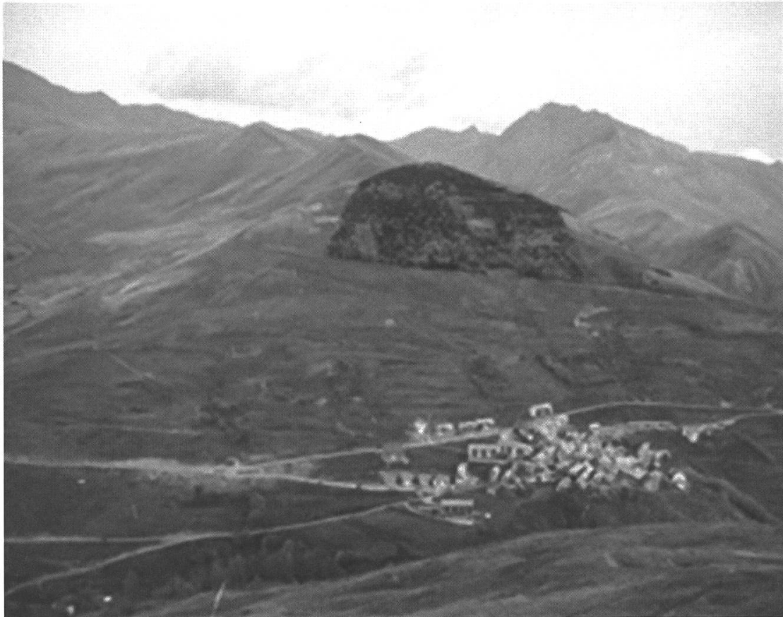
Fig. 2: Le Chazelet, hameau de la Grave, traces des terrasses en partie abandonnées avec la déprise agro-pastorale. Une forêt de reboisement au-dessus du hameau pour le protéger des avalanches: couloir à gauche du village, notamment après l'avalanche de 1971.

Motta d'Alp, au-dessus de la localité grisonne de Martina, provoqua de graves dégâts à la forêt. L'année suivante, le Service des forêts du canton des Grisons élabore un projet de protection fondé sur la construction, dans la zone de rupture, d'une série de murs de protection d'une longueur totale de 412 mètres. De plus, pour protéger le reboisement, on installe 17 rangées de poteaux de plus de 500 mètres de long, complétées par des plantations de conifères. 28 Le système de protection de la Motta d'Alp conçu par J. Coaz et par l'ingénieur des forêts Ludwig Rimathe se révèle efficace et suscite l'intérêt des spécialistes étrangers, notamment français et autrichiens, qui réalisent des aménagements semblables dans leurs pays. 29