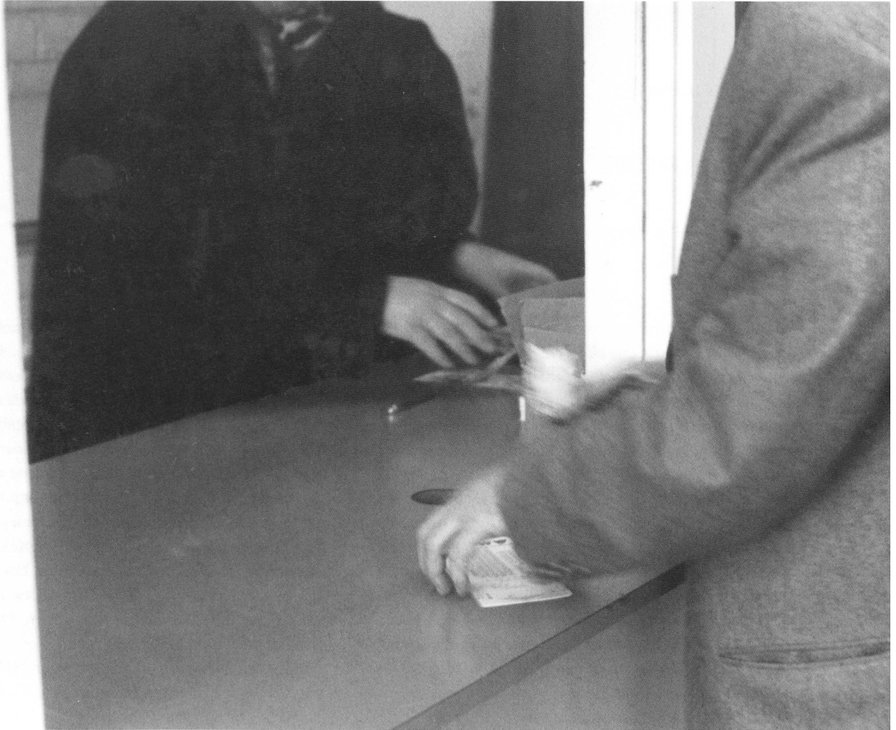
„Freudenau“ - Galopprennbahn

Sind Sie zufrieden mit den Orten, die Sie umgeben? Nach wessen Bedürfnissen wurden sie geschaffen? Oder hatten Sie jemals das Bedürfnis, selbst etwas zu gestalten. Haben Sie den Mut dazu? Sich den Blicken der anderen auszusetzen? Derjenige, der Visionen hat, ihnen nachgeht, geht das Risiko ein, nicht verstanden zu werden. Etwas anzubieten, das nicht dem allgemeinen Verständnis entspricht. Sich damit aussetzen - der Kritik, der Diskussion. Sie wollen sich nicht mehr damit zufrieden geben, was die Industrie Ihnen vorsetzt. An perfekten Bildern, wie Sie sein sollen. Sie exponieren sich, indem Sie Ihre Haltung preisgeben. Die womöglich abweicht von der Ihrer Freunde. Die etwas Eigenständiges behauptet. Jenseits der Normen. - Wie sähe dieser Ort aus?