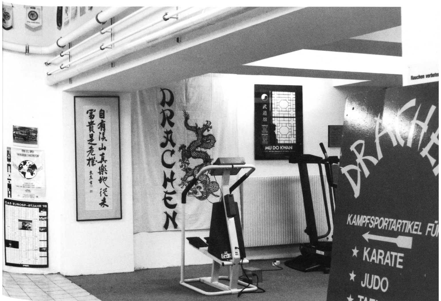
„Mudakwan“ - Center für asiatischen Kampfsport

Haben Sie sich auch schon gefragt, wessen Bild Architekten verwirklichen wollen? Ist es das Ihre? Sie wollten doch nur einen Ort, an dem Sie Ihr Bild, Ihr Wunschbild von sich selbst perfektionieren könnten. Oder nehmen Sie das Äussere gar nicht wahr? Vielleicht sind Sie so besessen von der Befriedigung Ihrer Bedürfnisse, oder der Anforderungen, die die Gesellschaft Ihnen vorgaukelt, dass Ihr Blick all das ausblendet, was nicht in Ihr System passt. Lassen Sie sich nicht täuschen. Auch wenn Sie es nicht bewusst wahrnehmen. Das, was Sie umgibt, beeinflusst Ihr Verhalten.