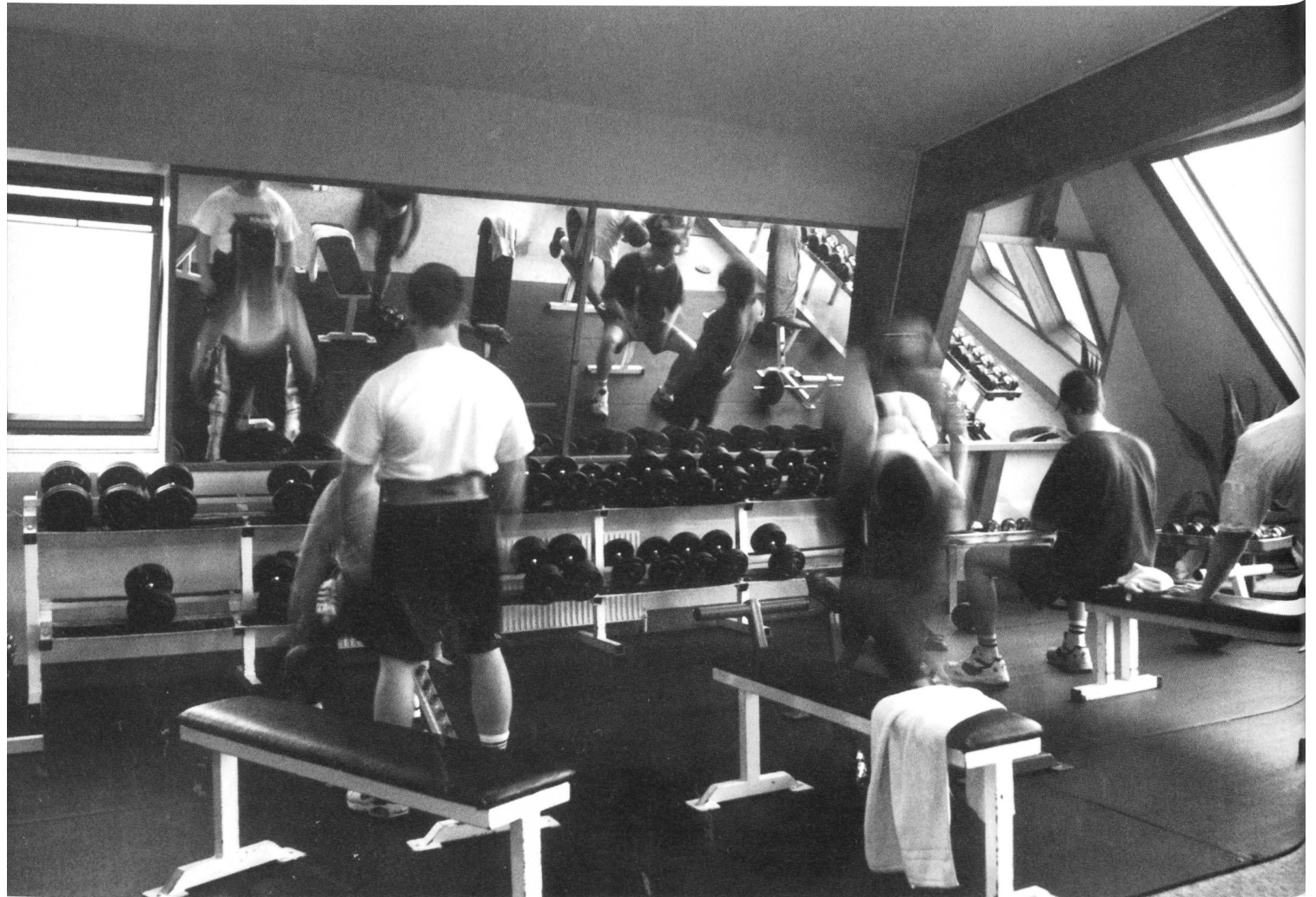
„Club Danube“ - Fitness Studio

Haben Sie jemals darüber nachgedacht, wie Architektur Ihre Wahrnehmung beeinflusst? Haben Sie manchmal das Gefühl, dass das Konkrete, dem Sie nicht ausweichen können, Ihnen etwas wegnimmt? Sie Ihrer Träume beraubt? Oder, dass Ihre Träume geweckt werden? Was sind Ihre Träume? Dem Alltag entrückt zu sein? Das Sie bestimmende Verhältnis zwischen "erfüllen müssen" und "sich hingeben" löst sich auf. Sie betreten einen Ort, an dem Sie sich offenbaren können. An dem sich Ihre Grenzen aufheben. Sie wissen nicht mehr, ob es Tag oder Nacht ist. Wo Ihre Realität liegt. Sie haben eine Ihnen nicht bekannte Ahnung, genährt von Ihrem Begehren. Der Wunsch, sich gehen zu lassen. Niemandem gerecht werden zu müssen. Nicht einmal sich selbst. Niemand urteilt über Sie. Sie allein schaffen sich einen Ort, der nur Ihnen gehört, der nur Ihnen entspricht. Niemand sagt Ihnen, wie Sie sich verhalten sollen, was Sie fühlen sollen.