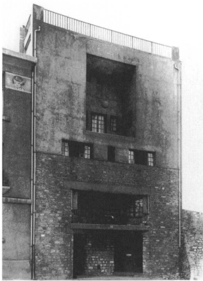
Adolf Loos, Haus Zara , Paris, 1925