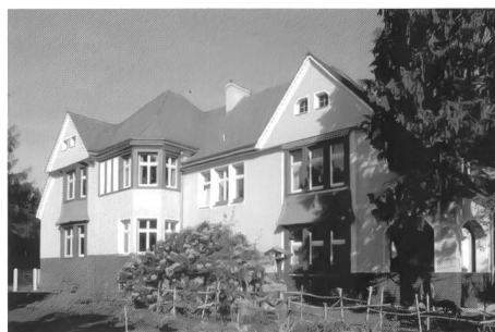
Marga, Gartenstadt, Senftenberg

reagiert werden kann, koordiniert die IBA seit 2003 das Projekt Restrukturierung von Siedlungsbeständen als Teilvorhaben des EU-Projektes REKULA (Restrukturierung von Kulturlandschaften). Im Rahmen des mit der Politechnika Śląska in Gliwice, der oberschlesischen Stadt Zabrze, der Region Venetien und der Fondazione Benetton Studi Ricerche in Italien durchgeführten Projektes wird der Umgang mit Siedlungsbrachen und Entleerung im Erfahrungsaustausch mit vergleichbaren Regionen im europäischen Raum modellhaft umgesetzt. Die IBA kann damit in der aussergewöhnlichen Situation des raschen regionalen Strukturumbrechtes in der Lausitz Lösungsansätze entwickeln, die in den kommenden Jahren auch für andere Landschaften Europas mit entsprechenden Schrumpfungsentwicklungen Modellcharakter übernehmen.