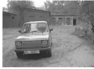
Borsig-Siedlung, Beete und Wege, Zabrze