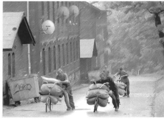
Borsig-Siedlung, Arbeiter, Zabrze