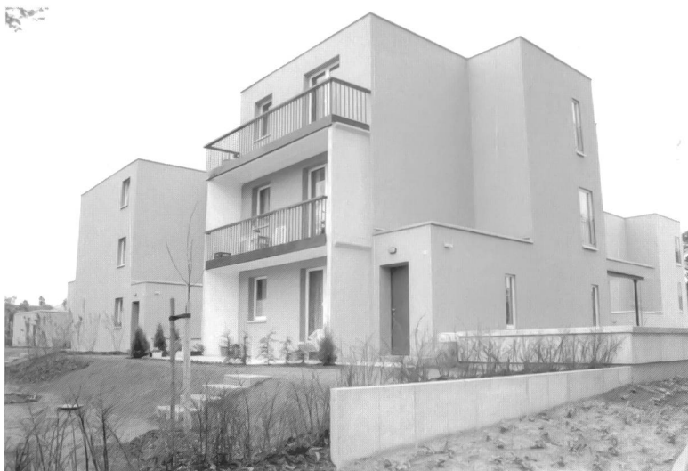
Sachsendorf-Madlow , Nachnutzung von Plattenbauten, Cottbus, 2002

tragenden Stahlbetonfertigteile nachzunutzen. Statt eines schnellen Abrisses unternahm man den Versuch, die Gebäudeelemente so zu demontieren, dass sie im Schwenkradius eines Baukrans zwischengelagert und zu fünf neuen zwei- und dreigeschossigen Wohnhäusern zusammengesetzt werden konnten. Sofort mit dem Abschluss der Bauarbeiten Anfang 2002 wurden die 13 Wohnungen komplett vermietet.