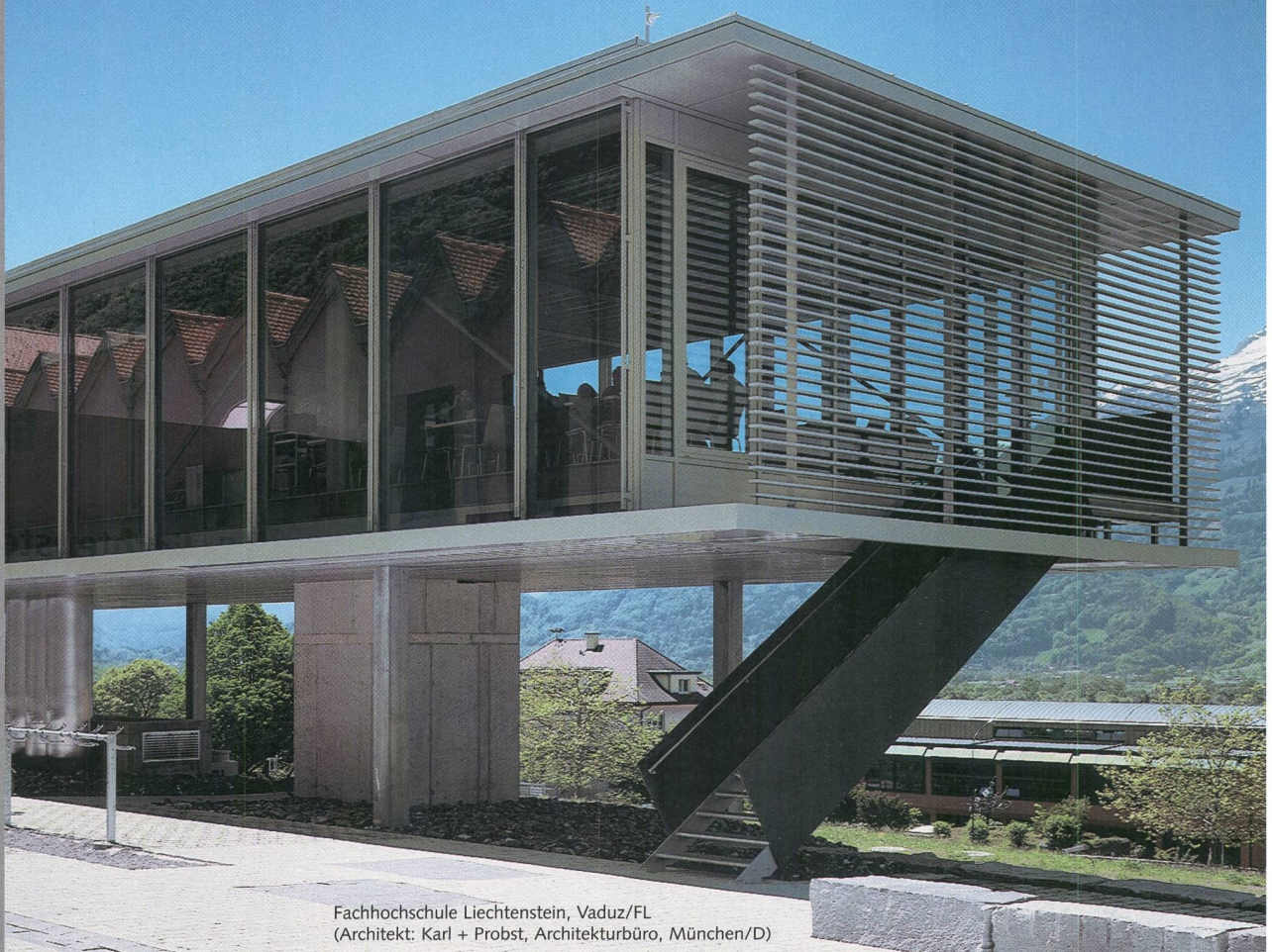
Fachhochschule Liechtenstein, Vaduz/FL (Architekt: Karl + Probst, Architekturbüro, München/D)