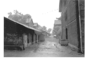
Borsig-Siedlung, Schuppen und Wohnhaus, Zabrze

Auf den ersten Blick bietet sich dem Besucher ein wenig zuversichtliches Bild: Die technische Infrastruktur der mit Kohleöfen beheizten Gebäude wurde in den vergangenen Jahrzehnten nur notdürftig repariert und entspricht weitgehend dem Ursprungszustand. Toiletten werden meist gemeinschaftlich genutzt. Ein grosser Anteil der Einwohner ist arbeitslos. Bei genauerer Betrachtung stellen sich aber auch Qualitäten der Borsig-Siedlung heraus: Eine Leerstandsquote von unter 5 Prozent, der „Tante Emma-Laden“, Kirche und Friedhof, die Schule und nicht zuletzt die gut besuchte Gastwirtschaft sind deutliche Zeichen dafür, dass die Siedlung lebendig ist.