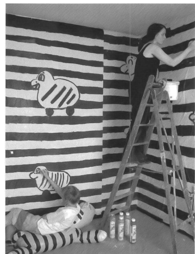
Hotel Neustadt , Jugendliche gestalten die Zimmer und einen Schriftzug für die Fassade, Halle Neustadt, Fotos von Annett Jummride, 2003