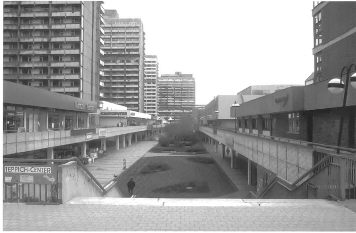
Halle Neustadt, Zentrum

Interessant ist, dass schrumpfende Städte oft kulturelle Hochburgen sind, in denen sich aus Subkulturen Hochkulturen entwickeln, die global bekannt werden, und rückwirkend positiv zum Image der Städte beitragen. Beispiele sind Detroit, Manchester und Liverpool, die vor allem in der Musik Wegweisendes geschaffen haben. Doch von der Musik allein kann keine Stadt existieren. Es gilt, Potentiale schrumpfender Städte zu erkennen und zu nutzen. Wachstum und Schrumpfung sind Phänomene, die sich abwechseln, die heute sogar innerhalb einer Stadt parallel laufen, und die weder nur positiv noch nur negativ sind.