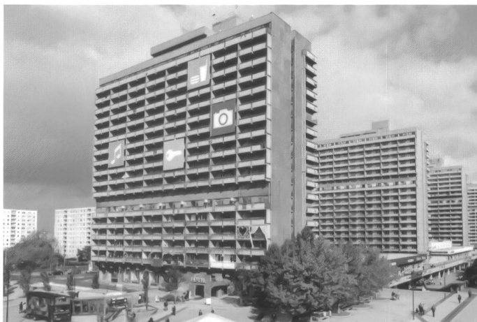
Hotel Neustadt, Halle Neustadt, Foto von Hedi Lusser, 2003

überregionalen Berichten, die auf Halle seit langem mal wieder ein gutes Licht werfen. Leerstand und Schrumpfung sind aktuelle Themen. Abriss eine Möglichkeit. Eine andere ist Häuser für Zwischennutzungen zur Verfügung zu stellen, um so weiteren Verfall zu verhindern. Wie viele Beispiele besetzter Häuser weltweit und auch das Hotel Neustadt zeigen, bedeutet ein leer stehendes Haus nicht unbedingt kein Interesse am Haus, oder kein Bedarf, sondern nur, dass es im Moment nach den marktwirtschaftlichen Bedingungen nicht funktioniert. Ein bereit stellen und öffnen der Häuser für Interessenten, wie zum Beispiel Jugendliche, kann eine Aufwertung für das Haus, wie auch die umliegenden Häuser bedeuten, für mehr als einen Sommer.