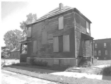
Detroit, Innenstadt, Foto vom Projektbüro Phillip Oswald

Kriege, Naturkatastrophen und Epidemien sind heute wie früher Faktoren, die das Wachstum städtischer Populationen beeinträchtigen. Daneben führen auch Deindustrialisierung, Suburbanisierung, räumliche Polarisierung und demographischer Wandel zum Schrumpfen.