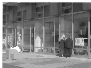
Hotel Neustadt, Espresso bar, Halle Neustadt, Foto von Annett Jummrde, 2003

Das Hotel Neustadt hat gezeigt, dass Theater und Architektur in Problemgebieten, wie schrumpfenden Städten, kreatives Potential wecken können, indem sie Raum als Aktivität begreifen. Benjamin Foerster-Baldenius stellte dazu fest: „Auf der Suche nach neuen Wegen im Städtebau können wir viel mit dem Theater lernen. Von der zeitweisen Realisierung von Visionen können beide profitieren, das Theater bekommt Bodenhaftung und Publikumsnähe und die Stadtplaner können ihre Statistiken und Parkplatzzählereien ablegen und wieder Ideen produzieren. Und der Stadt kann es nur gut tun, wenn man ihr immer wieder zeigt, was mit ihr möglich ist.“