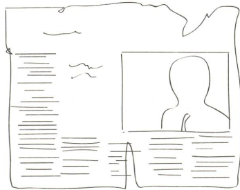
Bund 06 - fig. b Zeitungsartikel über den Architekten Cedric Price, in The Guardian, July 4th 1964.

Der Architekt des Fun Palace war Cedric Price. 13 Der Freund von Archigram und Mitverfasser der ersten Archigram-Magazine hatte bereits 1961 damit begonnen, Littlewoods Vision für den Fun Palace als interaktiven Theaterraum zu entwickeln. Dieser sollte aus unterschiedlichen Einheiten, aufblasbaren Hallen usw. je nach Standort neu zusammengesetzt werden können. 13 Als additives System sollte sich der Fun Palace an ganz unterschiedliche Situationen der Stadt anpassen können, je nachdem, wo gerade brachliegende Flächen in geeigneten Nachbarschaften besetzt werden konnten: «Take over bits considered for slag heaps, dumps and wastelands .... anything up to 5000 acres». 14 Tatsächlich wurde der Fun Palace nicht als singuläres Gebäude, sondern als mobiles Raumsystem gedacht, das in der gesamten Stadt Teil eines Programms sozialer Regeneration sein sollte. Der Fun Palace hatte insofern prototypischen Charakter.