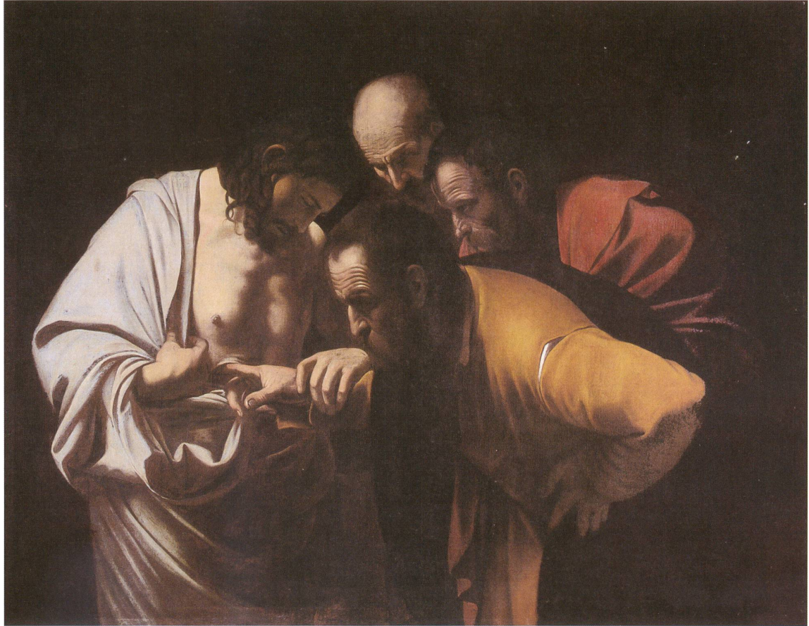
fig. a Caravaggio - Der ungläubige Thomas (1601 - 02) Öl auf Leinwand, 115 x 146 cm Neues Palais, Potsdam