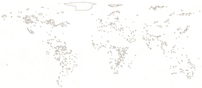
fig. a Skizze Nationalparks (größer als ca. 1'000 km 2 ) wurde anhand der 'World Database on Protected Areas' erstellt. Stand: Sept. 2010.

Handel und diversen Vereinstätigkeiten. Dieses kleinmassstäbliche Eingreifen in den Raum lebt davon, seine Geheimnisse nicht preiszugeben. So wie ein Hacker, der unbeobachtet in (virtuelle) Räume eindringt und nicht erkannt werden will, um seine Ziele aus der Anonymität heraus verwirklichen zu können, möchte auch Bartleby unsichtbar bleiben. Er weiss über die Räume, die er einnehmen möchte, sehr gut Bescheid und um seine Strategien aufgrund der Basis von umfassendem Wissen über sein Umfeld zu entwickeln, ist er auch bereit, eine Vielzahl persönlicher Entbehrungen auf sich zu nehmen. Unter dieser Fülle räumlicher Voraussetzungen im heutigen realen und virtuellen Raum und dem fiktiven Raum des Romans scheint es mir logisch und sinnvoll, Melvilles Werk noch einmal genauer hinsichtlich Bartlebys Strategien im Raum zu durchleuchten. Diese Strategien wurden nicht zufällig