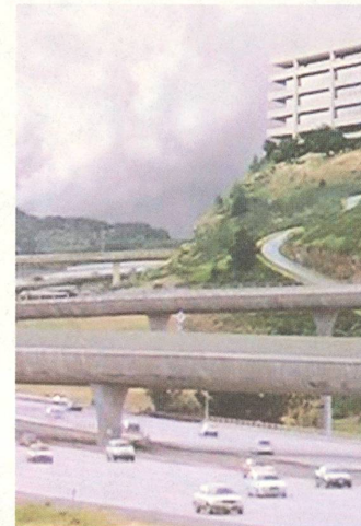
fig. b Filmstill aus Bartleby, Johathan Parker, 2001: die Anwaltskanzlei.

... seine Absage an die Kopie ist auch eine Absage an das Gesetz. 12 Dieses baut nämlich auf dem Kopieren auf und Bartlebys Logik des Negativismus ist imstande das Gesetz des Raumes zu dekonstruieren. 13 Gerade unter aktuellen räumlichen Voraussetzungen, in der sich transnationale Räume wie McDonalds, Starbucks, Nationalparks und Shopping Center an allen Orten in der gleichen Gestalt wiederholen, scheint die Verweigerung der Anfertigung einer weiteren Kopie bzw. das Einnehmen dieses kopierten Raumes eine brauchbare Strategie, um den Diskurs über Einschlüsse innerhalb transnationaler Räume weiterzuführen und einer scheinbaren Ausweglosigkeit entgegenzuarbeiten.