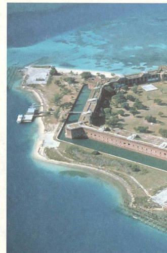
fig. c Fort Jefferson im Nationalpark Dry Tortugas (USA)