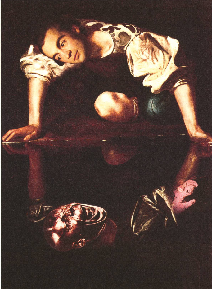
fig. a «Grimassen und Freaks», Collage von Michael Hirschbichler auf Basis von «Narziss», Caravaggio, 1598/99.

«Fliehe den auffallend Schiefblickenden, Schiefmauligen; mit breit-hervordringendem Kinne – am meisten, wenn er dir mit unterdrücktem Hohne Höflichkeiten sagt – bemerke die unverbergbaren Falten auf den Backen.» 1