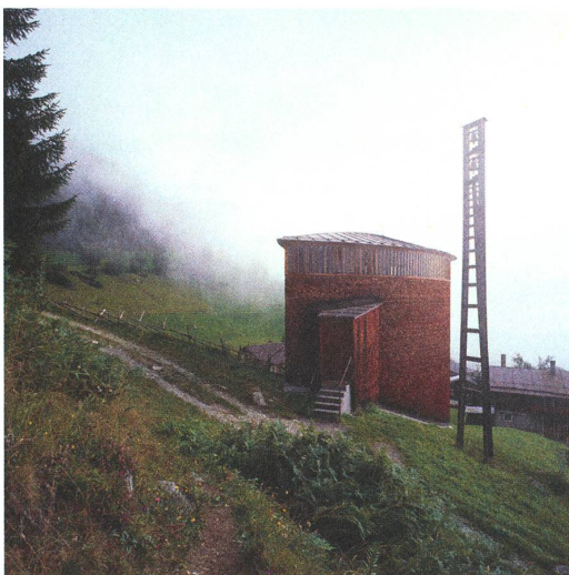
fig. d, e, f Kapelle Sogn Benedetg – Sumvitg.

ihn beispielsweise durch angeschnittene Formen imaginär über den Bildrand hinaus fortsetzen und erweitern.