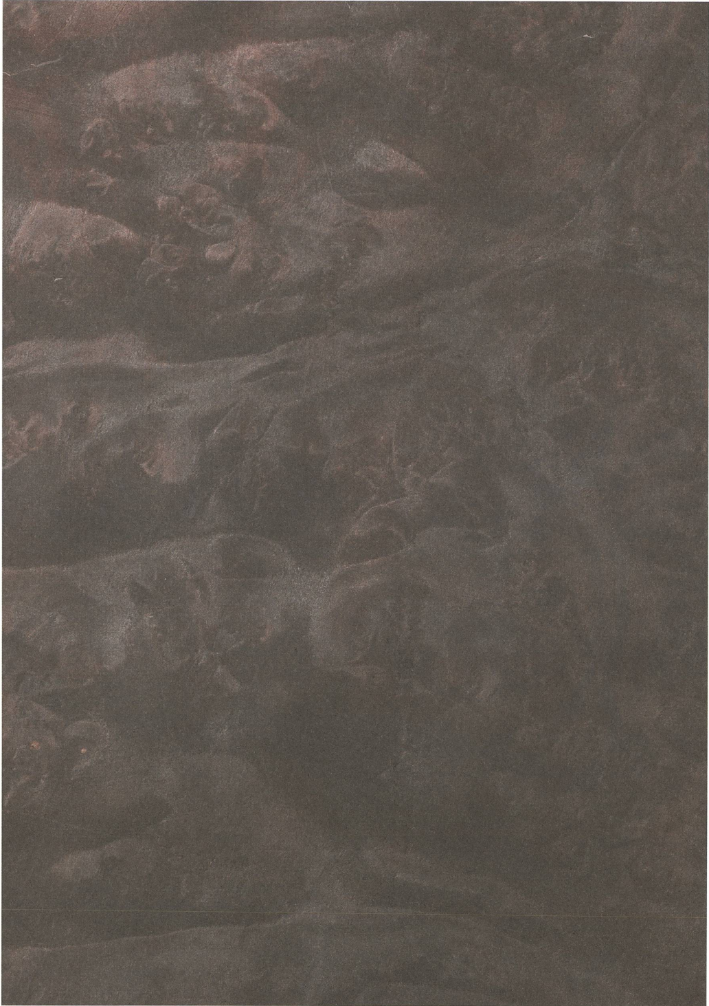
Holz furnier