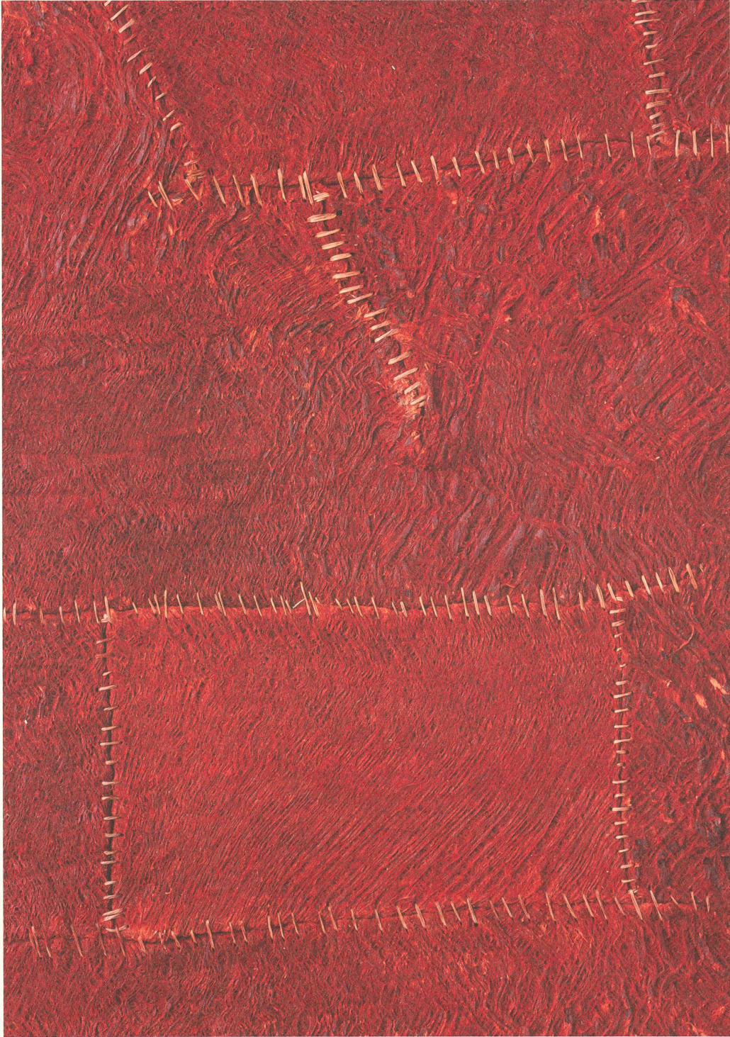
Rindentuch © Strasser AG, Thun