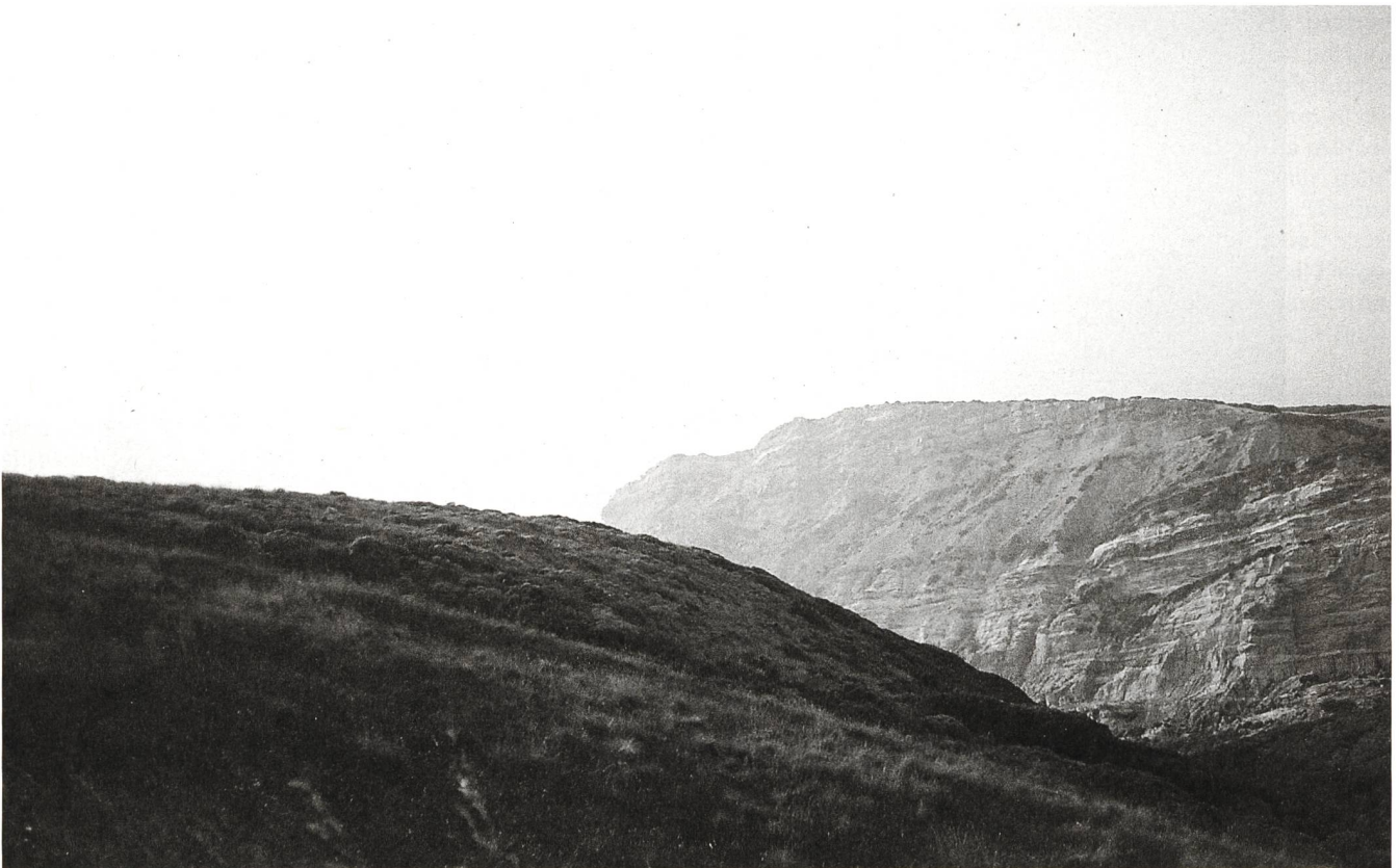
Portogallo, 2006