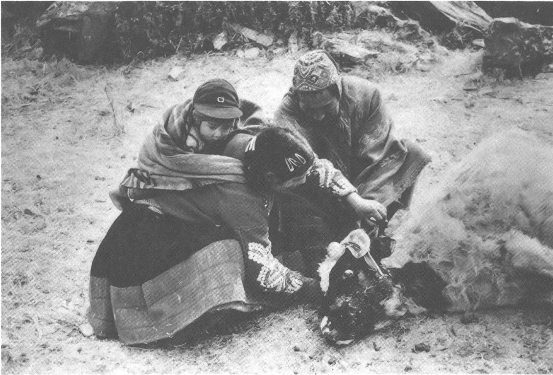
Nach dem Beschneiden der Ohren wird dem Kalb ein adorno (Schmuck), bestehend aus einer Schnur, auf der Orangen, Brot und Pflanzen aufgefädelt sind, umgehängt.

spätere Einbrennen vorwegnehmend legte man ihnen einen getrockneten Kuhfladen auf die Schultern und markierte mit den Brenneisen das Brennen. Auch sie erhielten den gleichen Halsschmuck, bestehend aus Brot und Orangen, umgehängt. Dann band man sie los. Mit gesenktem Kopf gingen sie wie wild auf die Teilnehmer los. Zum grossen Gelächter erwischten sie natürlich uns Gringos, die vor lauter Schauen und Staunen nicht merkten, was passieren würde, und sich nicht rechtzeitig in Sicherheit bringen konnten.