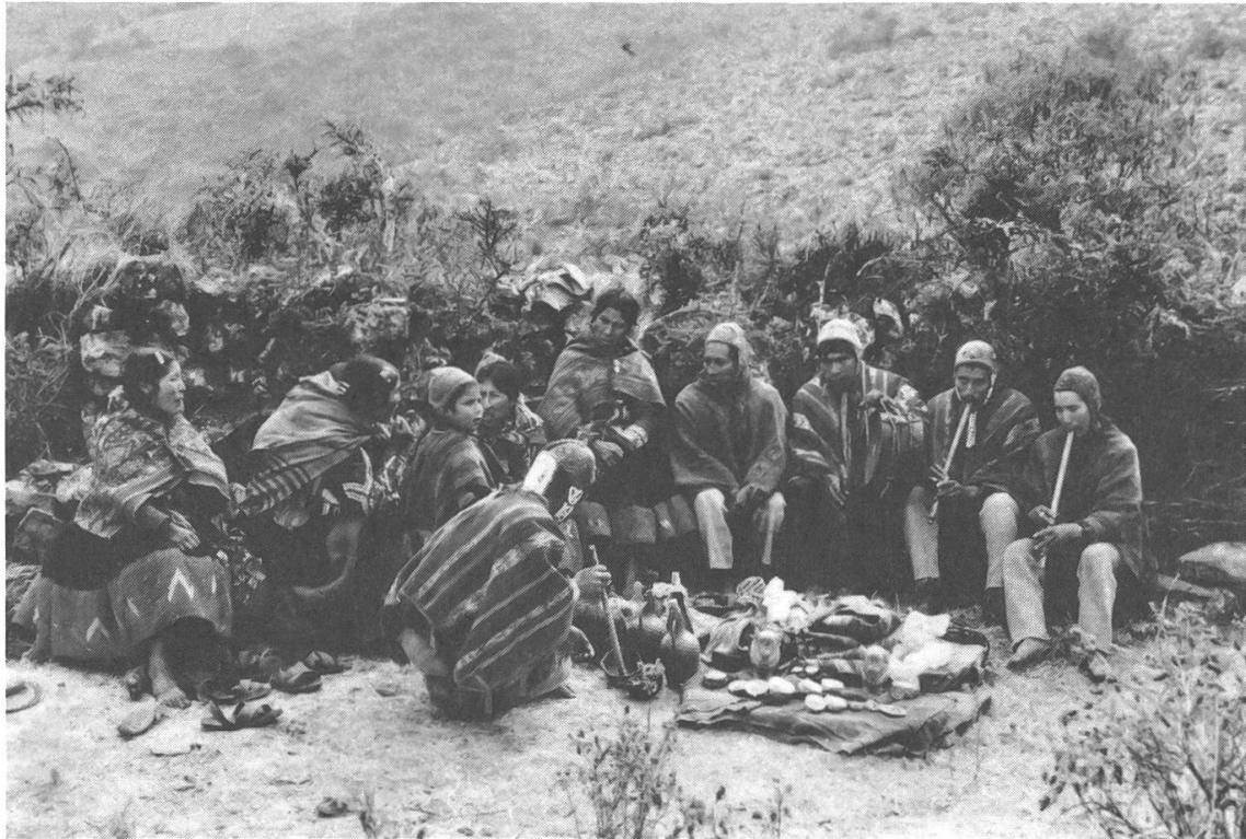
Die Familie sitzt im Halbkreis um die misa (Opferstelle) mit den beiden Tonstieren. Die Männer sitzen auf der einen Seite und musizieren, die Frauen auf der anderen und singen.

plaziert. Vor den Stieren befanden sich etliche Muschelhälften und Schneckenschalen, dahinter die Opferbündel mit den übrigen Zutaten, wie Coca-Blätter, untu , taku (oxydierte Erde), Messer, Brot, Orangen etc., die für die Zeremonie gebraucht wurden.