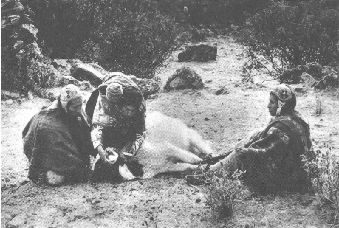
Das Kalb ist zu Boden geworfen und gebunden. Der vaquero hält das Seil straff, währenddem die übrigen Familienmitglieder nacheinander dem Kalb Chicha einflößen.