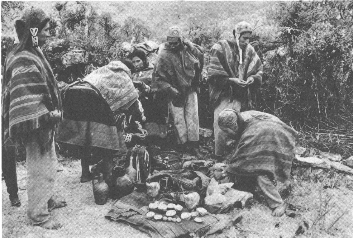
Die einzelnen Familienmitglieder stellen kleine Opfergaben aus Coca-Blättern zusammen, verteilen sie über die misa und offerieren sie anderen Familienangehörigen.

gestreut wird, gefüllt. Alle Teilnehmer, auch Tim und ich, mussten mit je einem Schälchen voll Chicha und kaniwa in jeder Hand in den Korrall zu den Kühen gehen, und den Inhalt über sie leeren.