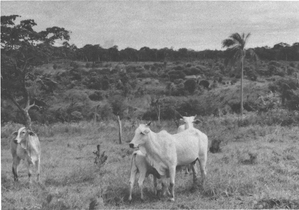
Weniger Jagd, dafür mehr Haustiere. Kühe in Cerro Ākangue.