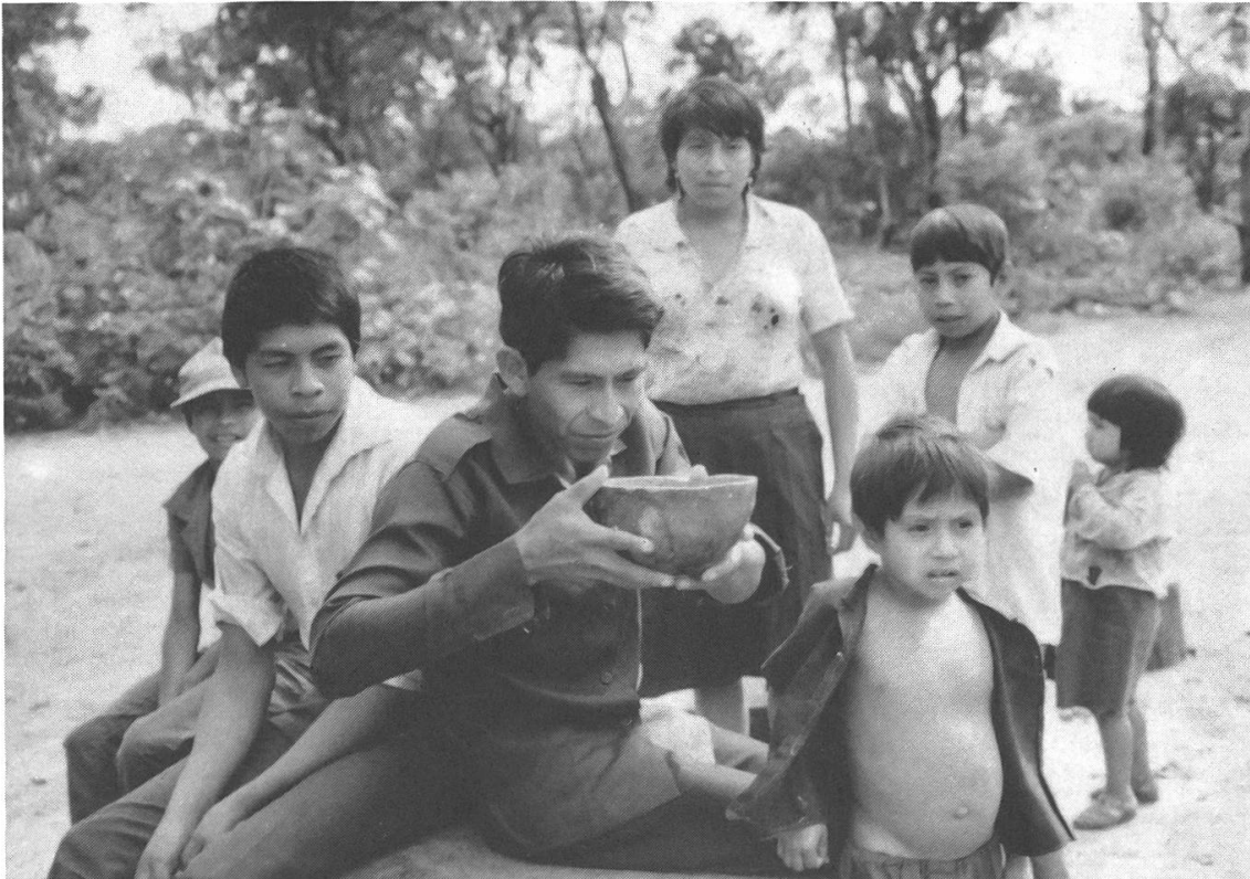
Der junge mburuvixa von Cerro Ñkangue trinkt kanguĩ (Maisbier).

Teilnehmenden der Gruppe bekannt, wieviel Neuland er gerodet und wieviel Brachland ( kokuere ) er gereinigt haben will. Einige benötigen vielleicht nur eine halbe Hektare, die meisten um die zwei Hektaren. Beim mburuvixa können es bis zu fünf Hektaren sein. Die Arbeitsgruppe bleibt nun während der Rodungszeit zusammen und geht von Haus zu Haus, um die geplanten Arbeiten nach und nach auszuführen. Meistens steht den Arbeitenden dann in den jeweiligen Häusern auch Maisbier zur Verfügung, das von den Frauen zubereitet wurde. Nach der Rodungszeit löst sich die Gruppe auf und jede Familie bestellt und erntet ihre Felder selbst. Meistens wird dann auch ein Teil des Ertrages unter der Leitung des mburuvixa gemeinsam verkauft, da sich dadurch bessere Preise erzielen lassen. Die im Haus des politischen Führers gesammelten Reis-, Mais- und Bohnensäcke sind jedoch individuell gezeichnet, so dass jedermann auch nur das verkauft, was er produziert hat.