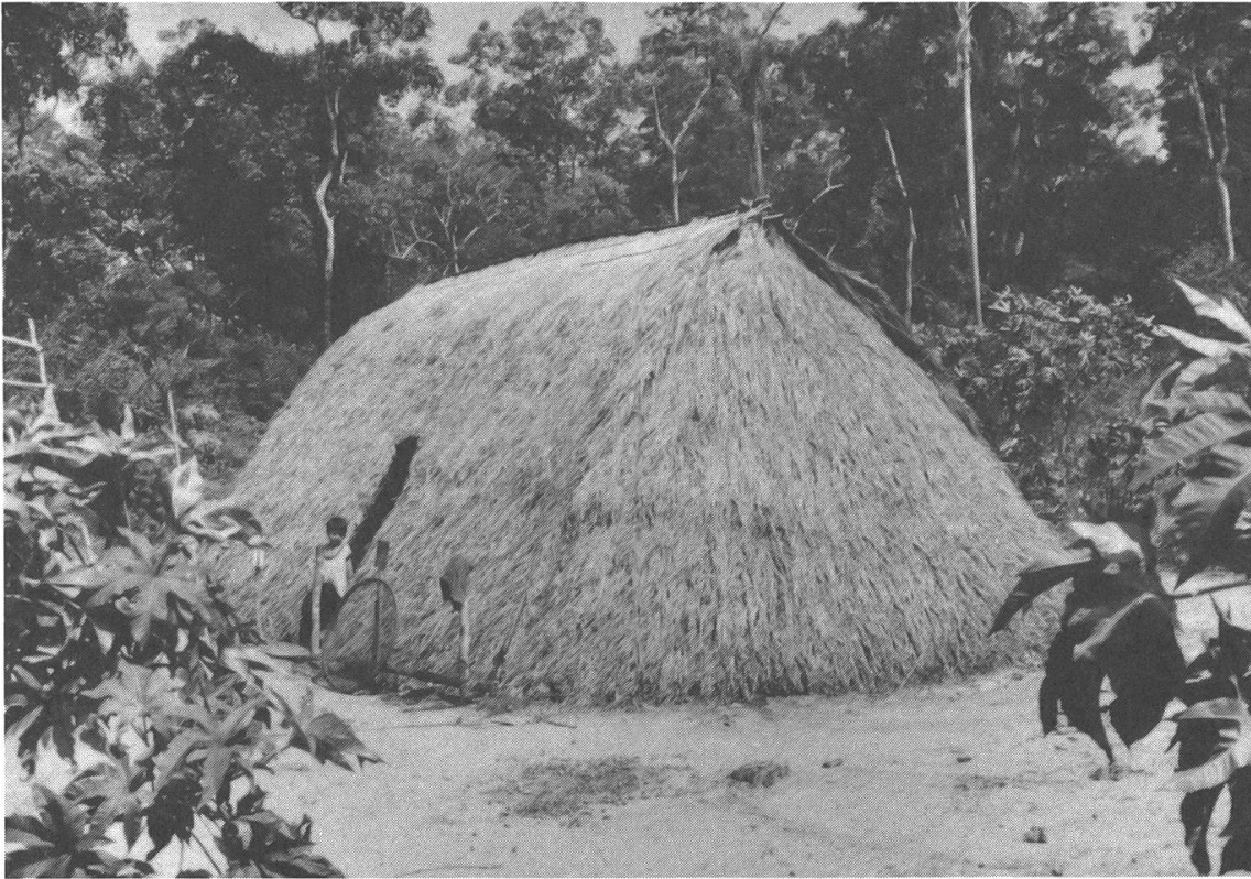
Das traditionelle Langhaus der Paï.

men sowohl Männer als auch Frauen und Kinder teil, solche, die im mba'e pepy mitgearbeitet haben, und auch solche, die es, aus welchen Gründen auch immer, nicht taten. Das mba'e pepy ist eine einfache Form zur Leistung gemeinschaftlicher Arbeit, wie sie auch in anderen Kulturen beobachtet werden kann. Obwohl in erster Linie wichtig für die Rodungsarbeiten, wird das mba'e pepy ebenfalls angewendet für die nachträgliche Reinigung der Felder, für den Hausbau und in neuerer Zeit ebenfalls für die jährliche Reinigung der Grenzlinien der Kolonien und für das Öffnen von neuen, befahrbaren Wegen.