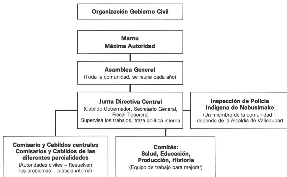
Schéma de l'organisation civile que les Arhuaco se sont donnée. (Source: Unidad Indígena . 10 Años. N° especial (febrero 1986), p. 17).