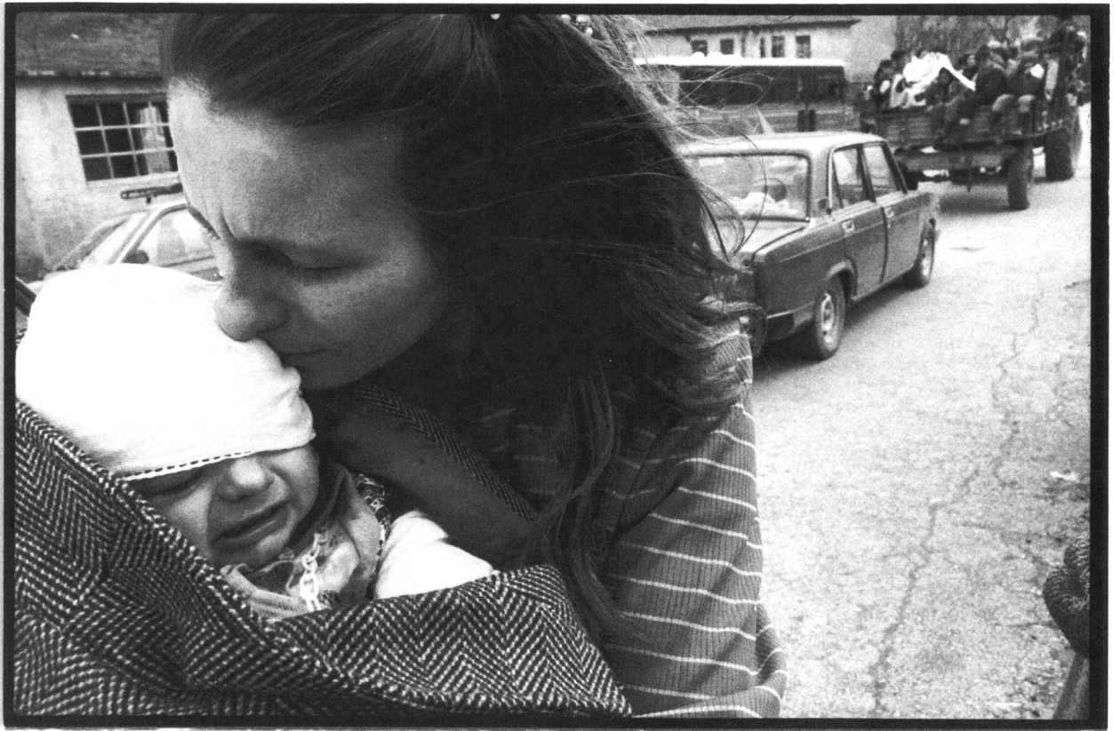
Albanie (nord) - A la frontière kosovare-albanaise, arrivée des réfugiés kosovars. fin mars-début avril 1999